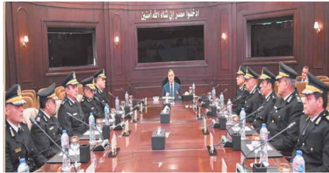
وفي نهاية الاجتماع أكد وزير الداخلية أهمية التواجد الميداني لكافة المستويات الإشرافية لتابعة تنفيذ الخطة الأمنية ومراعاة البعد الإنساني لدى التعامل مع المواطنين أثناء تنفيذ الخطة

«توفيق» يتابع خطط تأمين المنشآت خلال احتفالات رأس السنة ويشدد على الحذر واليقظة