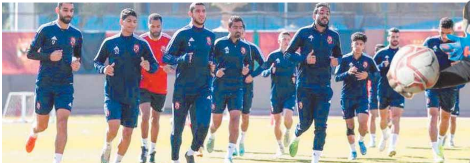
الأهلي يخوض تدريباته استعدادا لمواجهة بيراميدز