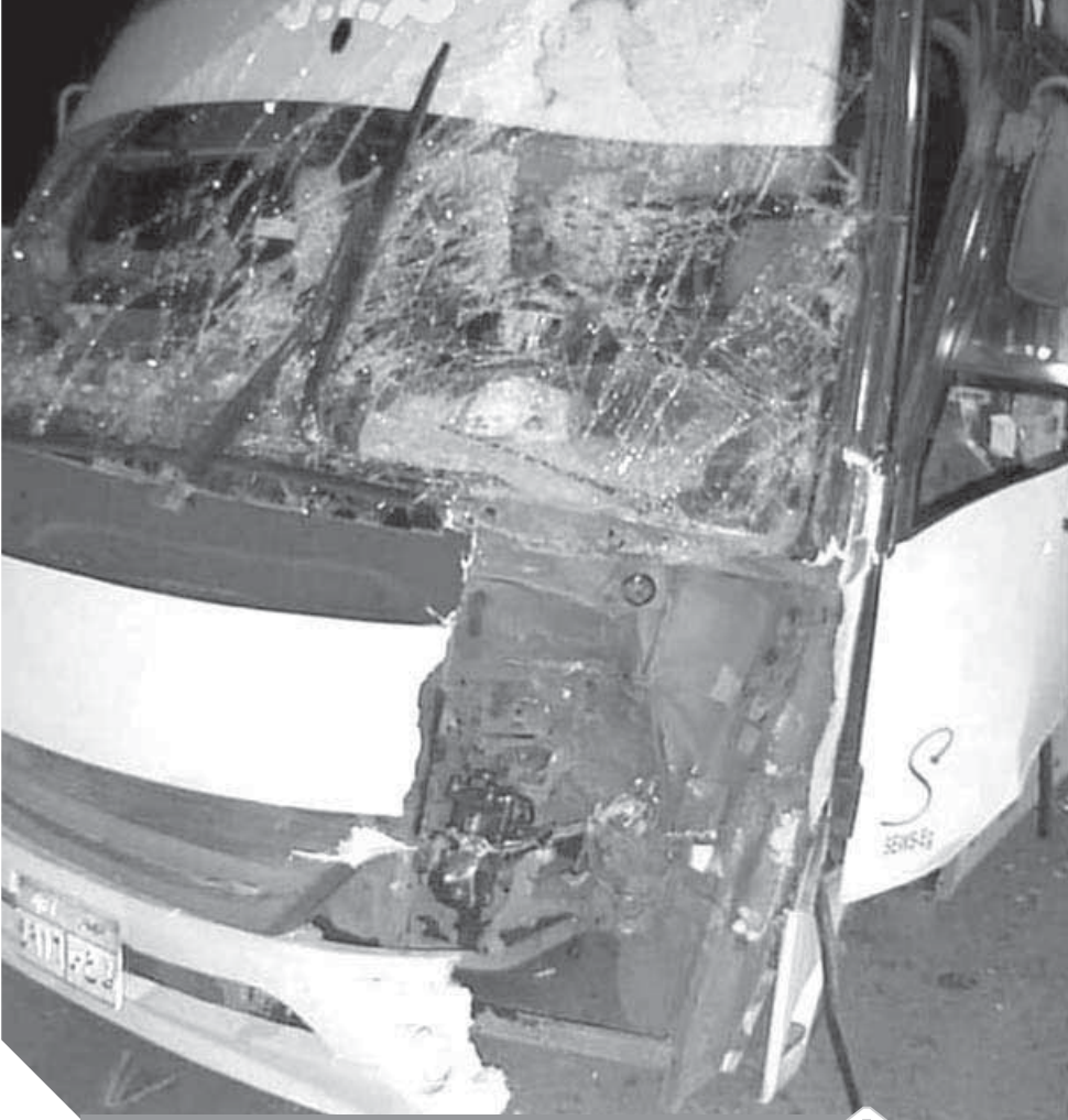
أتوبيس جماهير المصرى بعد الحادث