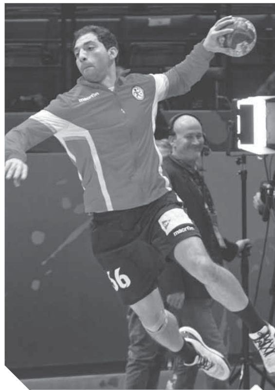
اليد يبحث عن إنجاز فى العام الجديد