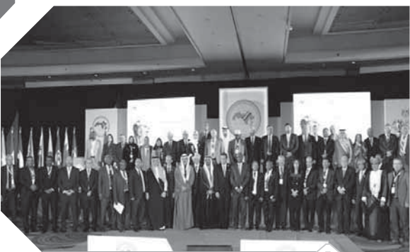
وزراء التعليم العرب

بين الجهات المعنية داخليًا وخارجيًا. وأكد المؤتمر فى توصياته التى أعلنها الدكتور خالد عبدالغفار وزير التعليم وبنى الآليات لتنظيم والحكومة بخصوص المنظومة الوطنية للذكاء الاصطناعى، والعمل على ضمان خصوصياتها وتحديد عناصرها وحوكمتها وحل قضاياها ووضع أولويات لمعملها تناسب الدولة والمجتمع، وتأمين مصادر التمويل العامة والخاصة والأهلية لها. وتأهيل الأساتذة والمعلمين للعمل فى تعليم مُميّكٍ بالذكاء الاصطناعى، وتمكينهم