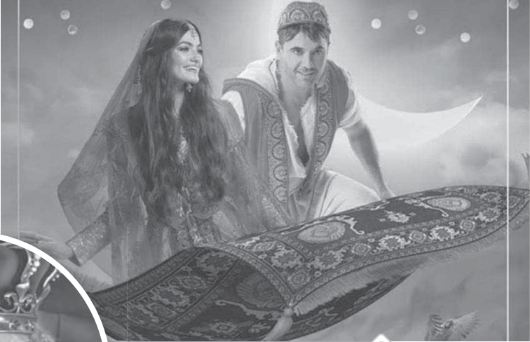
مشهد من مسرحية علاء الدين

افتتحت فرقة المسرح الحديث العرض المسرحى «مهمى ومهمى»، وإعادة عرض «أوكيوسولا».