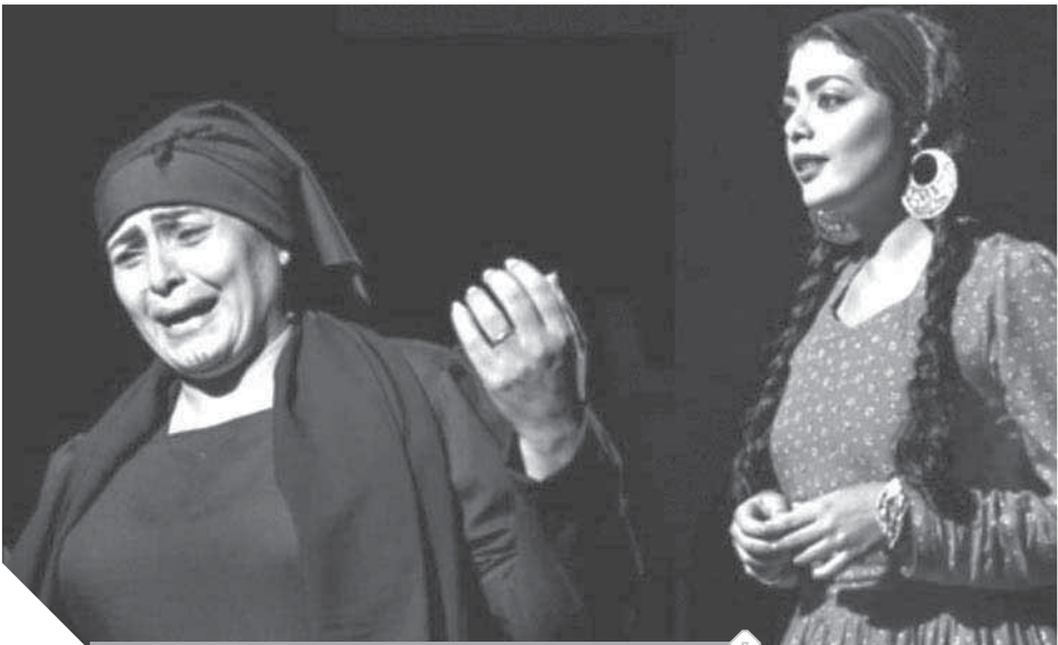
العرض المسرحى، الطوق والأسورة،

شهد المسرح بقطاعيه الحكومى والخاص، خلال العام ٢٠١٩ طفرة إنتاجية، على الصعيد الكمى، والتنوعى، وحضورا لافتا لثيمات تتعلق باضطراد المرأة، والتطرف والإرهاب، ومشكلات الطبقة الوسطى والمعدمة. وشهد المسرح هذا العام تنجارب لجيل جديد من المسرحيين، مخرجين وكتابا وممثلين، احتضنتها مهرجانات مسرحية عربية ودولية، وكانت آخرها الجوائز التى حصدها عرض «الطوق والأسورة» إنتاج فرقة مسرح الطليعة التابعة للبيت