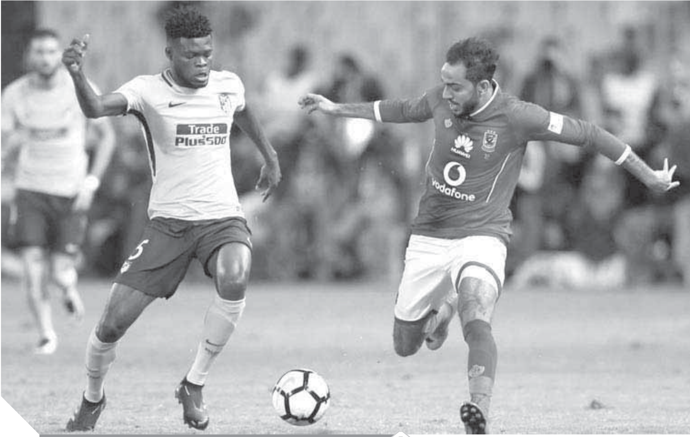
كهرىا هل يشارك مع الأهلى أمام المقاصة

لخوض مباراة المقاصة بعد مشاركته فى مران الفريق