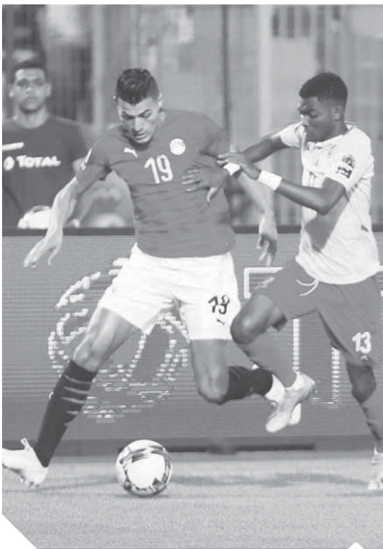
المنتخب الأولمبى يحلم بتحقيق ميدالية فى طوكيو