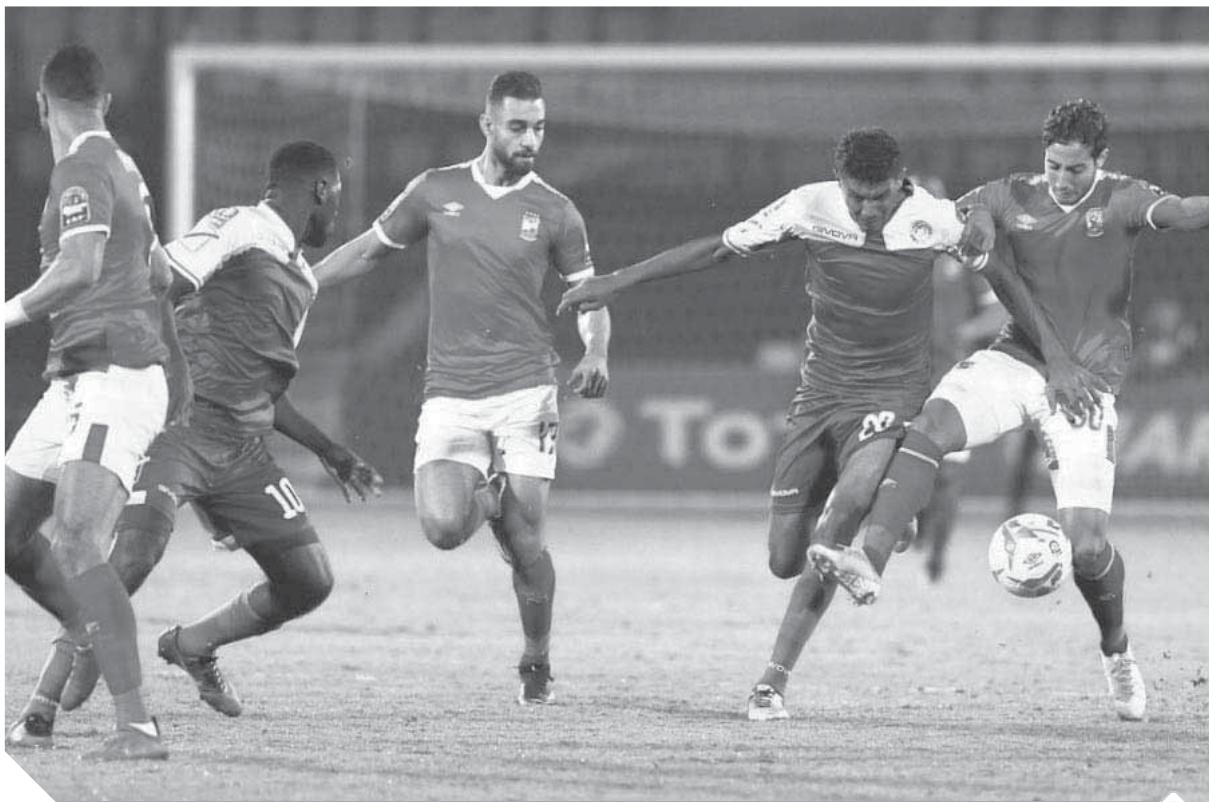
الأهلى يسعى لاستعادة لقب دورى أبطال أفريقيا