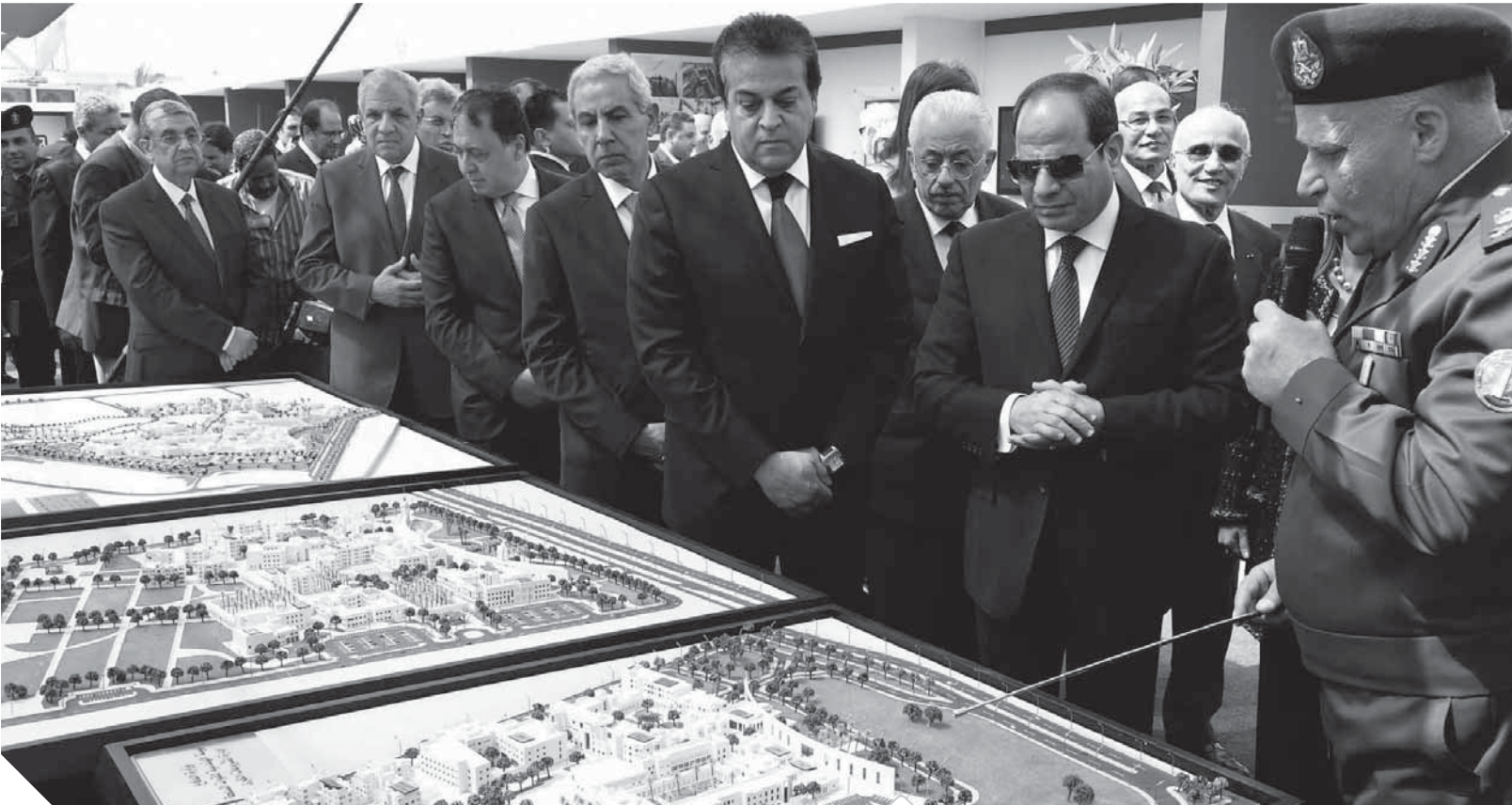
الرئيس وعدد من الوزراء يتفقدون ماكيت جامعات الجلالة صورة أرشيفية

لهذه المستشفيات، تطوير المناهج الدراسية للقطاع الطبى أسوة بالطب البشرى والصيدلى، والانتهاه من تطوير طوارئ مستشفى قصر العبنى، وإفتتاح أعمال تطوير المعهد القومى للأورام، التابع لجامعة القاهرة، تنفيذ خطة متكاملة لتوسيع مظلة التشاؤل الطلابى وتعظيم تأثيرها بين جموع الطلاب، بما يسهم فى بناء تخصصتهم المتكاملة، وبدعم اكتشاف وصقل قدراتهم ومواهبهم فى شتى المجالات، ويتم تنفيذ ضمن هذه الخطة كافة الأنشطة الفنية والرياضية والعلمية، سواء على المستوى المركزى بمعهد إعداد القادة والاتحاد الرياضى للجامعات، أو على مستوى الجامعات عبر الأسابيع الشبابية والفعاليات والأنشطة بكل جامعة على مدار العام، وإعداد خطة شاملة لنشر الأفكار الصحية والتصدى لانتشار الفكر المتطرف، واستمرار مواصلة تطوير منظومة الطلاب الوافدين، والاستمرار فى تطوير منظومة البعثات العلمية، ومتابعة إنشاء مشروع بيت مصر فى فرنسا.