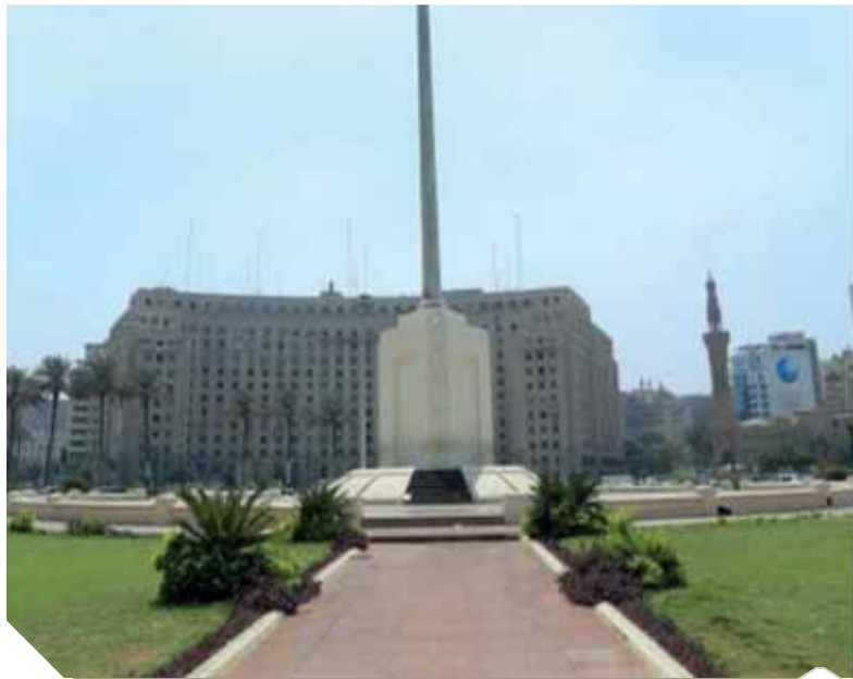
ميدان التحرير قبل التطوير صورة ارشيفية