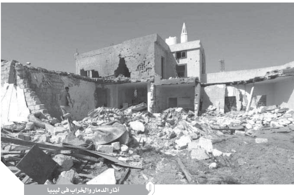
آثار الدمار والخراب فى ليبيا

وشددت القوى الليبية في بيانها على أن فائز السراج وقع منفردا على مذكرتى التفاهم مع تركيا وهو ما يتعارض مع اتفاق الصخيرات، خصوصا فيما يتعلق بألية اتخاذ القرارات السيادية المهمة، التي تستوجب الإجماع ضمن فريق المجلس الرئاسى المؤلف من ٩ أعضاء. وأوضحت أنه على مستوى القانون الدولى فإن مذكرتى التفاهم الموقعتين بين تركيا وليبيا، تنتهكان روح وأعراف القانون الدولى، وعلى وجه الخصوص اتفاقية الأمم المتحدة لقانون البحار وأحكامها التنفيذية، جاماكا ١٩٧٢ ومعاهدة الأمم المتحدة لاستغلال المناطق البحرية