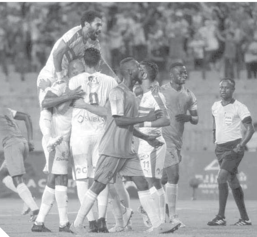
فرحة لاعبي الزمالك أحد أهداف البطولة الأفريقية