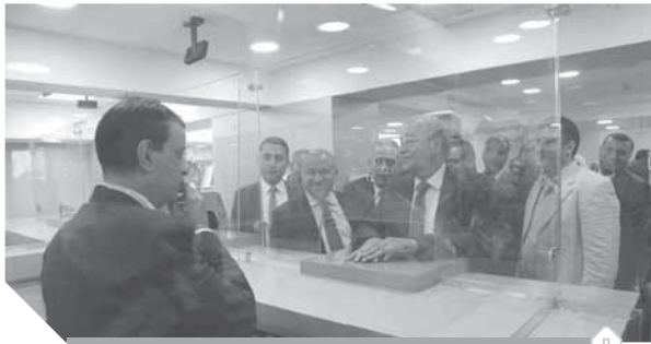
التحكم الإلكتروني فى ربط السجل التجارى