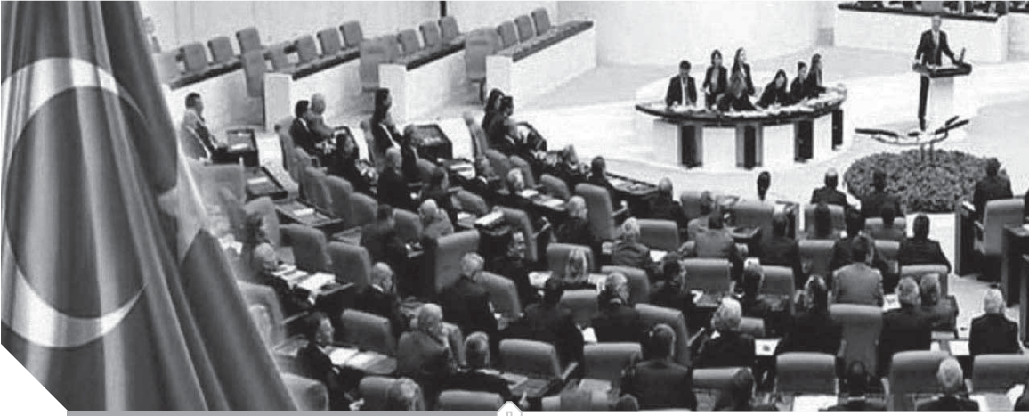
جانب من اجتماع برلمان أردوغان

الليبى الشرعى منذ تشكيلها عام ٢٠١٥. وأوضحت أن الإعلان الدستورى الليبى يؤكد أن المعاهدات الدولية التي تبرمها ليبيا، يجب أن تتم مصادقتها من الجهة التشريعية. وذكرت أن المادة (٨) فقرة (٢) من الاتفاق السياسى الذى ولد من رحم المجلس الرئاسى، أشارت إلى أن التفاهم الموقعتين (عقد الاتفاقيات والمعاهدات الدولية على أن تتم المصادقة عليها من مجلس النواب)، لافتة إلى صدور عدة أحكام قضائية ليبية تؤكد عدم دستورية حكومة السراج.