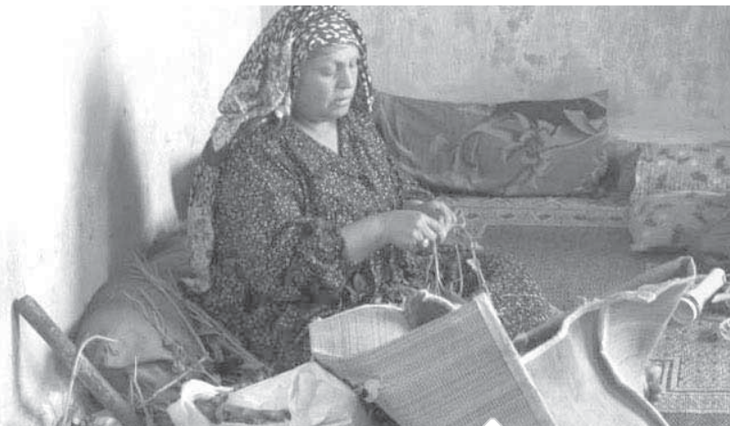
المرأة العاملة عنصر هام في إقامة الدولة الحديثة