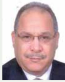
بقلم: حسين حلمي