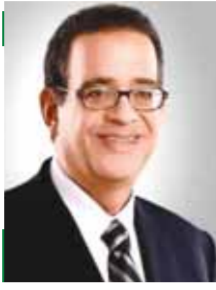
بقلم: طارق عبد العزيز

يا جماله يا جماله جماهير الكرة في مصر، هي التي تهافت للاعب بضرورة الاعتزال عندما يتدهور مستوا، وفي هذا يُحكى عن اللاعب فلان بن فلان.. أن جماهير ناديه هفت باعتزاله، فالجماهير يا سادة هي «الترموتر» القادر على قياس صلاحية اللاعب، هؤلاء ليسوا أعضاء في الجمعيات العمومية للأندية ولكنهم أكثر إخلاصاً للنادي، يمدح اللاعب المثاني ويطلب اعتزال المتعاقس، إنها الديمقراطية المباشرة في معناها المجرد من غير صندوق أو قائمة أو مصالح، ولكن عودة إلى فلان هذا وأبيه فلان الذي يحاول إلهاء الناس في أمور تافهة ليعيد عن ابنه أي انتقاد أو هتاف يعلم اثره، ويذكرنا بحكاية هزلية جاءت في فيلم أمريكي عن الانتخابات الأمريكية، اسم الفيلم «هز الكلب» يطرح سؤالاً