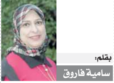
بقلم: سامية فاروق