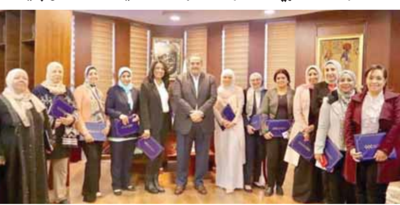
اللواء أحمد منصور خلال تكريم الأهماء المثاليات بالمصرية للمطارات

فى إطار خطة وزارة الطيران المدنى لتعزيز الولاء المؤسسى وتفعيل الدور الاجتماعى للوزارة، احتفلت الشركة المصرية للمطارات ومطاراتها التابعة بعيد الأهماء، وفى هذا الصدد قام الطيار أحمد منصور، رئيس مجلس إدارة الشركة، بتكريم عدد من الأهماء المثاليات من الوظائف من كل قطاعات الشركة، وأكد على دور الأهماء ومكانتها والعطاء الكبير الذى تبذله فى رعاية أبنائها وتربيتهم على القيم الأخلاقية وإنكار الذات وحب الوطن، وأن الكرمات نماذج لجميع الأهماء اللواتي يستحقن التكريم، كما حرص على التثاقف الصور التذكارية مع الموظفات الكرمات موجهاً الشكر لهن على ما يبذلونه من جهد فى أداء مهامهم الوظيفية.. من جانبها أعربت