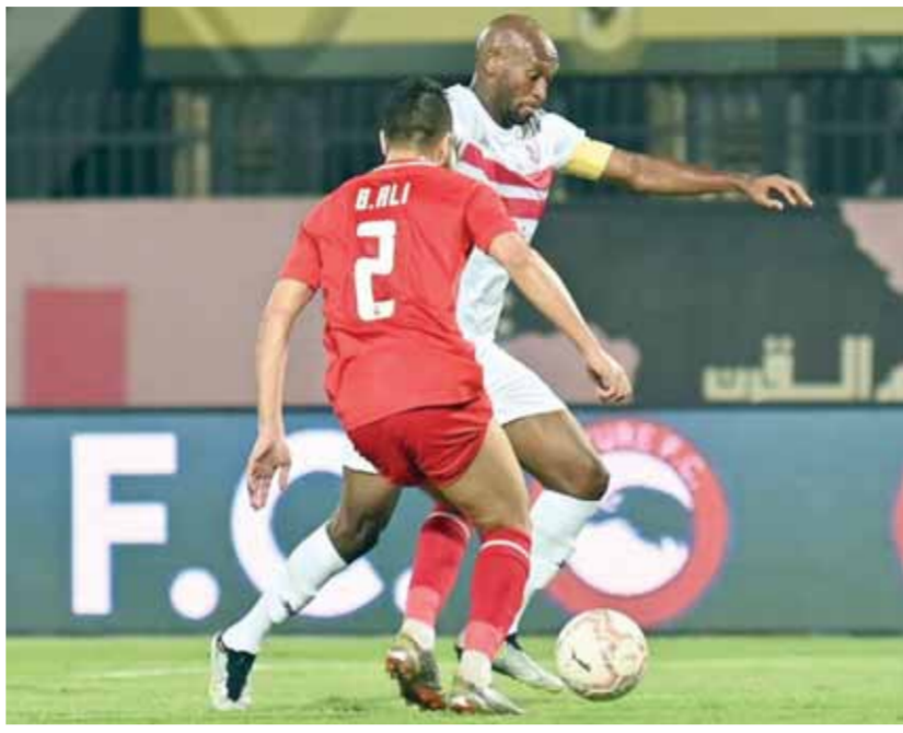
الزمالك وفوتشر.. مواجهة صعبة للفريقين

يدخل الفريق الأبيض اللقاء بهدف تحقيق الفوز لتسهيل مهمته في لقاء الأياب يوم ٧ أبريل باستاد القاهرة، متسلحاً بالجمهير التي اشترت جميع تذاكر المباراة المتاحة لمساندة الفريق. واستغل الجهاز الفني للزمالك بقيادة البرتغالي جوزيه جوميز فترة توقف الدوري في تجهيز اللاعبين بالصورة الجيدة سواء من الناحية البدنية أو الفنية وحرس جوميز على عقد أكثر من جلسة مع لاعبيه طالبهم فيها بضرورة التركيز حتى آخر ثانية في اللقاء وتفادي الأخطاء التي حدثت في المباريات السابقة خصوصاً لقاء الأهلي في نهائي كأس مصر، والذي خسره الفريق بهدفين ثم الهزيمة من الجونة بثلاثة أهداف لهدفين.