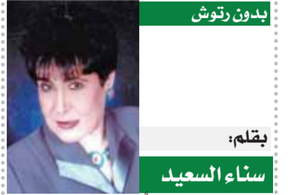
بقلم: سناء السيد

وسلم، وكذلك السير على ما يقوم به الرئيس عبدالفتاح السيسي الذي يضع فوق أولوياته أمراً هاماً وهو «جبر الخواطر». وهزرت البناء على ما قدمت في حياتي راجياً من المولى عز وجل أن يوفقنا لما يحب ويرضى، وأن تكون لنا خطوة في طريق الخير، وليس أجمل الخطوات وأكرمها هي السير في تكريم أبنائنا من «القادرون باختلاف»، وبالفعل تم تجمع عدد كبير من القادرون باختلاف من أبناء الدقهلية وكرمنا، عصافير وزهرو يملأون حياتنا صدقا وإخلاصا ومعاني جميلة تجسدت في هؤلاء الأبطال. لست مبالغاً إذ قلت إنهم كرموني في شخصي بحضورهم، وقبولهم تكريمي الذي أسعدني وأدخل على قلبي فرحة لا يعلمها إلا الله، ليست منة أو فضلا بل هم من تفضلوا عليّ، وأنا أرى اإتسامتهم التي نورت بيتي وحياتي، وكيف لا تكرمهم وهم من اختارهم الله لتحمل المشقة وتقبلوا على ظروفهم وتوقفوا وابتأوا قذوة للصالحين وعبرة تدفعنا للاجتهاد والعمل من أجل الوطن.