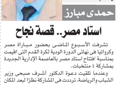
بقلم: حمدى مبارز

ولا بد أن يكون للدولة دور كبير فى تحفيز الأطفال على ممارسة الرياضة، وتكون في متناول جميع الفئات وبأسعار رمزية غير مبالغ فيها حتى يتمكن الجميع من ممارستها. وكذلك إقامة مراكز شباب بجميع المحافظات والقرى والاهتمام بها من خلال المسابقات الدورية بين المراكز وتصعيد الشباب المتميز والمتفوق في الألعاب الرياضية المختلفة. وحتى تكثفت الدولة أعباء مالية للهنوض بأطفال اليوم وشباب الغد، فهو نوع من أنواع بناء الدولة ومن الضروريات التي لا بد وأن توضع في الاعتبار، فنحن نستثمر في أبنائنا وهذا من أولويات الاستثمار لبناء المجتمع بأجيال تكون بمثابة أعمدة صلبة للبلاد.