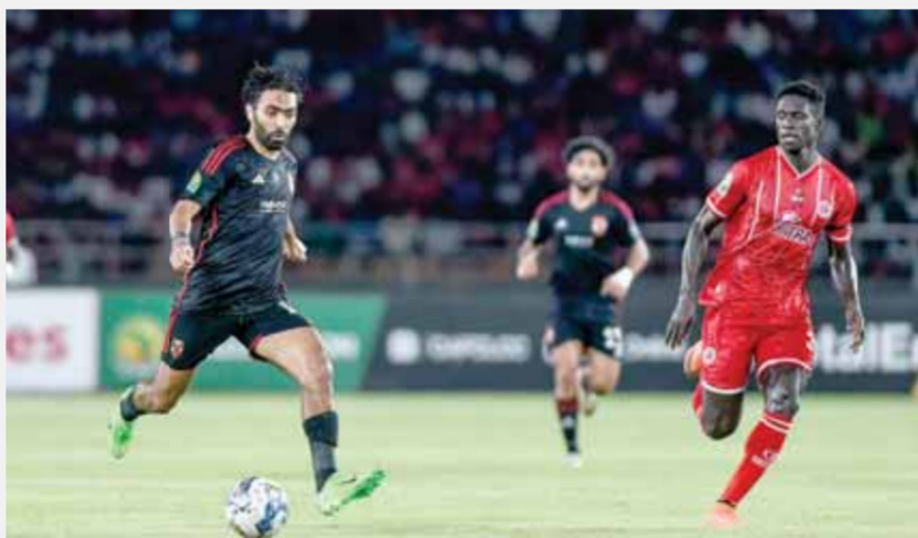
الأهلى حقق فوزاً صعباً أمام سيمبا

عاشور لاعب الوسط الذى تعرض لخلع في الكتف خلال مباراة المنتخب الوطنى ضد نيوزيلندا في كأس عاصمة مصر الودية الدولية.