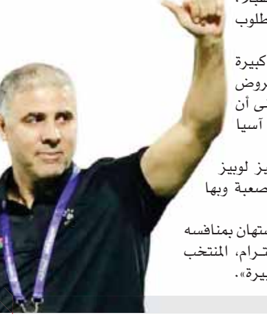
قطر تكتب نهاية المغامرة الفلسطينية.. و«دبوب» يتعهد بالتحسن

ونعدهم ببذل مزيد من الجهد مستقبلاً. اللاعبين لم يقصروا وقدموا كل المطلوب منهم». وختتم المدرب التونسي: «طموحنا كبيرة بشأن المستقبل، ووصلت للاعبينا عدة عروض احترافية. الكل جاهز بعزيمة وروح ونتمنى أن نتأهل للدور الثاني في تصفيات كأس آسيا ٢٠٢٧». على جانب آخر، أكد الإسباني ماركيز لوبيز مدرب منتخب قطر، أن المباراة كانت صعبة وبها جوانب عاطفية أمام منتخب فلسطين. ورفض مدرب قطر القول بأن فريقه استهان بمنافسه وأوضح: «بالعكس، نكن لهم كل احترام، المنتخب الفلسطيني لعب بشكل جيد وبشجاعة كبيرة».