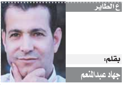
بقلم: جهاد عبد المنعم