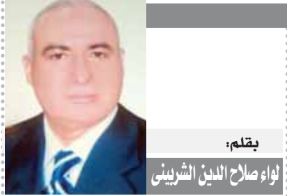
بقلم: لواء صلاح الدين الشربيني