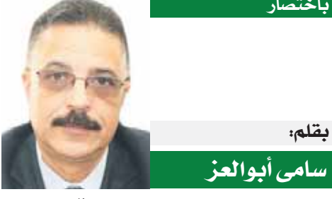
بقلم: سامي أبو العز