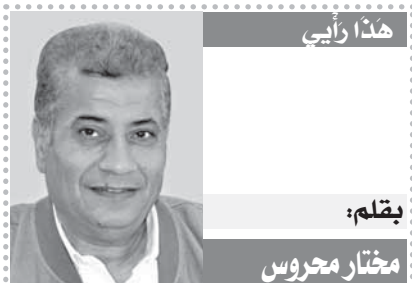
بقلم: مختار محروس