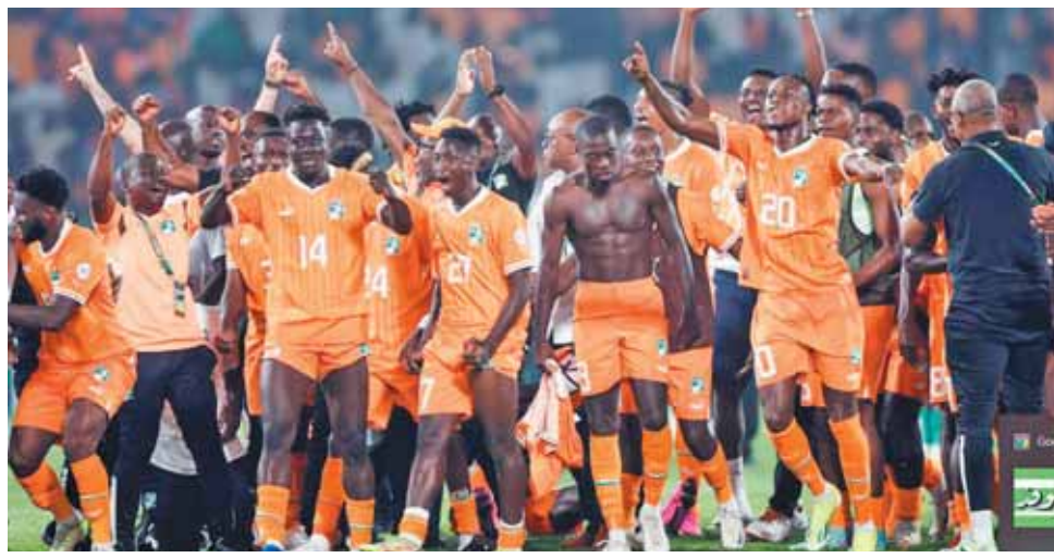
فرحة لاعبي منتخب كوت ديفوار بعد عبور السنغال

الأولمبي، وقال فاي عقب اللقاء إنه فخور بما حققه اللاعبين ودعم الجماهير الذي ظهر في المدرجات، موضحاً أن منتخب الأفيال قادم وبقوة البطولة ويسعى للمنافسة على اللقب. وهذا الأسطورة ديديه دروجبا نجم تشيلسي الإنجليزي الأسبق لاعب منتخب بلاده، مؤكداً أنه حولوا البلاد لمسرح احتفالات بهذا الفوز وصالحوا الجماهير. وطالب دروجبا اللاعبين بالمزيد من التكاتف والوحدة للمنافسة بكل قوة على لقب البطولة وحصد للمرة الثالثة في تاريخ البلاد. في المقابل، رفض أليو سيسيه المدير الفني لمنتخب السنغال الرحيل عن منصبه مؤكداً أنه كان يتمنى الوصول لما هو أبعد من ذلك ولكن المنتخب السنغالي هو من وضع نفسه في هذا الموقف. وأضاف سيسيه: «سنغلق صفحة البطولة ونستعد للإعداد للنسخة القادمة في المغرب بجانب التأهل لمونديال ٢٠٢٦».