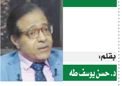
بقلم: د. حسن يوسف طه

رسالة تضامنية بطريقة مؤثرة، مفادها أن جميع الأتنياء والديانات السماوية جاءوا بالمحبة والسلام، وحرّموا قتل الأطفال والأبرياء. ويقدم جناح الأزهر الشريف بمعرض القاهرة الدولي للكتاب لزواره كتاب «الأزهر والقضية الفلسطينية»، في ٤ مجلدات، تضم العديد من الأبحاث التي نشرت في مؤتمرات عقدت في الأزهر