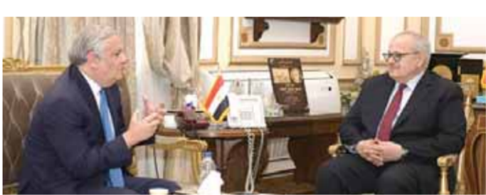
د الخشت أثناء اللقاء مع سفير بيرو

فتح آفاق التعاون الدولى الأكاديمى والبحثى فى مختلف المجالات مع جامعات عالمية مرموقة تحتل مراكز متقدمة فى التصنيفات الدولىة، وإنشاء العديد من الدرجات العلمية المشتركة معها، بما يدعم العملية التعليمية والبحثية. وأشاد سفير دولة بيرو، بمكانة جامعة القاهرة المرموقة عالمياً وقيمتها العلمية الكبرى، وإسهاماتها المتميزة فى مجال البحث العلمى على المستوى الدولى، ومستويات الدراسة المتقدمة بها والتى تلبى حاجة سوق العمل سواء المحلية أو الدولىة، بما يجعلها جامعة متفردة بين الجامعات المصرية والأجنبية. وأعرب السفير عن رغبته فى عقد ندوات ولقاءات ثقافية بجامعة القاهرة حول التعريف بدولة بيرو وهويتها وثقافتها خاصة وبأمريكا اللاتينية عامة، بما يساهم فى تعزيز التفاهم والتعاون المتبادل والدبلوماسية الثقافية بين الجانبين.