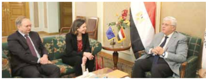
د. أيمن عاشور أثناء افتتاح الفعاليات

متقدم، منوهاً أن مصر أصبحت على أعتاب حقبة جديدة لإعادة البناء، من خلال الاعتماد على سياسات واستراتيجيات مستحدثة تؤدي إلى نمو اقتصادي مستدام، بناءً على المعرفة الناتجة عن البحث العلمي. وأشار الوزير إلى أن دعم التعليم والبحث والابتكار من دول البحر المتوسط من خلال استحداث اقتصادات مستدامة ترتبط بالإبداع العلمي والتكنولوجى يفرض التوظيف، مشيرة إلى أن التعاون مع إفريقيا والبحر المتوسط شهد زخماً إيجابياً حقيقياً بعد سنوات من العمل الدؤوب، وخاصة مع الاتحاد الإفريقي والاتحاد من أجل المتوسط، وخاصة في مجالات العلوم والتكنولوجيا والابتكار، مشيداً بالتعاون المثمر بين مصر والاتحاد الأوروبي في العديد من المبادرات والبرامج والمشروعات، مشيداً إلى أهمية تعزيز دور التعاون مع الاتحاد لدعم تحقيق رؤية وخطة عمل الوزارة.