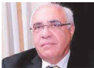
دكتور عياد سرحان

وذلك تتويجا لجهود الجامعة وتحقيقاً لسياستها العامة لدعم وتطوير منظومة التعليم الجامعى، والسمى لمواكبة خطة الدولة ورؤيتها العامة لتطوير التعليم ضمن خطة التنمية المستدامة ٢٠٣٠، كما حصل الدكتور المعتز يوسف، الممثل الوحيد لجامعة المستقبل على تصنيف أفضل ٢٪ من بين العلماء المتميزين على مستوى العالم، وذلك حسب التصنيف الدولى الذى تقوم به جامعة ستانفورد الأمريكية.