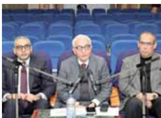
د. رضا حجازي أثناء اجتماع

افتتح الدكتور أيمن عاشور صباح أمس، فعاليات إطلاق مبادرة البحر المتوسط «برنامج عمل Horizon Europe»، بحضور السفير كريستيان برجر سفير الاتحاد الأوروبي في مصر، والسفير ناصر كامل سكرتير عام الاتحاد من أجل المتوسط، وماريا كريستينا روسو مدير إدارة النهج العالمي والتعاون الدولي في البحث العلمي والابتكار بالمفوضية الأوروبية، وعدد من رؤساء الجامعات ورؤساء المراكز البحثية، وليف من الأساتذة والباحثين. وأكد الوزير تقدير الحكومة للدعم المستمر من الشركاء الأوروبيين والاتحاد الأوروبي؛ لدعم جهود التنمية في مصر، مشيراً إلى أن هذا اليوم يعد فرصة لتأكيد على الأولوية المشتركة لدعم البحث العلمي باعتباره الركيزة الأساسية لتطوير الاقتصاد القائم على المعرفة، منوهاً إلى أهمية البرنامج في منح البحث العلمي فرصته الكاملة لرسم المستقبل، وتعزيز التعاون البحثي بين الباحثين المصريين والأوروبيين. وقال الوزير: «الاتحاد الأوروبي يعد شريكنا التجارى والاستثمارى والسياحى والاستراتيجى في البحث والابتكار وتطوير العلم يعد أحد أهم جوانب الحضارة والقوة التنافسية للأمم التي تقاس أساساً بالعقول والابتكار، ويأتى ذلك في ضوء زيادة المنافسة بين الباحثين على مستوى العالم في مجال العلوم». وأكد «عاشور» أن التعليم والبحث هما المحركان الأساسيان للابتكار، مشيراً إلى أن الابتكار هو المحرك الرئيسى للنمو الاقتصادي في أي اقتصاد