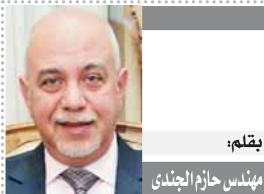
بقلم: مهندس حازم الجندى