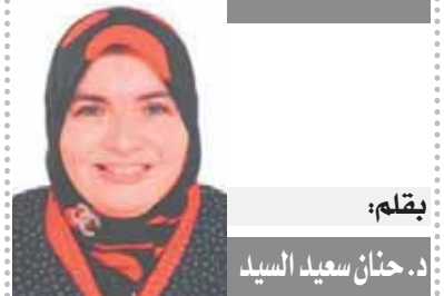
بقلم: هشام الهلوتى