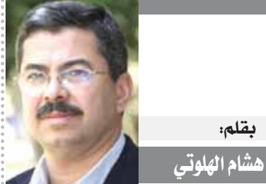
بقلم: هشام الهلوتى

٥ ملايين جنيه تتخذ مركز رعاية طفل العباسية