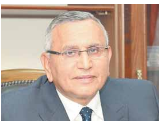
د. عبدالسند يمامة

الدولة من الطاقة بمختلف أشكالها بعد أن أصبحت مصر إحدى أكبر الدول تصديراً للغاز الطبيعي في العالم، بالإضافة إلى تحولها لمركز إقليمي لتصدير الطاقة الكهربائية بعد التوسع في توليدها من المصادر المتجددة مثل الشمس والرياح، الأمر الذي أسهم في وجود فائض يسمح بالتصدير، مشيراً إلى أن مصر من أكثر اقتصاديات الشرق الأوسط وإفريقيا تنوعاً، الأمر الذي يلبي احتياجات المستثمرين. وأوضح «يمامة» أن الدولة تعمل على تعظيم دور القطاع الخاص في التنمية، حيث نسبة مشاركته ٧٥٪، مشدداً على أهمية القطاع الصناعي في دفع التنمية، لافتاً إلى أن الحكومة اتخذت أيضاً عدد من الإجراءات لتيسير عمل المستثمرين من خلال إصدار الرخصة الذهبية وتوحيد جهة الولاية وإصدار التراخيص خلال ٢٠ يوماً فقط، بالإضافة إلى التيسيرات الخاصة بتخصيص الأراضي. ودعا «يمامة» جميع رجال الأعمال والجهات المعنية بالمشاركة في المؤتمر الاقتصادي الذي أعلنت الحكومة انعقاده نهاية شهر أكتوبر لتقديم رؤيتهم تجاه تحسين مناخ الاستثمار في مصر وعرض مشاكلهم، مؤكداً أن المؤتمر سيكون فرصة قوية للترويج للفرص الاستثمارية المتاحة في مصر.