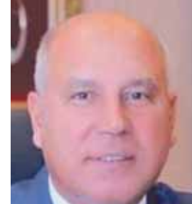
وزير النقل يبحث مع «طوكيو»

اليابانية صيانة وتشغيل الخط الرابع للمетро