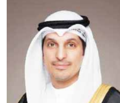
رسالة الكويت خالد إدريسي

خرج أمس آلاف الناخبين في الكويت للإدلاء بأصواتهم لانتخاب برلمان جديد، وسط تفاؤل بمراحل جديدة بعد نحو عامين من الصراع بين البرلمان السابق والحكومات المتتالية التي تعاملت معه. وتأتي هذه الانتخابات بعد صدور قرار بجل المجلس في الثاني من أغسطس الماضي نتيجة عدم التعاون بين السلطتين التشريعية والتنفيذية في البلاد. وانطلقت عملية التصويت في الثامنة صباحاً، واستمرت حتى الثامنة مساءً، ولم تبدأ عملية الفرز حتى متوال «الوفد» للطبع. قامت «الوفد» بجولة على عدد من اللجان الانتخابية، وشهدت مشار اللفان إقبالاً محدوداً في الصباح، وازدادت بكثافة بعد صلاة الظهر، وحرص كبار السن من الرجال والسيدات على الحضور للإدلاء بأصواتهم.