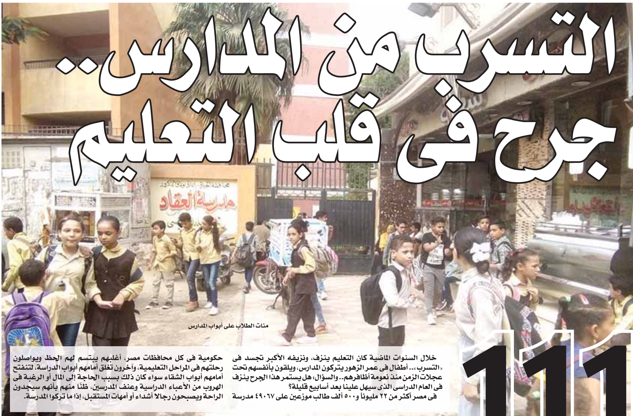
مئات الطلاب على أبواب المدارس

خلال السنوات الماضية كان التعليم ينزف، ونزيفه الأكبر تجسد في «التسرب... أطفال في عمر الزهور يتركون المدارس، ويلقون بأنفسهم تحت عجلات الزمن منذ نعومة أظفارهم... والسؤال: هل يستمر هذا الجرح ينزف في العام الدراسي الذي سيهل علينا بعد أسابيع قليلة؟ في مصر أكثر من ٢٢ مليوناً و ٥٠٠ ألف طالب موزعين على ٤٩٠٦٧ مدرسة