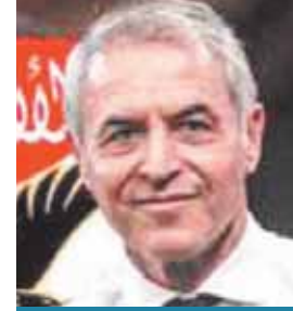
الأهلى يقترب من حسم صفة «مارسيينيو»