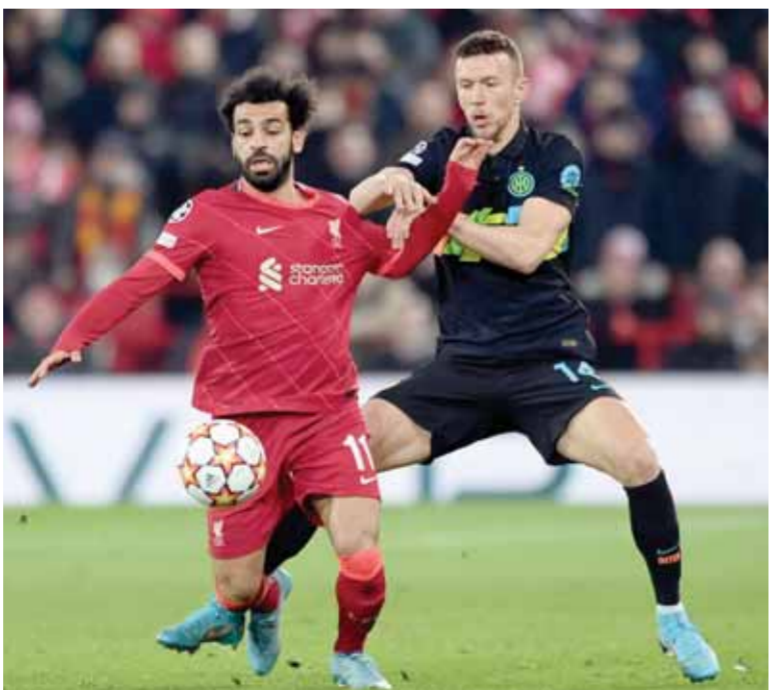
محمد صلاح يقود ليفربول اليوم أمام السيتي

عموما الرئيس السيسى دعا أكثر من مرة الإعلام المصرى لإدراكه الأحداث محليا وإقليميا وعالميا ولن يتخطى ذلك إلا بوجود قناة أو قنوات إخبارية تتوازر لها كل الإمكانات المالية والتقنية والبشري المؤهل بالإضافة إلى حرة تداول المعلومات وسرة التغذية اللفية للأحداث! وأنتج التقرير! منظمة الإعلام فى إطار القوي الجديدة لا إبد التلك من توافق مدمع التجار والتيزور والى أن ما أعلن عنه خطوطية ورابعة رغم ما نأجحت متأخرة نتاج إلى دراسة وتان وحسن اختيار الكوادر التى سكلت بتفدى الشروع.