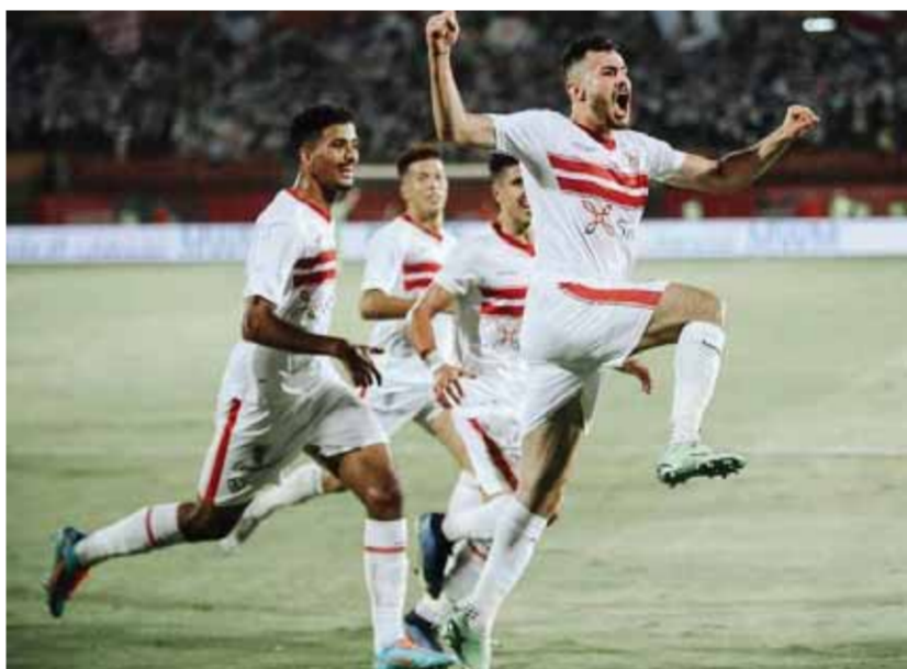
فرحة لاعبي الزمالك بهدف الفوز على فيوتشر

وحقق فريق الزمالك فوزا غالبا على فيوتشر بهدف دون رد فى المباراة التى أقيمت بينهما بإستاد السلام، ليرفع الأبيض رصيده إلى ٦٣ نقطة منفردا بالمصافة. من ناحيته أكد فيريرا أن تحقيق النقاط الثلاث نتيجة عادلة وفوز مستحق بعد تقديم مباراة كبيرة أمام فيوتشر وقال الخواجة خلال المؤتمر الصحفى للمباراة: « نتيجة عادلة والفوز مستحق قدما مباراة كبيرة، وفيوتشر لم يظهر إلا بعد الهدف الأول لنا، استعدادنا جيدا للمباراة، والقادم أصعب بالنسبة لنا، كل ٣ أيام مباراة، من الممكن أن