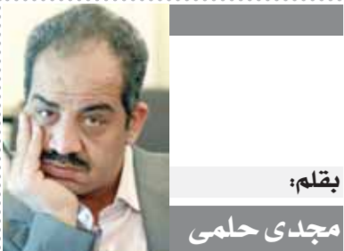
بقلم: مجدى حلمي

من ناحية أخرى وافق مجلس النواب في مارس الماضي على مشروع رعاية المسن، الذي تضمن إقرار حق المسن الذي لا يقدر على تحمل نفقاته أو أهله، في الحصول على معاش له أو المكلف برعايته، وضم