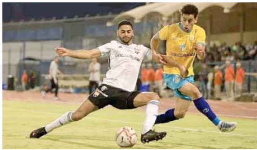
الإسماعيلى تخطى الجونة فى لقاء صعب