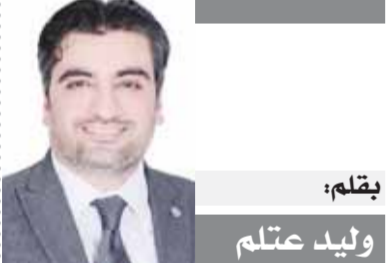
بقلم: وليد عتلم

هي دعوة للمحافظ بأن يغير من جولته وأن يتم بالشوارع الجانبية في محافظته ولا يعتمد على مساعديه أو رؤساء الأحياء الذين لا يعرفون إلا كلمة واحدة وهي كلمة تمام باقتدم والحقبة ان الامور في أسوأ حالاتها.