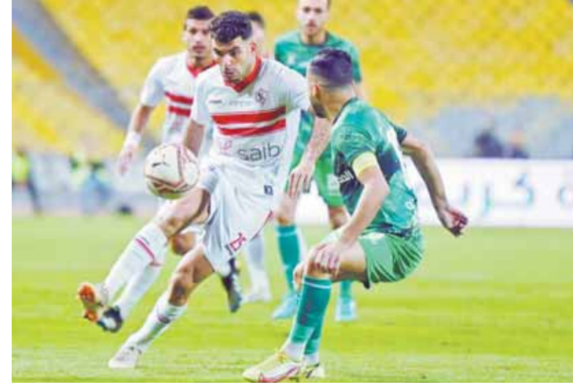
الزمالك واصل تصدره لقمة الدورئ بالفوز على المصرئ

فريقه يضم ٢٤ لاعبا ولابد أن يكونوا جاهزين، ويجب أن يكون الجميع جاهزاً لأننا نواجه منافسين أقوى». واختتم المدير الفني حديثه قائلاً: «توجهنا لتحية الجماهير ونشكرهم على مساندتنا ونتمنى أن يكونوا معنا فى الفترة المقبلة».