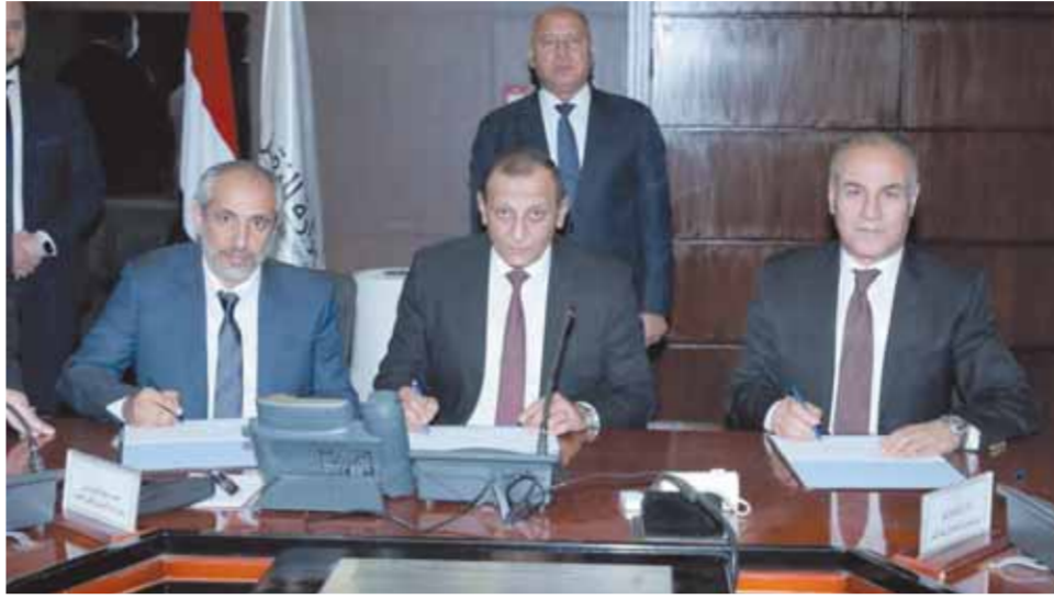
توقيع مذكرة الشروط والأحكام لمنح حق الالتزام لإدارة وتشغيل وإنشاء البنية التحتية للمحطة متعددة الأغراض بميناء سفاجا البحري، بين الهيئة العامة لموانئ البحر الأحمر وتحالف مجموعة موانئ أبو ظبي التابعة لشركة أبوظبي القابضة وشركة المجموعة المصرية للمحطات متعددة الأغراض.

ويعتبر مشروع المحطة متعددة الأغراض بميناء سفاجا أحد المشاريع القومية الهامة نظراً للموقع الاستراتيجي على البحر الأحمر على مساحة ٨١ هكتاراً وطرقة أرضية ١٠٠٠ متر وعمق ١٧ متراً لتداول الحاويات وجميع أنواع البضائع العامة والصب الجاف والسائل، ومن المخطط بدء التشغيل به مطلع عام ٢٠٢٤، ويعتبر هو النافذة الجديدة