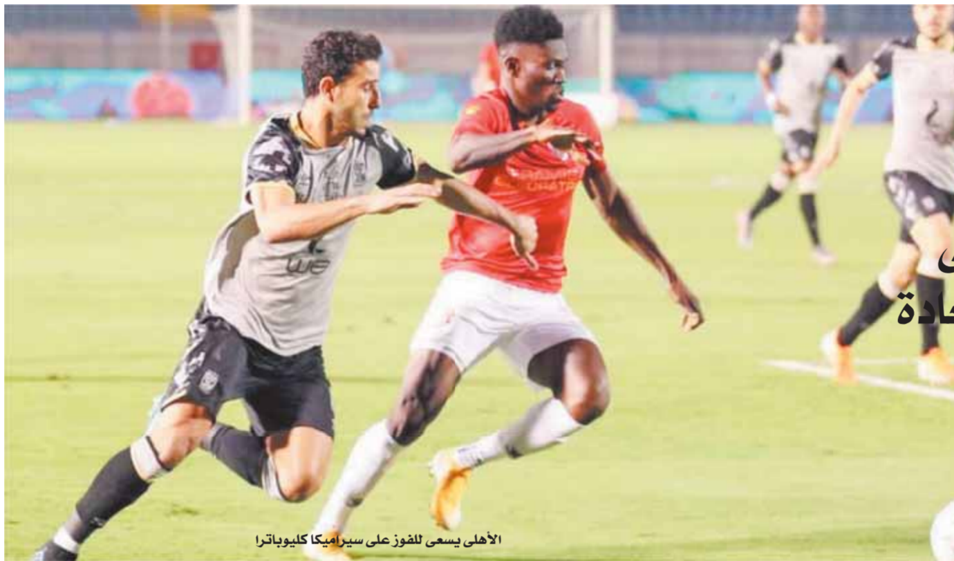
الأهلئ يسعئ للفتور على سيراميكيا كليوباترا