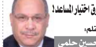
يقلم: حسين حلمى

إننى أرى أن من أصعب الأمور التي تقع على عية أى شخص يدبر أى شيء هو طريقة اختياره بالمساعدين الذين يتعاونون معه... فالأمر ليس بالسهل... فإذا كان رجل ذا فطنة وحسن تبصر بالأمور... نجد أنه اختار أصحاب الكفاءات والخصائص للمعين الذي يشرف عليه... ولكن إذا اختار المساعدين الذين يشرف عليهم... لم يخطئ طريقه... فهذا الاختيار منه هو الاختيار السواء... لا يختار المساعدين... تتوقف على متطلبات المدير الذي يعلم قدر نفسه وقدرته على الإدارة... هناك مسير يسرك كافة الأمور دون مساعدة أو عون فيختار المخلص له بغض النظر عن كفايته فهو وحده في هذه الحالة المسئول ويحمل كافة النتائج... لأنه في هذه الحالة «محدور» ولكن شخصاً آخر يدرك ويطلب المعونة والمساعدة... ولذلك يختار مساعدين له ذوي علم وخبرة... لذلك ينجح في عمله بسبب حسن تفكيره وإخلاصه للصلح العام... ولكن هناك من لا يدرك المشاكل ولا العمل يستمر في اختيار المناقنين بغض النظر عن الخبرة بذلك يكون اختياره هذا هو الأسوأ... لم تفصداً أحداً!