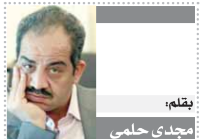
بقلم: ياقوب حملي

صحيحة عمانية: السلطنة تلعب دورًا محوريًا في الأزمة اليمنية قالت صحيفة الوطن العمانية إن السلطنة تلعب دورًا محوريًا في الأزمة اليمنية، مشيرة إلى أن الدبلوماسية العمانية رسخت إمكاناتها وعلاقتها الخارجية القوية كافة في تحقيق السلام على المستوى الإقليمي والعالمي، والالتزام بالحقوق الإنسانية والقضايا العادلة للشعوب، مستفيدة في سبيل تحقيق ذلك، مما تملكه من علاقات وطيدة ممتدة على مدى التاريخ. وأضافت الصحيفة في افتتاحيتها تحت عنوان «دبلوماسية اليمن: تنصير للإنسانية»؛ تلعب السلطنة دورًا محوريًا في الأزمة اليمنية، حرصت فيه على الالتزام بالحياد الإيجابي، والعمل مع جميع الأطراف على تحقيق ما يصب في مصلحة اليمن وشعبها، وفتح أبوابها أمام الحالات الإنسانية، خصوصًا علاج مصابي الأزمة، دون النظر إلى الانتماءات، وعملت على تلبية التماس حكومات المملكة المتحدة واندونيسييا والهند والفلبين للمساعدة في الإفراج