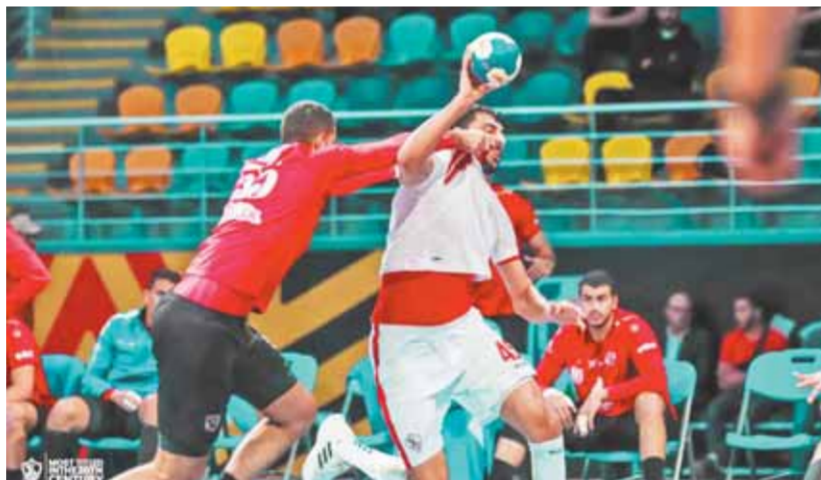
كوماندوز يد الزمالك يواصل حصد البطولات

قرر المستشار مرتضى منصور رئيس نادئ الزمالك صرف مكافآت خاصة للاعبين فريق كرة اليد بعد الفوز على الأهلئ فى الجولة الثالثة لبطولة سوبر دورئ اليد والحصول على كأس البطولة وتحقيق العلامة الكاملة فى الثلاث مباريات التى لعبوها أمام سبورتنج وهليوبوليس ثم الأهلئ. كما قدم رئيس الزمالك التهنة لجماهير القلعة البيضاء التى تتفخ خلفت الفريق فى كافة البطولات