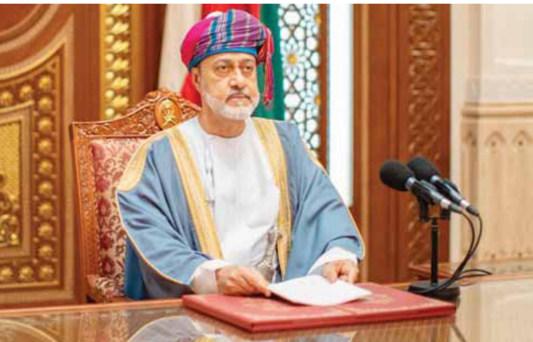
السلطان هيثم بن طارق سلطان عُمان

العربي والإقليمي، وبخاصة في تطورات الأزمة اليمنية. وجاء إبراز أنباء نجاح جهود الوساطة العمانية في الإفراج عنهم وشكر وزارة الخارجية البريطانية للسلطنة لعكس أهمية الجهود العمانية لدى الأوساط الدولية. وقالت صحيفة جلف نيوز: إن عمان سهلت إطلاق سراح ١٤ أجنبيًا كانوا محتجزين في اليمن، وفق إعلان وزارة الخارجية العمانية. وأضافت: السلطنة نسقت مع السلطات المختصة في اليمن للإفراج عن ١٤ مواطنًا بريطانيًا واندونيسيًا ومن الهند والفلبين في اليمن، بالتنسيق مع السلطات السعودية. وأشارت وكالة أنباء الأناضول التركية إلى أن سلطنة عمان سهلت إعادة المفرج عنهم إلى بلدانهم الأصلية، لافتة إلى أن وزارة الخارجية العمانية قالت: بعد التوصل مع السعودية لتسهيل إصدار التصاريح اللازمة، تم نقل جميع الـ ١٤ على متن طائرة تابعة للقوات الجوية السلطانية العمانية إلى العاصمة مسقط، تمهيدًا لعودتهم إلى بلدانهم.