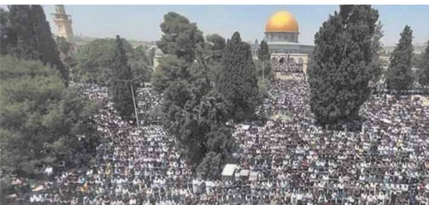
برشق قوات الشرطة الموجودة في المنطقة الغربية من المسجد بالحجارة. وتشهد مدينة القدس المحتلة وساحات المسجد الأقصى منذ أيام، توتراً، في ظل اقتحامات يومية

وكان المشران في قوات الشرطة الإسرائيلية اقتحموا المسجد الأقصى، وسط إطلاق للرصاص المطاطي وقنابل الصوت، وقام عشرات الشبان الفلسطينيين