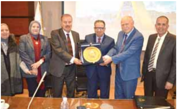
توقيع اتفاقية التعاون