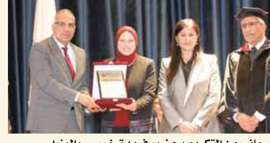
جانب من التكريم بحضور فريدة خميس والوزراء

جاء ذلك بحضور الأستاذ الدكتور أشرف صبحى وزير الشباب والرياضة، والأستاذ الدكتور هانى سويلم وزير الموارد المائية والرئ، والبروفيسور السير مجدى يعقوب الرئيس الشرقى للجامعة البريطانية، والسير عمرو موسى وزير الخارجية الأسبق، وعضو مجلس أمناء الجامعة البريطانية، والأستاذ الدكتور مصطفى الفقى، وعضو مجلس أمناء الجامعة البريطانية، والأستاذة الدكتورة نادية الزخارى، عضو مجلس حكما