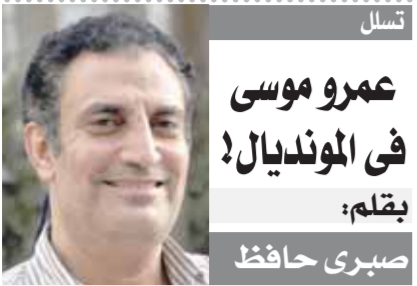
عمرو موسى في المونديال! بقلم: صبرى حافظ

وأكد أن المنتخب سيخوض مواجهة ودية غدا الجمعة أو بعد غد السبت بعد الخسارة وديا أمام منتخب غانا للمحليين بنتيجة (٢-٠). ويلعب المنتخب في مجموعة تضم نيجيريا والسنگال وموزمبيق في بطولة كأس الأمم الأفريقية للشباب.