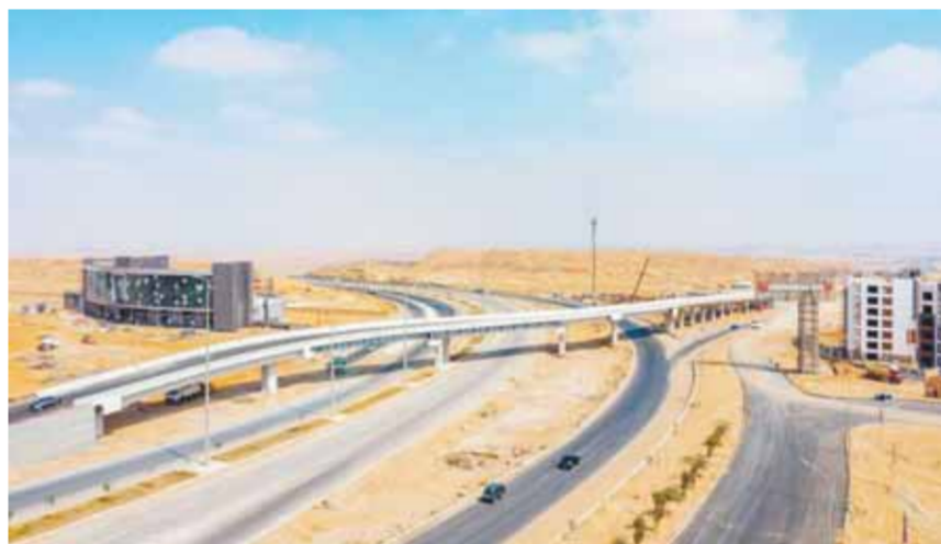
وبما يتماشى مع الطفرة الكبرى التي حققتها الدولة مؤخراً بتنفيذ المشروع القومي للطرق والمحاور الكبرى، موضحاً أن أعمال تنفيذ الكوبريين تصل إلى كيلو ونصف الكيلو، بعدد ٢ الكوبريين استغرقت عاماً ونصف العام.

افتتحت شركة «المستقبل» للتنمية العمرانية، المالك والمطور العام للمدينة، مجموعة كبرى لربط المدينة بأهم الطرق والمحاور المرورية الرئيسية للقاهرة والعاصمة الإدارية الجديدة والمناطق العمرانية المحيطة، بتكلفة استثمارية تصل لقرابة ٢٦٠ مليون جنيه، وبحضور ممثلى الهيئة العامة للطرق والكبارى والنقل البرى، وقيادات شركة المستقبل واستشارى المشروع والمهندسين العاملين فيه.