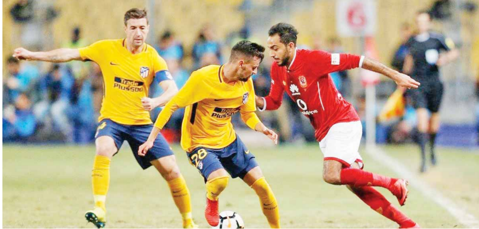
كهربا ينتظر حسم مصيره القانوني للعودة لمباريات الأهلي

ويعد الخطيب اجتماعاً مع السويسري مارسيل كولر المدير الفني للفريق الأحمر قبل لقاء بيراميدز المقرر يوم الاثنين المقبل للدوري للتعرف على تقييمه للفترة الماضية.