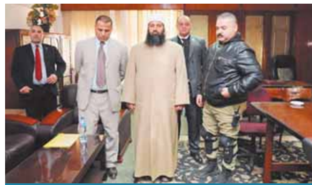
دعا المواطنين للزواج قبل صدور قانون الأسرة الجديد

وأعلن الدكتور مصطفى مدبولي توجيه الرئيس عبدالفتاح السيسي، رئيس الجمهورية، بتعديل شرط السن في مسابقات شغل وظائف معلم مساعد بوزارة التربية والتعليم والتمهيد الفني ليصل إلى ٤٠ عاماً بدلا من ٣٥ عاماً، وتعديل شرط الحصول على تقدير جيد كحد أدنى لخوض المسابقة إلى الحصول على تقدير مقبول، وذلك في إطار إتاحة الفرصة لأكبر قدر من الشباب في خوض المسابقة.