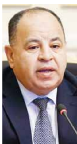
د. محمد معيط

خلال السنوات المقبلة. وأوضح المهندس محمود عصمت أنه وفقاً للوثيقة سيتم التخارج من بعض القطاعات الخاص من خلال عدة أساليب وصور مختلفة للشراكة، فضلاً عن إشراك القطاع الخاص في قطاعات أخرى بأشكال وطرق متعددة، وكذلك الاستثمار في عدد من القطاعات. ووجه وزير قطاع الأعمال بوضع خطة متكاملة لزيادة الصادرات وتوطين الصناعة، وزيادة الاعتماد على المنتج المحلي لتقليل فاتورة الاستيراد وتخفيف الضغط على الموارد من العملة الصعبة، مشدداً على ضرورة تكثيف الجهود لخفض النفقات وحوكمة الإيرادات والمصرفيات.