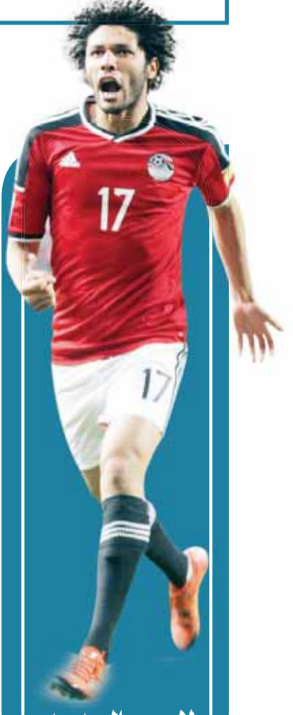
لاعب ريال مدريد