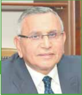
د. عبدالسند يمامة

تواترت الأحاديث خلال الأيام الماضية حول تغيير وزاري قادم خلال ساعات تحت ضغط الأزمة الاقتصادية التي تمر بها البلاد وعدم استقرار سعر الصرف.