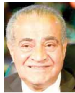
د. علي المصيلحي

كتبت - جيهان موهوب: أعلنت وزارة التموين والتجارة الداخلية عن بدء معارض «أهلاً رمضان» الأحد القادم الموافق الأول من يناير ٢٠٢٢ بناء على توجيهات الرئيس عبدالفتاح السيسي ومجلس الوزراء لتوفير كل احتياجات المواطنين من السلع وتخفيضات مناسبة، وأشار الدكتور علي المصيلحي وزير التموين والتجارة الداخلية إلى استمرار معارض «أهلاً رمضان» حتى نهاية شهر رمضان الكريم. وأضاف «المصيلحي» أنه سوف يتم إنشاء غرفة عمليات مركزية مشتركة لمتابعة توافر السلع ومتابعة الإفراج عن مستلزمات الإنتاج بالتنسيق مع البنك المركزي المصري. جاء ذلك خلال اجتماعه مع وزير التجارة والصناعة