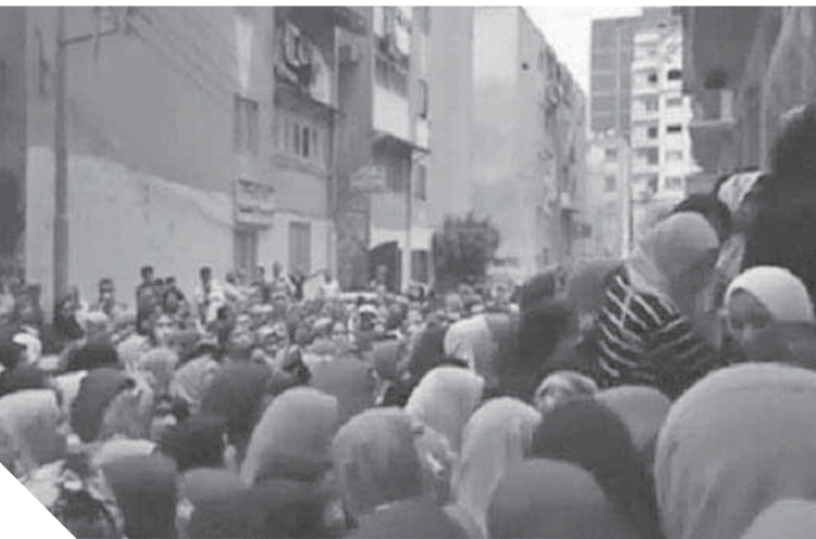
سناतर الدقهلية تتحدى المسئولين