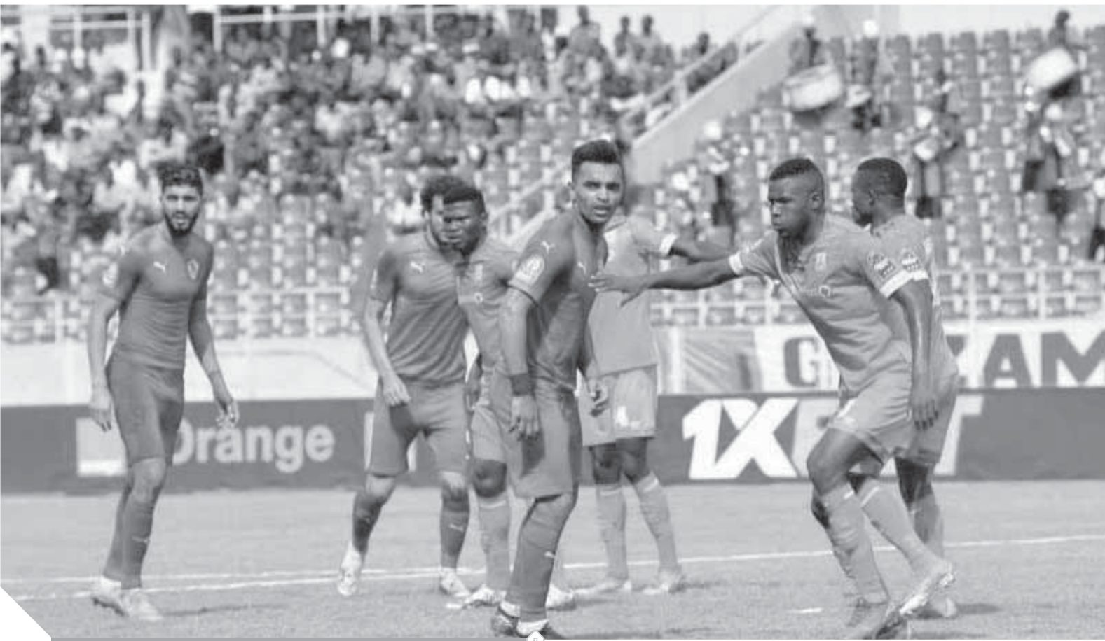
الزمالك فطر فى الفوز على زيسكو الزامبى