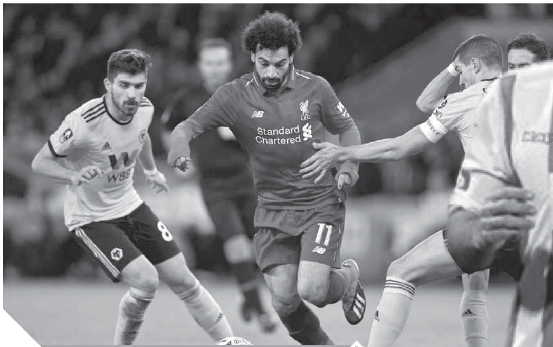
ليفربول فى مهمة صعبة أمام وولفرهامبتون