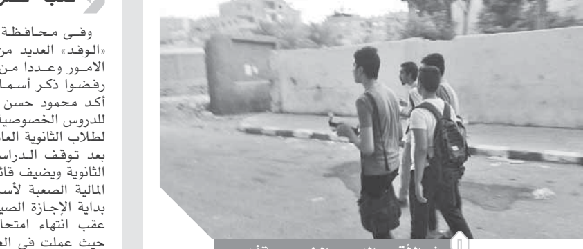
في الأقصر الدروس الخصوصية أهم