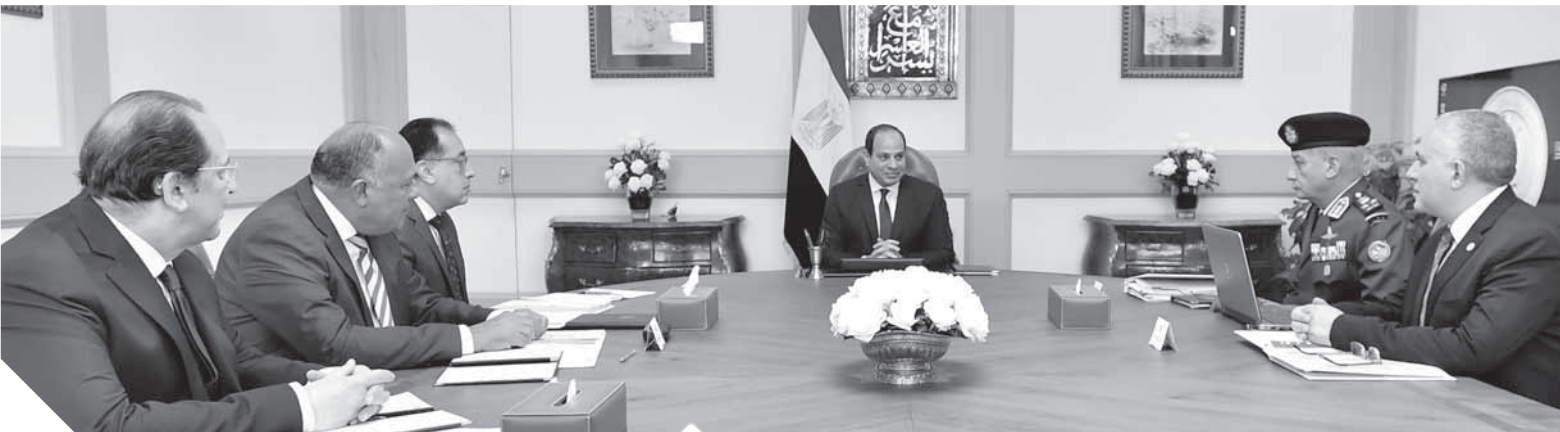
الرئيس خلال لقائه مع رئيس الوزراء وعدد من الوزراء