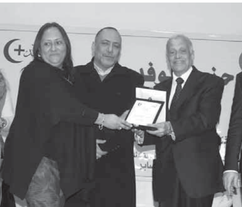
قيادات الوفد خلال التكريم

وأعرب أهالى منطقة عين شمس عن سعادتهم بإعادة مقر حزب الوفد بالمنطقة من جديد، مشيرين إلى أن الحزب أصبح أقوى، وعاد الشارع المصرى من جديد بعد أن تولى المستشار بهاء الدين أبوشقة رئاسة الحزب، ووضع خطة للتواصل مع المواطنين لتحقيق آمالهم وأحلامهم وتوصيل أصواتهم للمسؤولين. وقالوا إن حزب الوفد بيت الأمة الوطنية ومنذ ١٩١٩ وهو يقف إلى جوار الدولة المصرية، وأن الدولة المصرية تسير بخطوات ثابتة وسريعة نحو بناء دولة ديمقراطية حديثة بسواعد أبنائها، والرئيس عبد الفتاح السيسى حريص على تمكين الشباب والمرأة لبناء الدولة.