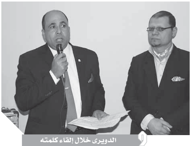
الدويرى خلال الإلقاء كلمته