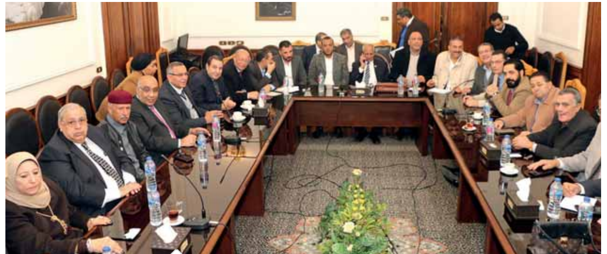
جانب من اجتماع الهيئة العليا برئاسة أبوشقة

الوفد يطالب بحزبين أو ثلاثة أحزاب قوية على الساحة السياسية ضرورة أن يكون حزب الوفد لاعباً أساسياً على المسرح السياسى الوفد داعم ومساند للدولة المصرية ومدافع عن مصلحة الوطن والمواطن