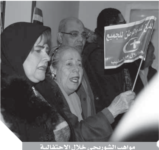
مواهب الشورى خلال الاحتفالية

وطالب «منصور» لجنة الوفد بعين شمس بأن يكون لها تواجد قوى في الشارع السياسى