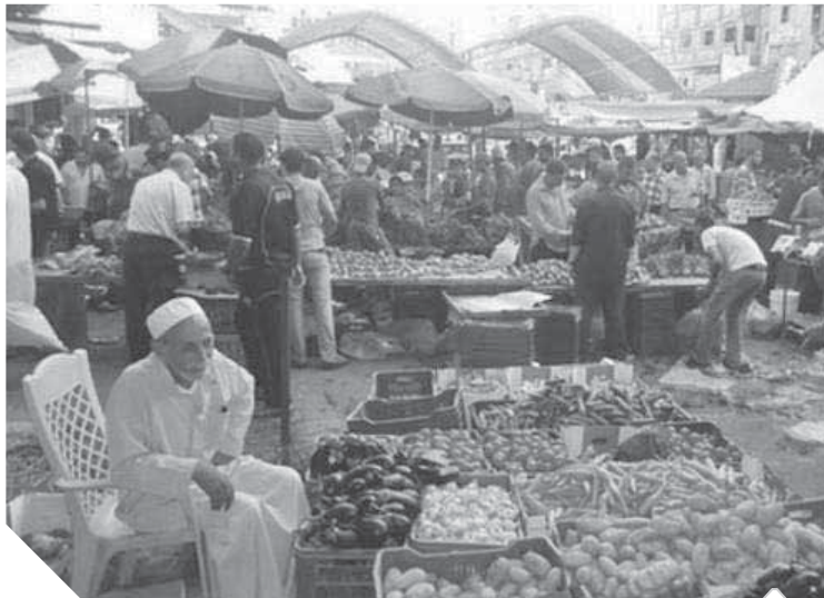
استقرار الأسواق مع خفض السلع الغذائية