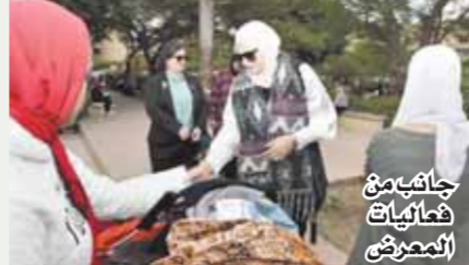
جاشيه من فعاليات المعرض

كتب- صلاح شرابي: شهد معرض الملابس الذي نظمته كلية البنات للآداب والعلوم والتربية بجامعة عين شمس إقبالاً كبيراً من الطالبات بعد دقائق من افتتاحه، حيث ضم المعرض بعض الملابس للسيدات والرجال والأطفال، كذلك الشنط والأحذية وبعض الأكسسوارات. وأقيم المعرض تحت رعاية الدكتور محمود المتينى، رئيس جامعة عين شمس، والدكتورة غادة فاروق، نائب رئيس الجامعة لشئون خدمة المجتمع وتنمية البيئة، ومشاركة الدكتورة هبة بركات، وكيل