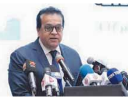
د. خالد عبدالغفار

أطلق الدكتور خالد عبدالغفار وزير الصحة والسكان، أمس الاثنين، الاستراتيجية الوطنية لترشيد استخدام مصادات الميكروبات، وذلك لحكومة استخدام المصادات الحيوية بشكل آمن وفعال.