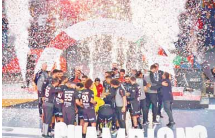
احتفالات لاعبي المنتخب بعد التتويج القاري