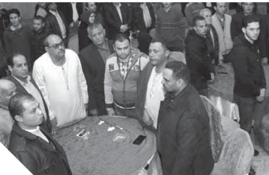
خلال السلام الوطني