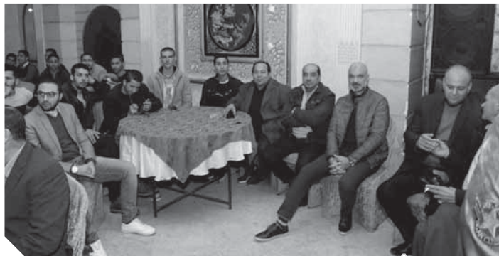
مشاركة أعضاء وفد الشرقية بالدورة