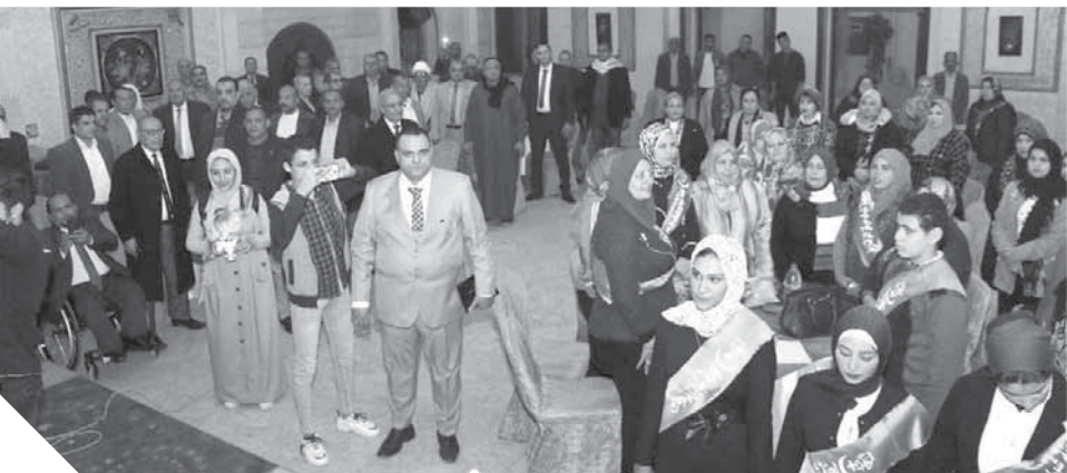
الحضور خلال السلام الوطني