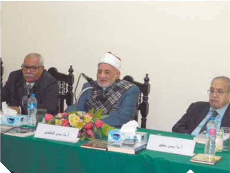
رئيس مجمع الخالدين خلال احتفال الجمعية الفلسفية به