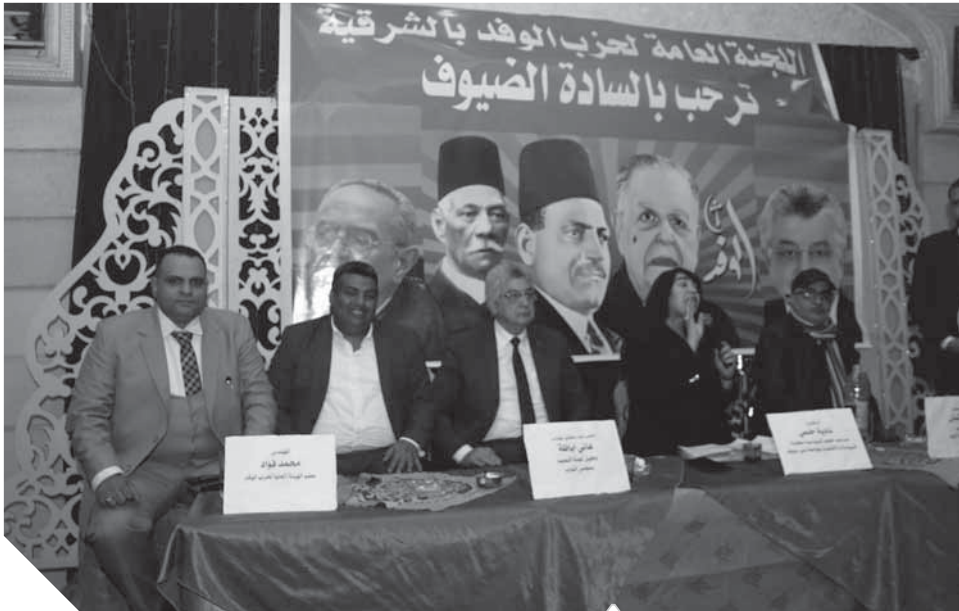
جانب من الدورة