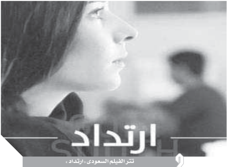
تتر الفيلم السعودى «ارتداد»

جاء ذلك خلال مشاركته فى المنتدى العالمى الأول للاجئين المنقد حالياً فى مدينة جنيف بسويسرا بحضور النائب والمستشار الفيدرالى السويسرى إيجازينو كاسيس، وروؤساء الدول والحكومات والفخوض السامى للأمم المتحدة لشئون اللاجئين فيليبو غراندى، والقيادات الأُممية ومنظمات التنمية وقادة الأعمال. وقدم الربيعة فى كلمته الشكر والتقدير للثامنين على المنتدى الذى يهدف إلى تخفيف الضغوط على البلدان المضيفة، وتعزيز اعتماد اللاجئين على أنفسهم، ودعم أوضاع بلدانهم ليتمكنوا من العودة