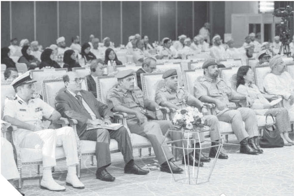
حرص عمانى كبير على المشاركة فى جلسات المؤتمر الدولى بالسلطنة

الاجتماعية بإنشاء بنك معلومات خاص بعلاقات العالم الإسلامي وعُمان والصين.