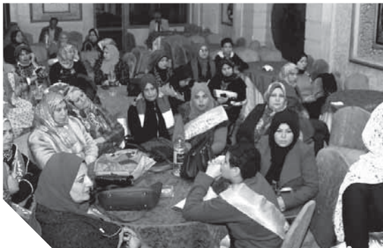
المرأة الوفدية بالشرقية