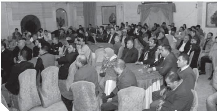
جانب من مشاركة شباب وفد الشرقية