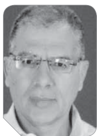
د. مصطفى محمود