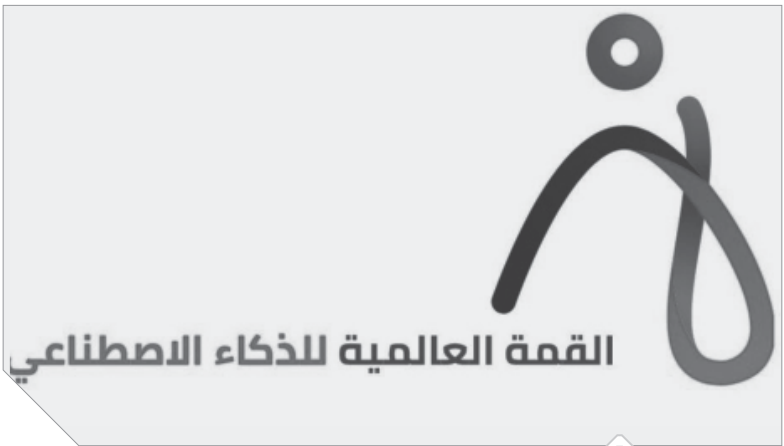
شعار مبادرة القمة العالمية للذكاء الاصطناعى

ويمكن للمهتمين التسجيل فى مسابقة «الأرتاثون» عبر رابط المسابقة فى الموقع الرسمى للقمة العالمية للذكاء الاصطناعى على شبكة الإنترنت: https://www.theglobalaisummit.com/artathon وتتم فترة التسجيل من ٢٢ ديسمبر ٢٠١٩م إلى ٧ يناير ٢٠٢٠م. ويحظى برنامج «الأرتاثون» بدعم عدد من الشركات الإستراتيجيين كوزارة الثقافة والاتحاد السعودى للأمن السيبرانى والبرمجة، بالإضافة إلى دعم عدد من الجامعات السعودية وشركات الاتصالات.