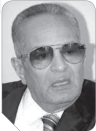
بهاء الدين أبوشقة