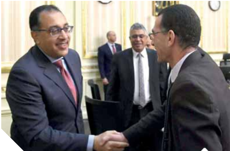
الدكتور مصطفى مدبولي يرحب برئيس تحرير الوفد

أكد رئيس الوزراء أن هناك اهتماماً شديداً بالمصانع التابعة للدولة خاصة فيما يتعلق بمصانع الغزل والنسيج وهناك خطة محكمة لتطويرها. وإعادة تشغيلها بما يتوافق مع العصر الحالي. كما أن هناك اهتماماً بالإنفاق بدعم الصادرات وسيظهر مردودها خلال القادمين. نوه رئيس الوزراء إلى قضية الدين الخارجى موضحاً أنه فى المنطقة الآمنة ومصر تسعى بكل السبل إلى المزيد من الخفض فى إطار المنطقة الآمنة. وقال رئيس الوزراء إن جميع السلع متوافرة فى الأسواق، وهناك ملاحظات للتجار الجشعين الذين يستغلون المواطنين. كما أشار إلى أن الانتقال للعاصمة