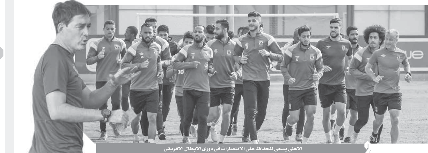
الأهلى يسعى للحفاظ على الانتصارات فى دورى الأبطال الإفريقى