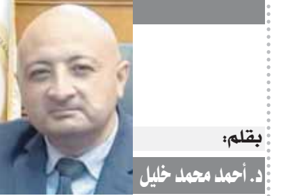
بقلم: د. أحمد محمد خليل