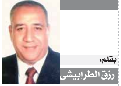
بقلم: زكى الطرابيشي

في عام 2004، قدم «طارق» فيلما حمل اسم «كيوم وأنثيو» بطولة صديقه المطرب الراحل عامر منيب، وقدم الراحلان ثنائية حظيت بقبول طيب، في تعاون اتخذ من صداقتهما قاعدة حسنت من التفاهم بينهما أمام الكاميرا. ورحل المطرب المصري عامر منيب، في مثل هذا اليوم 26 نوفمبر من عام 2011، فيما رحل «طارق» صديقه المقرب، في نفس اليوم، في مفارقة أثارت دهشة محبيهما. ويمجد وفاته حضر كل من الفنان محمد هنيدى، والفنان أشرف زكى، والفنان محمد رياض والفنان أحمد خالد صالح والفنانة هنادى مهنا والفنان على الطيب، وغيرهم من