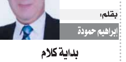
بقلم: إبراهيم حمودة

اليوم الدولي للتسامح.. ويحدد إعلان الأمم المتحدة أن مسألة التسامح ليست فقط واجبا أخلاقيا، وإنما أيضا، شرط سياسي وقانوني للأفراد والجماعات والدول، كما أنه يربط قضية التسامح في الصوك الدولية لحقوق الإنسان التي وضعت على مدى السنوات الخمسين الماضية، الأمين العام لهلال الأحمر المصري «فرع السويس»