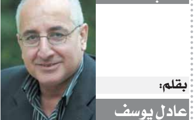
بقلم: عادل يوسف