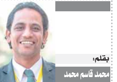
بقلم: محمد قاسم محمد

دكتور جامعي وكاتب مصري drahmedkhalil2020@yahoo.com