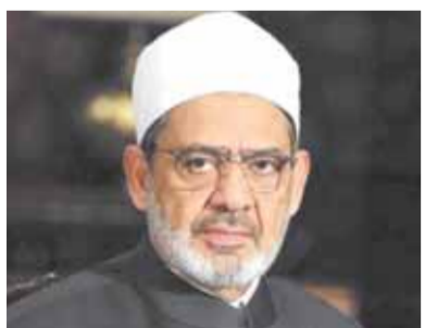
د. أحمد الطيب

التتوع وأسلوب الطرح والعرض بما يسمح لها بالتواصل مع كافة الفئات العمرية وبالأخص الشباب، فهى منتقاة من أفضل الدعاة لبيان دور كل مواطن وبيان مسؤوليته الاجتماعية والمجتمعية والوطنية، بما يعكس على تحقيق الاستقرار العام والعبور بمصرنا الحبيبة إلى برّ الأمان.