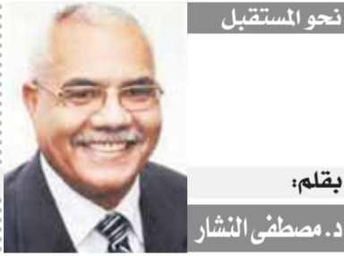
بقلم: د. مصطفى النشار

«ليب» يبدأ ترتيب جدران البيت الأبيض.. وجلسة مع «فتوح» لتمديد عقده