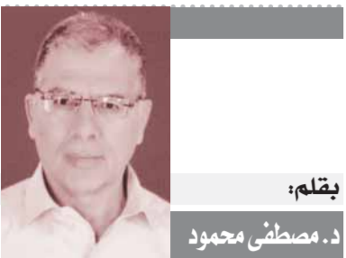
بقلم: د. مصطفى محمود