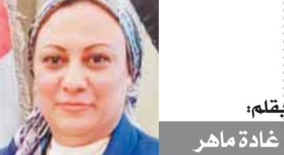
بقلم: غادة ماهر