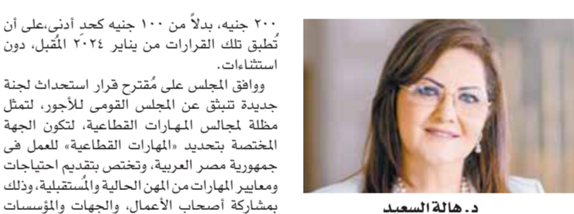
د. هالة السعيد

٢٠٠٠ جنيه، بدلاً من ١٠٠ جنيه كحد أدنى، على أن تُطبق تلك القرارات من يناير ٢٠٢٤ المقبل، دون استثناءات. ووافق المجلس على مُقترح قرار استحداث لجنة جديدة تتبني عن المجلس القومى للأجور، لتمثل مظلة مجالس المهارات القطاعية، لتكون الجهة المختصة بتحديد «المهارات القطاعية» للعمل فى جمهورية مصر العربية، وتخصن بتقديم احتياجات التضمن المهاترات من المهن الحالية والمستقبلية، وذلك بمشاركة أصحاب الأعمال، والجهات والمؤسسات المعنية. بهدف رفع مستوى «القوى البشرية» بما يُحقق التوافق بين احتياجات سوق العمل المحلى والخارجى، وتطوير نظم وأساليب تأهيلها وتدريبها لتنافس المستويات الدولية فى كافة التخصصات، على أن يتم تشكيل لجنة لوضع معايير وأليات عمل «اللجنة». كما وافق «المجلس» على إعفاء عدد من الجمعيات الأهلية من تطبيق الحد الأدنى للأجور بطلب من د. نيفين القباج وزيرة التضامن الإجتماعى، نظراً لأن هذه الجمعيات قائمة على الأساس على التبرعات.