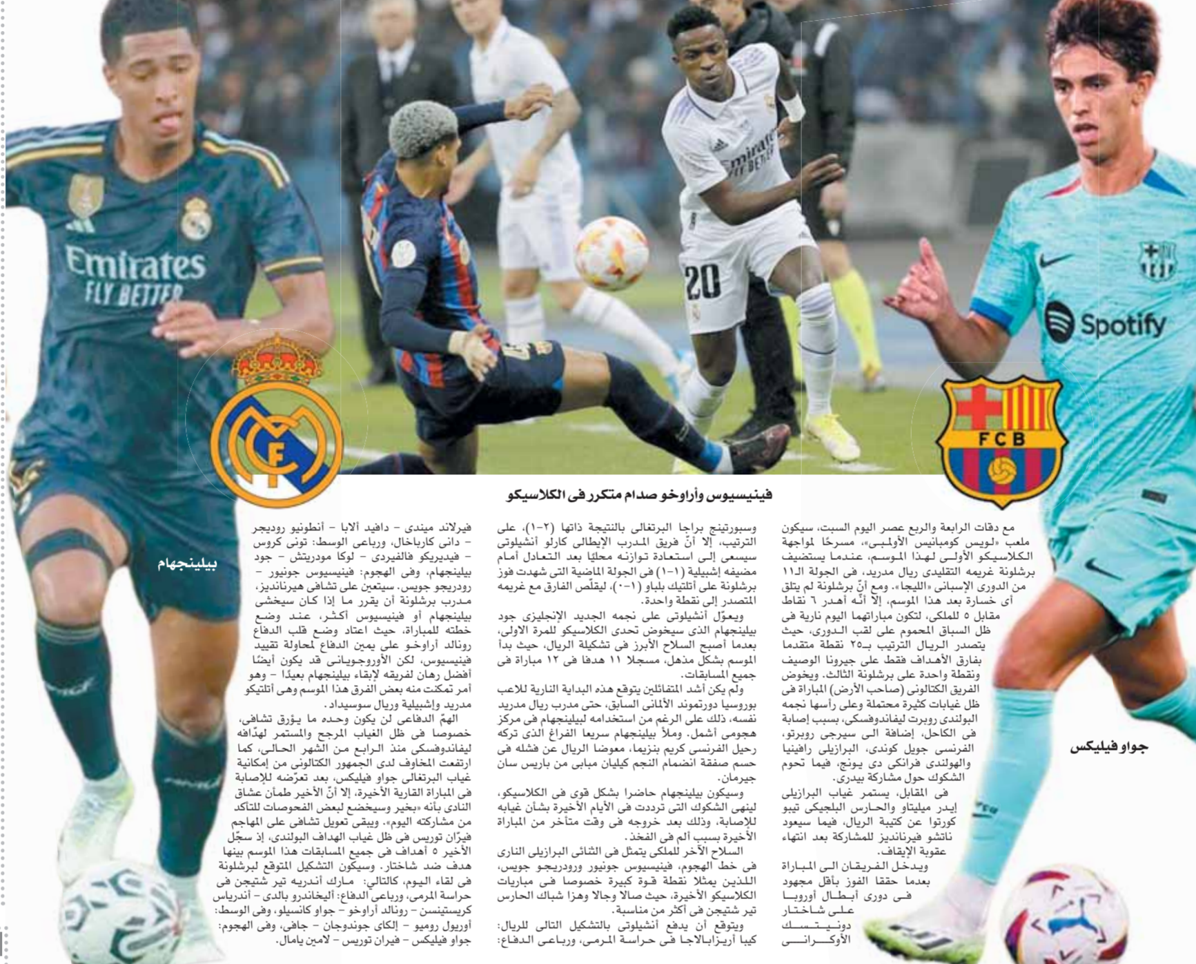
فينيسيوس وأراوخو صدام مثير في الكلاسيكو