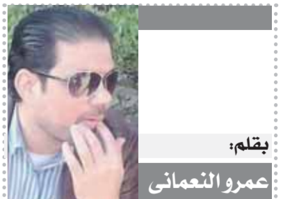
بقلم: عمرو التعمانى

الريال يتسلح بتوهج «بيلينجهام» والثنائى البرازيلى.. وبرشلونة يراهن على جواهر «تشافى»