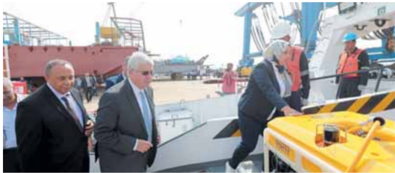
الوزير داخل سفينة الأبحاث العلمية