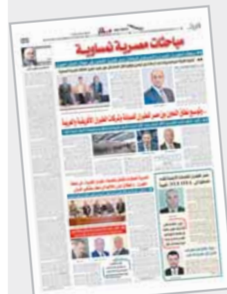
05 نافذة على المطار