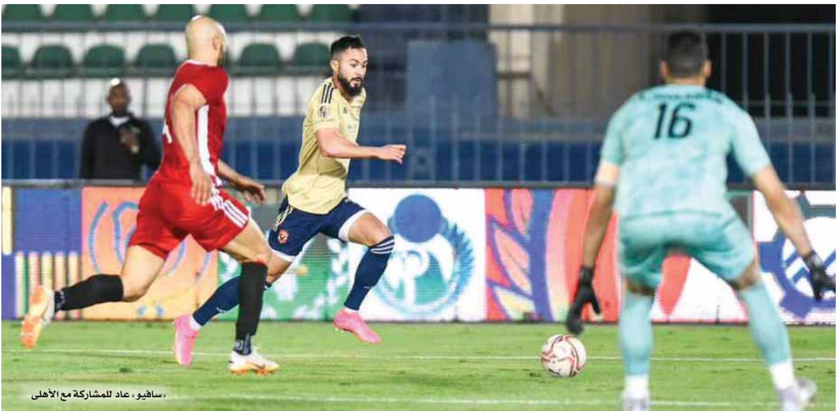
«سافيو» عاد للمشاركة مع الأهلي