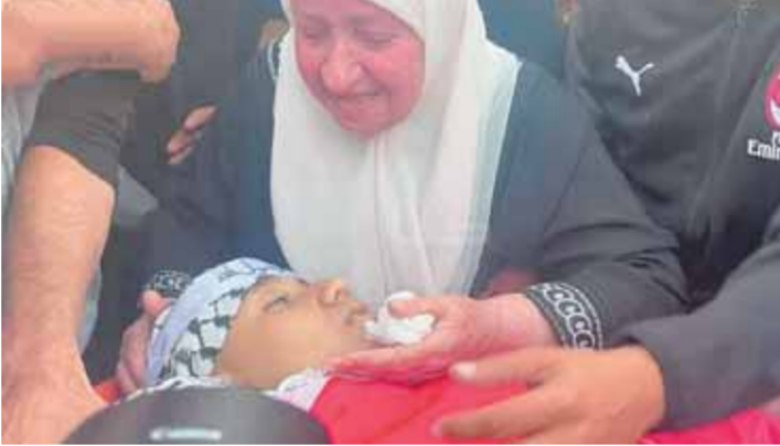
أم فلسطينية تلتقي نظرة الوداع على ابنها الشهيد

وواصلت المعارضة الإسرائيلية المظاهرات الاحتجاجية ضد حكومة بنيامين نتنياهو، وذلك للاسبوع الـ ٢١ الذي تقاطع كابلان بتل أبيب وفي حوالي ١٥٠ موقفاً في جميع أنحاء الداخل الفلسطيني المحتل.