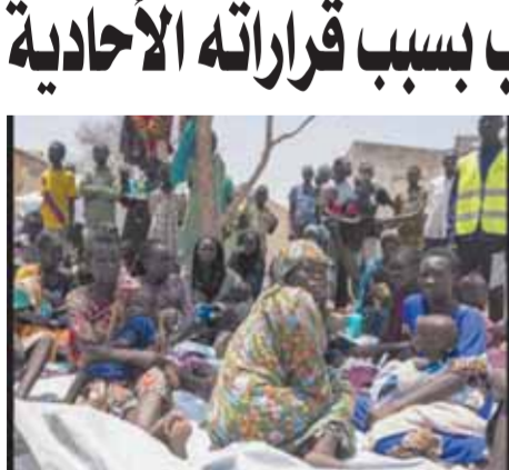
الحرب شردت السودانيين

تواصلت أمس المعارك في السودان بين الجيش وقوات الدعم السريع، مع وضع يزداد حرجاً في إقليم دارفور غرباً. ونزوح جماعي لدولة جنوب السودان الحدودية وسط أوضاع مأساوية بالغة الخطورة.