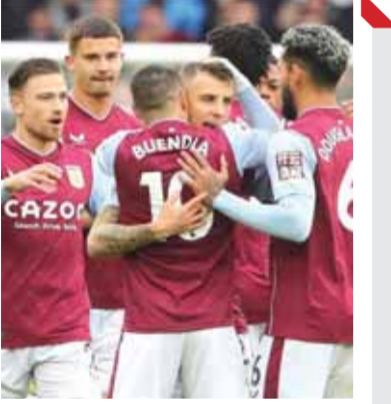
أستون فيلا يبحث عن مقعد في دوري المؤتمر الأوروبي