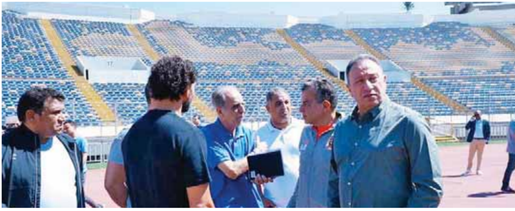
وفد الأهلئ يعاين استاد محمد الخامس

ويؤدى الفريق تدريباته على ملعب نادى الاتحاد الرياضى البيضاوى بمقاطعة عين السبع على أن يخوض مرانته غداً الأحد على ملعب محمد الخامس.