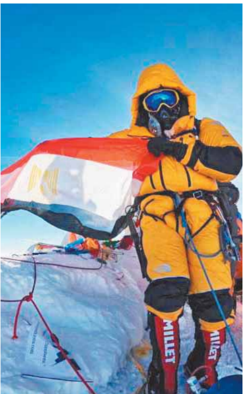
طبع بمطابع الأخبار،