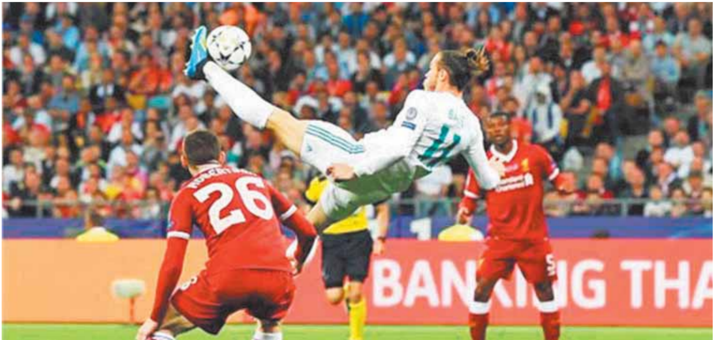
ليفربول وريال مدريد فى تحد جديد الليلة