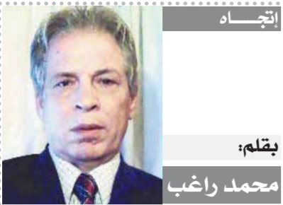
بقلم: محمد رغب