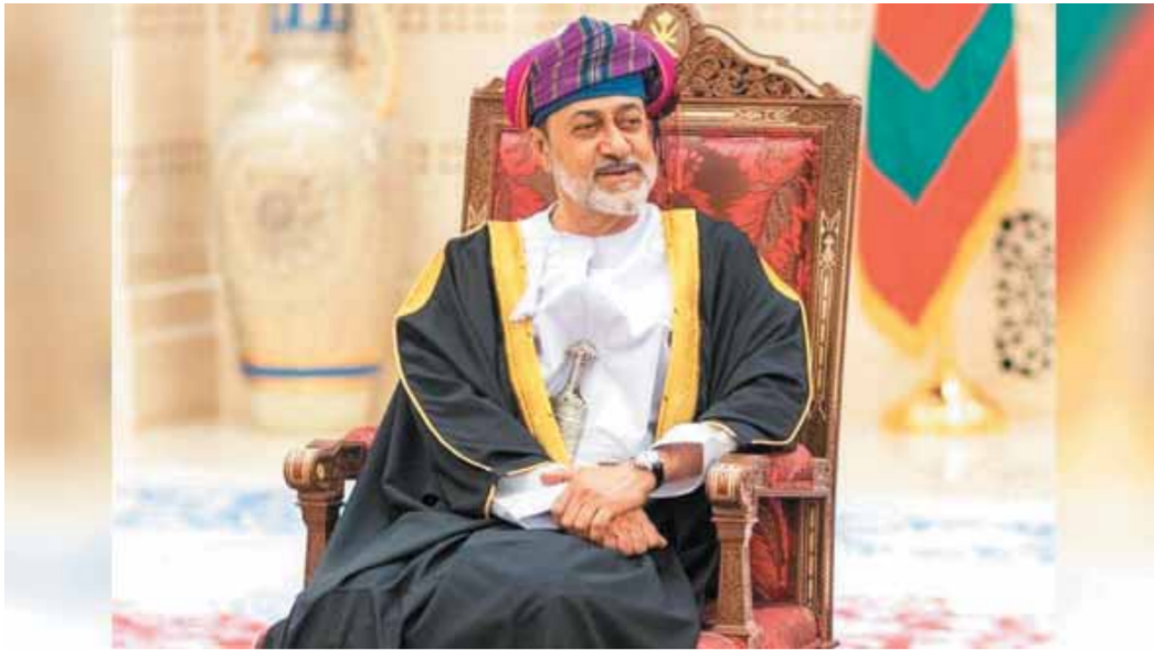
هيثم بن طارق سلطان عُمان