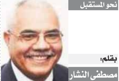
بقلم: مصطفى الشار

وتسلك مسؤولو الوداد بحجز مدرجات الدرجة الثالثة يساراً لأنها مخصصة لجماهير النادى المغربى وتحديدأ جماهير