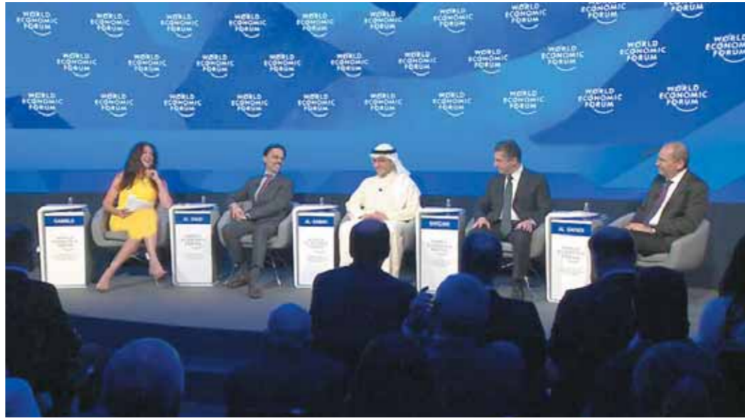
من مشاهد وحدة تنفيذ رؤية عمان ٢٠٤٠