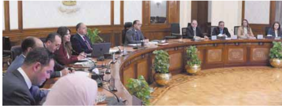
في عامه المالي الأول تتراوح بين ٢٨ و٣٠ مليار جنيه، ومن المقرر أن يبدأ العمل به اعتباراً من أول يوليو المقبل، لافتاً إلى أن موازنة العام الحالي للبرنامج تبلغ ٨ مليارات

وصرح السفير نادر سعد، المتحدث الرسمي باسم رئاسة مجلس الوزراء، بأنه تم خلال الاجتماع التوافق على عدة نقاط تتعلق بالبرنامج الجديد لدعم الأعباء التصديرية، تتمثل في أن المدى الزمني للبرنامج الجديد يصل إلى ٣ سنوات، كما أن التكلفة التقديرية للبرنامج