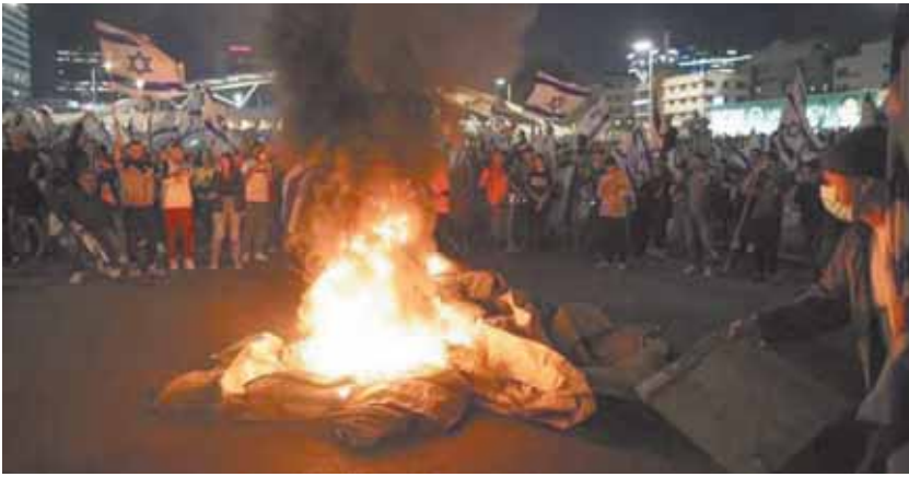
تسونامي الربيع العبري يجتاح إسرائيل.. ويجرف كل ما في طريقه

وشجاعة دون مزيد من التأخير». وقال نايف لايب، زعيم المعارضة في إسرائيل، إن حكومة نتنياهو، فقدت بوصلتها ولا تنظر للواقع، وأضاف «لايب» في اجتماع حزبه أن حكومة «نتنياهو»، أصبحت خطراً على الأمن القومي الإسرائيلي، وتوقفت العمل في ميناء حيفا وأسدود بعد أن أعلن اتحاد العمال الرئيسي في إسرائيل عن إضراب عام في وقت سابق حتى يتخلى نتنياهو عن التشريع الخاص بالتعديلات القضائية، فيما أوقفت معظم البنوك أعمالها. ودعا الاتحاد العام لنقابات العمال في إسرائيل إلى «إضراب عام» فوري رداً على مشروع الإصلاح القضائي المقترح من الحكومة الذي يثير احتجاجات واسعة في البلاد منذ ثلاثة أشهر. وأعلنت النقابات الطبية في إسرائيل بعد ذلك «إضراباً شاملاً في قطاع الصحة» سيكون له تأثير حتمي على كل الخدمات الطبية.