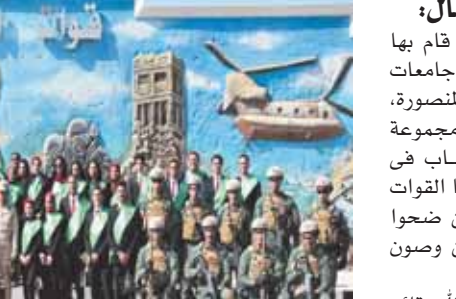
د. هانى سويلم

قال دهاى سويلم، وزير الموارد المائية والري، إن وزارته دبرت عدد (١٣٤) قطعة من الأراضي من منافع الري بمساحة تجاوز ٢٤٨ الف متر مربع بمحافظة (سوهاج)، توفيقية، قنا، المنيا، دمياط، أسوان، الأقصر، أسيوط، البحيرة، الدقهلية، كفر الشيخ، بنى سويف، الإسماعيلية، الفيوم، الجيزة، القليوبية) لإقامة مشروعات خدمية، ضمن مبادرة حياة كريمة. وأضاف في بيان صادر عن الوزارة، صباح أمس الاثنين، أن عدد المشروعات نحو ١٤٩ مشروعاً خدمياً تتمثل في «مركز شباب - محطات رفع- محطات رفع- محطات معالجة- مدارس- وحدات صحية- نقاط إسعاف- نقاط شرطة- مطافئ- مجمعات خدمية ومكاتب بريد- مطافئ- مجمعات زراعية- مجمعات خدمية وزراعية».