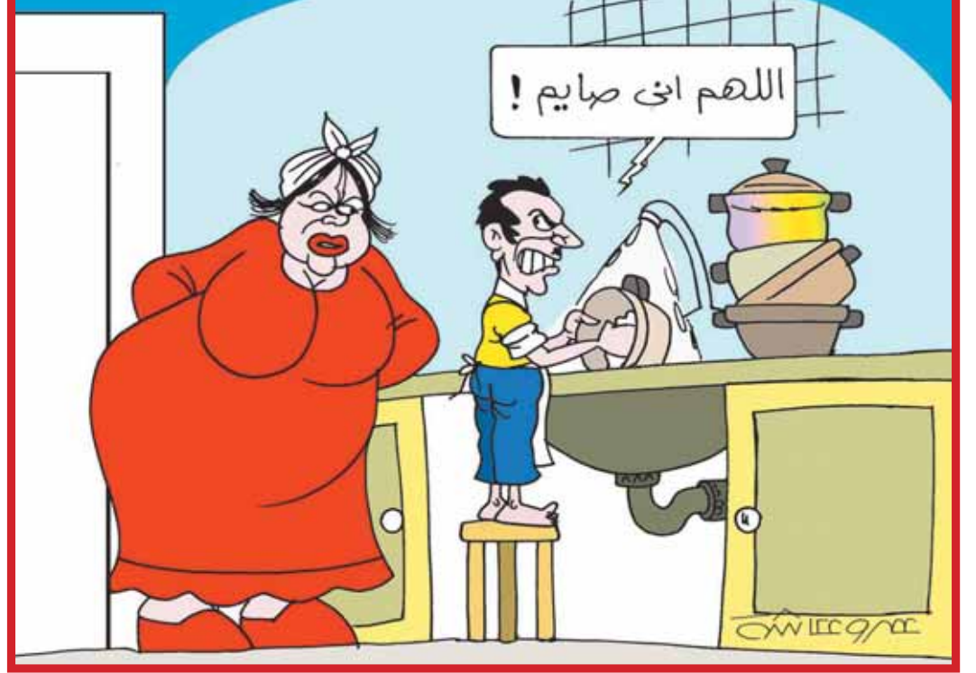
طبع بمطابع الأخبار

واصلت محافظة الإسكندرية تنفيذ المبادرة الرئاسية للتشجير «١٠٠ مليون شجرة»، والتي تستهدف الاهتمام بالبعد البيئي، ضمن الخطة الشاملة لتحقيق التنمية المستدامة، وذلك لتوفير بيئة نظيفة وصحية وأمنة للمواطن المصري. قال اللواء محمد الشريف محافظ الإسكندرية بأنه تم توجيه الإدارة العامة للحدائق المركزية بقيادة اللواء أشرف بدران، بزراعة ورفع كفاءة الميادين وجميع الحدائق العامة بالإضافة إلى زيادة عدد الأشجار المثمرة وتشجير الطرق الرئيسية ورفع كفاءة الجزر الوسطى على المحاور الرئيسية.