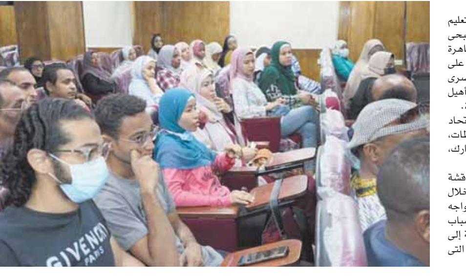
طبع بمطابع الأخبار

كتبت - طارق يوسف: أعلنت نيفين القباج وزيرة التضامن الاجتماعي عن تقدم ٢٢ ألف مواطن ومواطنة لطلب حج الجمعيات الأهلية لموسم ١٤٤٤هـ - ٢٠٢٣م، وذلك عقب غلق باب التقديم لأعضاء الجمعيات الأهلية الراغبين في أداء فريضة الحج لموسم ١٤٤٤هـ - ٢٠٢٣م. وأكدت القباج أن الوزارة وضعت عدداً من الشروط الواجب توافرها في الراغب ل أداء فريضة الحج هذا العام منها، أن يكون أحد أعضاء الجمعية العمومية للجمعية الأهلية المسجل بعضويتها عند تقديم الطلب، ومسدد الاشتراك السنوي سواء كان عضواً عاملاً أو منتسباً، وأن تكون الجمعية أو المؤسسة مقيدة قبل ١/١/٢٠٢٣م، ولم يوقع على الجمعية أو المؤسسة أي أجزاء نتيجة لمخالفات قانونية أو مالية ثبتت بحقها بحكم نهائي، كما لم يسبق للمتقدم الراغب في أداء الفريضة الحج من قبل طوال حياته، حيث سيتم التحقق من الحجاج الفائزين فقط من خلال شهادة التحركات.