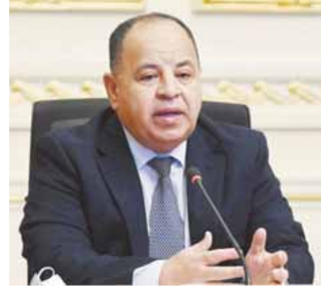
د. محمد معيط

وأضاف الوزير أن حزمة الحماية الاجتماعية لتحسين أجور العاملين بالدولة وأصحاب المعاشات تبلغ تكلفتها السنوية ١٥٠ مليار جنيه منها ٩٥ مليار جنيه لزيادة الحد الأدنى للأجور، وقيمة معاشات تكافل وكرامة، و٥٥ مليار جنيه لزيادة المعاشات، لافتاً إلى أن تكلفة تعجيل صرف