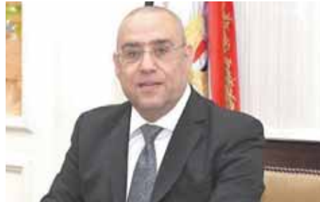
د. عاصم الجزار

أصدر الدكتور عاصم الجزار، وزير الإسكان والمرافق والمجمعات العمرانية، ٣ قرارات لإزالة التعديات والإشغالات الواقعة على قطعة أرض مملوكة لهيئة المجتمعات العمرانية الجديدة، ومخالفات البناء الواقعة بمناطق تحت لولاية أجهزة تنمية جزيرة الوراق - العبور الجديدة - العاشر من رمضان. وشدد وزير الإسكان على مواصله جهود أجهزة الوزارة بالتعاون مع الجهات الأخرى لإزالة الظواهر العشوائية والمخالفات بالمدن الجديدة لضبط العمران، والحفاظ على الطهر الحضاري بالمدن الجديدة، ومنع ظهور العشوائيات بجميع صورها. ونصت القرارات على أن تزال بالطريق الإداري مخالفات البناء الواقعة بجزيرة الوراق وعددها (٩) متهربات مكانية، والمتصلة في أعمال بناء بدون ترخيص، وعلى أن تزال بالطريق الإداري مخالفات البناء المملوكة على قطعة أرض بجمعيه أحمد عرابي بمدينة العبور الجديدة، والمتصلة في بنا دور ثان وغرف سطح بدون ترخيص. كما نصت القرارات على أن تزال بالطريق الإداري التعديات والإشغالات ووضع اليد على قطعة أرض بالقطعة