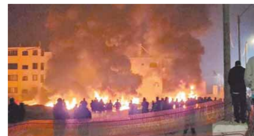
آثار الدمار والحرق الإسرائيلية ضد الفلسطينيين في جنوب نابلس