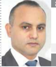
يقلم: صلاح شرابي