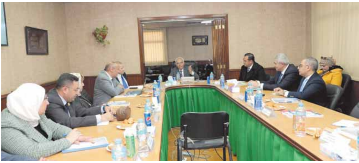
جانب من اجتماع الوزير في المركز القومي لامتحانات

وقد تم خلال الاجتماع التصديق على مشروع الموازنة للمركز للعام المالي ٢٠٢٣/٢٠٢٤، وخطة عمل المركز خلال العام القادم، وضرورة التركيز على رصد المشكلات الحياتية التي