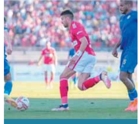
الأهلي يبحث عن مصالحة جماهيره أمام الداخلية 07

فلسطيني بالرصاص في يده، وتعرض آخر لطلعن بالسكاكين، بينما اعتدى المستوطنون بقضيب حديد على فلسطيني آخر، وسجلت الطواقم الطبية إصابة بالحجارة في الرأس، وه إصابات سقوط، و٤ أخرى بالضرب، وأكثر من ٣٥٠ حالة اختناق بالغاز في مختلف البلدات، إضافة للاعتداء على مركبات الإسعاف، وأعلنت كتبية طولكرم الرد السريع عن استهداف مستوطنة «أفتي حيفس» وحاجز الطيبة بصنليات كثيفة من الرصاص. في رام الله، بعد دعوات لدعم أهالي ريف جنوب نابلس، تزامناً مع مواجهات على المدخل الشمالي لمدينة بيت لحم، واستهدف فلسطينيون مركبات المستوطنين قرب مستوطنة بيتا غيليت بالزجاجات الحارقة، وانطلقت مسيرة في مخيم الدهيشة نصرمة لحوارة، وشهدت بلدة أبوديس شرق القدس المحتلة مواجهات عنيفة امتدت عدة ساعات بعد مسيرة دعماً لأهالي حوارة وريف نابلس، واستهدف مقاومون حاجز قلنديا شمالاً بعبوة محلية الصنع، تزامناً مع مواجهات على