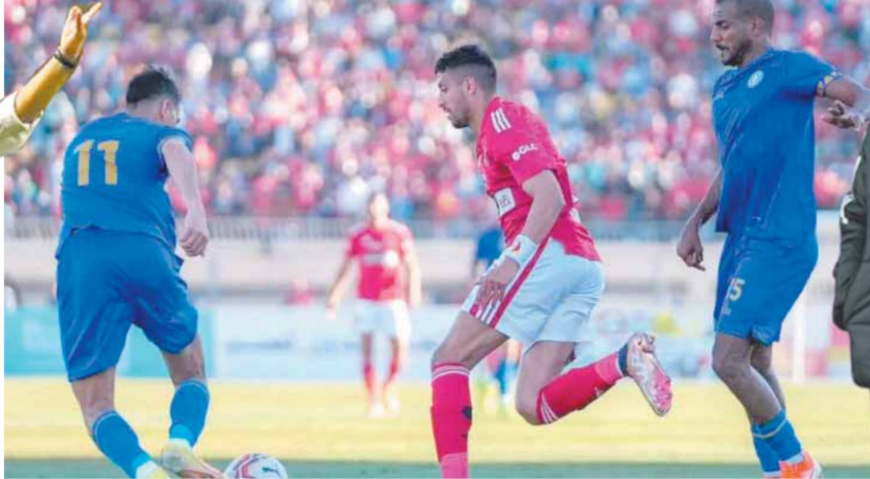
الأهلي يسعى لمواصلة انتصاراته في الدوري