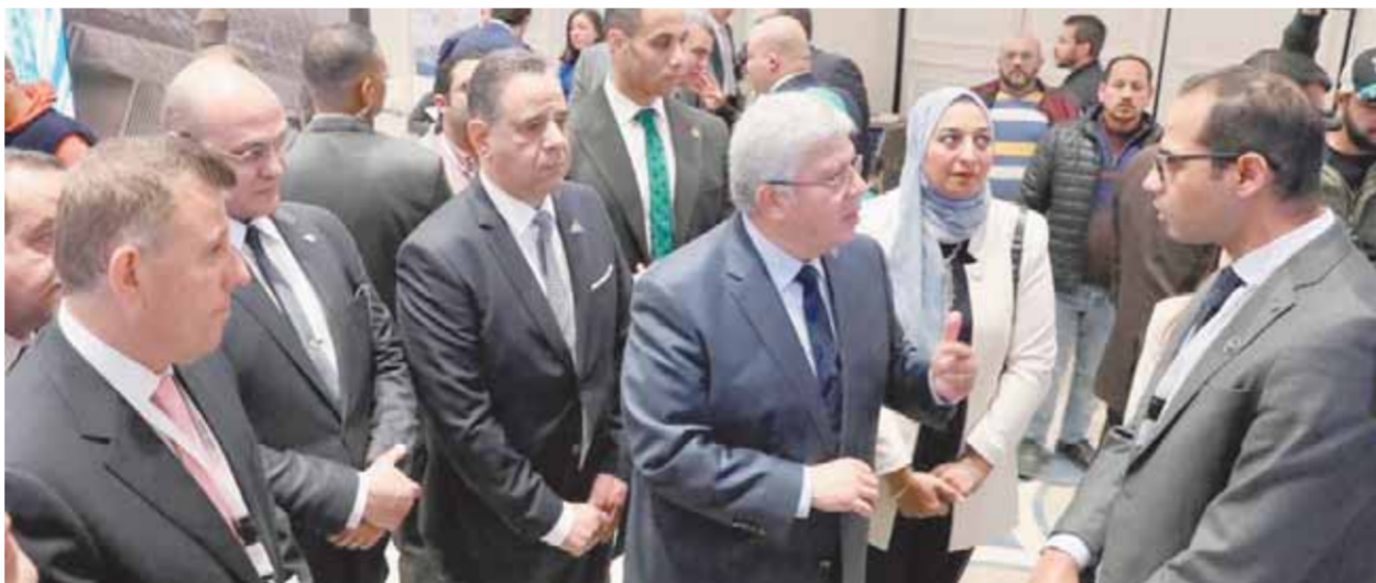
جانب من الافتتاح

المدن الذكية هي التصدي لتحديات المناخ، والتي تضع تحديًا كبيرًا أمام المدن القديمة للحفاظ على البيئة وتحقيق التقدم في مجال التكنولوجيا البيئية، لافتًا إلى نجاح قمة المناخ COP٢٧ التي نظمتها مصر والتي تم تنظيمها بشكل مشرف يعكس اهتمام مصر بفضايا التنمية، ومتابعة جهودها لمواجهة التبعات التي تفرزها التغيرات