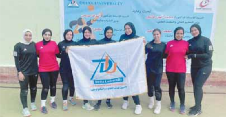
طلاب جامعة الدلتا يتفوقون في البطولات الجامعية