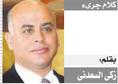
يقلم: زكي السعدني

المدن الذكية هي التصدي لتحديات المناخ، والتي تضع تحديًا كبيرًا أمام المدن القديمة للحفاظ على البيئة وتحقيق التقدم في مجال التكنولوجيا البيئية، لافتًا إلى نجاح قمة المناخ COP٢٧ التي نظمتها مصر والتي تم تنظيمها بشكل مشرف يعكس اهتمام مصر بفضايا التنمية، ومتابعة جهودها لمواجهة التبعات التي تفرزها التغيرات