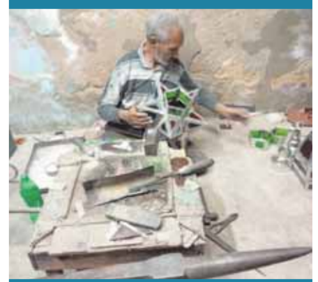
فانوس رمضان.. صناعة الجمال من الصفيح والزجاج 08