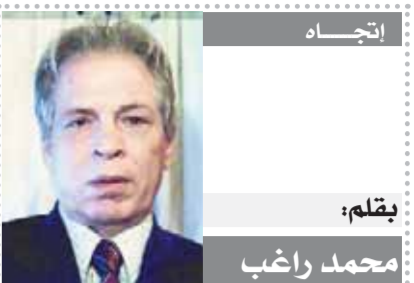
بقلم: محمد راغب