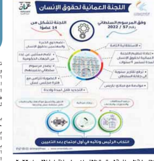
اللجنة العمانية لحقوق الإنسان ومنجزاتها خلال عام ٢٠٢٢

رصد التقارير الصحفية رصدت اللجنة تقارير صحفية تم نشرها في صحيفة «The Sun» و«day Mail» اللتان تنشران في عمارات المنازل من جمهورية زيمبابوي، وتقريراً من منظمة «Do Bold»، بمملكة هولندا عن عمالات المنازل غير قانونية في جمهورية سيراليون، والتمسك بالعمل في سلطنة عمان. حيث ذكرت تلك التقارير أن هؤلاء العاملات تعرضن لطرف عمالية ومعيشة صعبة، ويمكن اعتبارهن ضحايا للاتجار بالبشر كما تعرفه الأمم المتحدة، وفور تلقى هذه التقارير قامت اللجنة بمتابعة الموضوع، والتنسيق مع الجهات المختصة ومنها وزارة العمل، وشرطة عمان السلطانية، واتضح لها أن