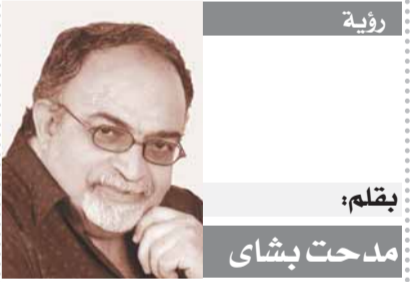
بقلم: مدحت بشاي