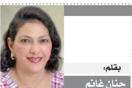
بقلم: حنان خانم

تتوزع الاقتصاد المصري بقطاعاته الإنتاجية يجعله قادراً على تجاوز التحديات والإجراءات الإصلاحية التي تتخذها الحكومة في الوقت الحالي تضع الاقتصاد المصري على الطريق الصحيح، وتمتد قوة الاستثمار الأجنبي المباشر في مصر، إلى جانب إصلاح الأوضاع المالية العامة. على الجميع أن يدفع من إصلاح الاقتصاد بدلاً من تقادم الأزمة وتدفع الثمن باهتلاً في المستقبل، مطلوب من جميع المصريين في ظل الظروف الحالية التسكع بروح التعدي المصرية العظيمة التي عبرت عنها أحداث الخامس والعشرين من يناير عام ١٩٥٢، كما قال الرئيس السيسي في كلمته بمناسبة الاحتفال بعيد الشرطة، كما قال الرئيس أن تحقيق آمال يتطلب جهداً وصبراً وقوة. نحن قادرون على بناء وطن يحقق آمالنا في الحياة الكريمة، وسنغير هذه الأزمة بوقتاً في الله وفي الشعب المصري الذي يقف خلف قيادة السياسية.