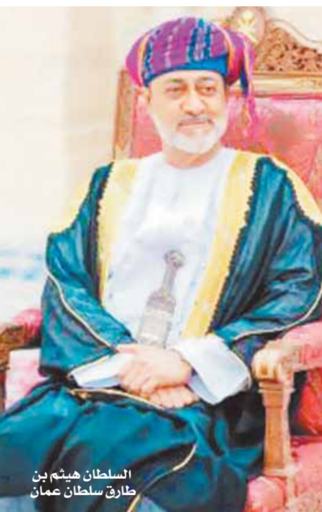
السلطان هيثم بن طارق سلطان عمان