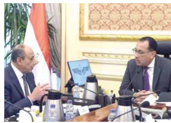
رئيس الوزراء خلال لقاء وزير الطيران لتوجيه الشكر للعاملين بالطيران المدني

على نفوس الوفود قبل مغادرتهم مصر. وبهذه المناسبة قدم الفريق محمد عباس الشكر والتقدير لجميع العاملين في مختلف مواقع العمل بمطاري القاهرة وشم الشيخ الدوليين على ما بذلوه من جهد كبير ومواصلة العمل بتفان وإخلاص من أجل تقديم أعلى جودة من الخدمات لضيوف مصر وتذليل كل العقبات أمام الوفود المشاركة بالمؤتمر بما يليق بمكانة الريادية التي تحظى بها مصر إقليمياً ودولياً، مشيداً بالتعاون والتنسيق الفعال بين جميع الجهات المعنية لتقديم كل التسهيلات لضيوف مصر، لافتاً أن هذا النجاح يعد إضافة جديدة لسلسلة الإنجازات والتجارات مصر الريادية ومكانتها الحضارية وقدرتها على تنظيم مثل هذه المؤتمرات والأحداث الدولية المهمة... وكان الفريق محمد عباس وزير الطيران المدني