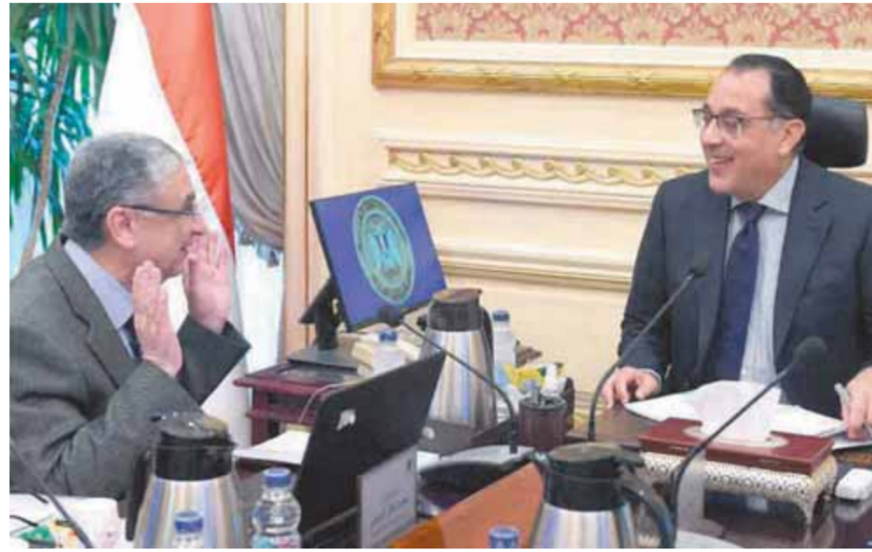
القدرات المركبة من الطاقات المتجددة ١٠٠٠٠ ميجاوات، وتناول الوزير الدراسات الخاصة بزيادة المساحات الإضافية لمشروعات طاقة الرياح، مشيراً في هذا الصدد إلى البيانات التحليلية للرياح على مستوى الجمهورية الموضحة من خلال برنامج أطلس الرياح العالمي، وما تم التوصل إليه من نتائج لتحديد عدد من المناطق والمساحات الإضافية لإنتاج الطاقة الكهربائية

من طاقة الرياح، والقدرات المتوقعة إنتاجها. واستعرض الوزير موقف العروض المقدمة من جانب عدد من الشركات العالمية المتخصصة لتنفيذ المزيد من مشروعات طاقة الرياح ذات قدرات كبيرة، لخفض استهلاك الغاز الطبيعي، وذلك تنفيذاً لتوجيهات الرئيس عبدالفتاح السيسي، رئيس الجمهورية، في هذا الصدد. وتناول الوزير الجدول الزمني لدخول قدرات ١٨ جيغاوات من طاقة الرياح، من خلال عدد من المشروعات التي تم توقيع اتفاقيات بشأنها على هامش مؤتمر المناخ (COP27)، حيث سيتم تنفيذها من جانب مجموعة من التحالفات العالمية، مشيراً كذلك إلى الاتفاقية التي تم توقيعها مؤخراً بالملكة العربية السعودية مع شركة «أكوا باور» لإنتاج ١٠ جيغاوات طاقة متجددة (شمس - رياح)، لافتاً في هذا الصدد إلى ما يتم من تسويق وتعاون مع عدد من الجهات المعنية، وخاصة المركز الوطني لتخطيط استخدامات أراضي الدولة، وذلك لتسريع تخصيص الأراضي اللازمة لتنفيذ الاتفاقيات التي تم توقيعها، وإتاحتها للشركات والتحالفات لبدء إجراء الدراسات والقياسات اللازمة لبدء تنفيذ المشروعات المتفق عليها. كما استعرض شاكور، خلال اللقاء، مستجدات مشروعات إنتاج الهيدروجين الأخضر، مشيراً إلى التعاون مع البنك الأوروبي لإعادة الإعمار والتنمية EBRD، لإعداد الاستراتيجية الوطنية للهيدروجين، وكذلك الجدول الزمني لإعدادها، موضحاً أنه تم الإعلان عن الإطار العام لمخرجات الاستراتيجية الوطنية للهيدروجين منخفض الكربون خلال مؤتمر المناخ (COP27)، ومن المتوقع إصدار الاستراتيجية بنهاية العام الجاري.