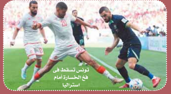
تونس تسقط في فخ الخسارة أمام استراليا

وتتطلع الأنظار بلا شك لمواجهة تكسير العظام بين منتخبي إسبانيا وألمانيا في ختام المجموعة الخامسة خاصة بعدما خسر منتخب ألمانيا على يد اليابان بنتيجة ١-٢ في مفاجأة مدوية بالجولة الأولى بينما اكتسح منتخب إسبانيا منافسه كوستاريكا بنتيجة ٧-٠. المنتخب الإسباني يطعم مدربه لويس إنريكي في تحقيق الفوز الثاني على التوالي وحسم التأهل بشكل رسمي عن هذه المجموعة، ويهاجم إنريكي على كتيبة نجومه بقيادة جافي ويديري والفارو موراتا وماركو أسينسيو وجوردي ألبا. ويتطلع منتخب ألمانيا بقيادة المدرب هانز فليك لتصحيح المسار سريعاً وتحقيق الفوز وتعويض الخسارة أمام اليابان بقيادة أبرز لاعبي الماكينات جمال موسيلا وتوماس مولر وكاي هافيرتز وسيرجي جنابري. وهي المجموعة ذاتها.