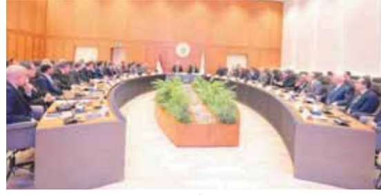
اجتماع المجلس الأعلى للجامعات أمس