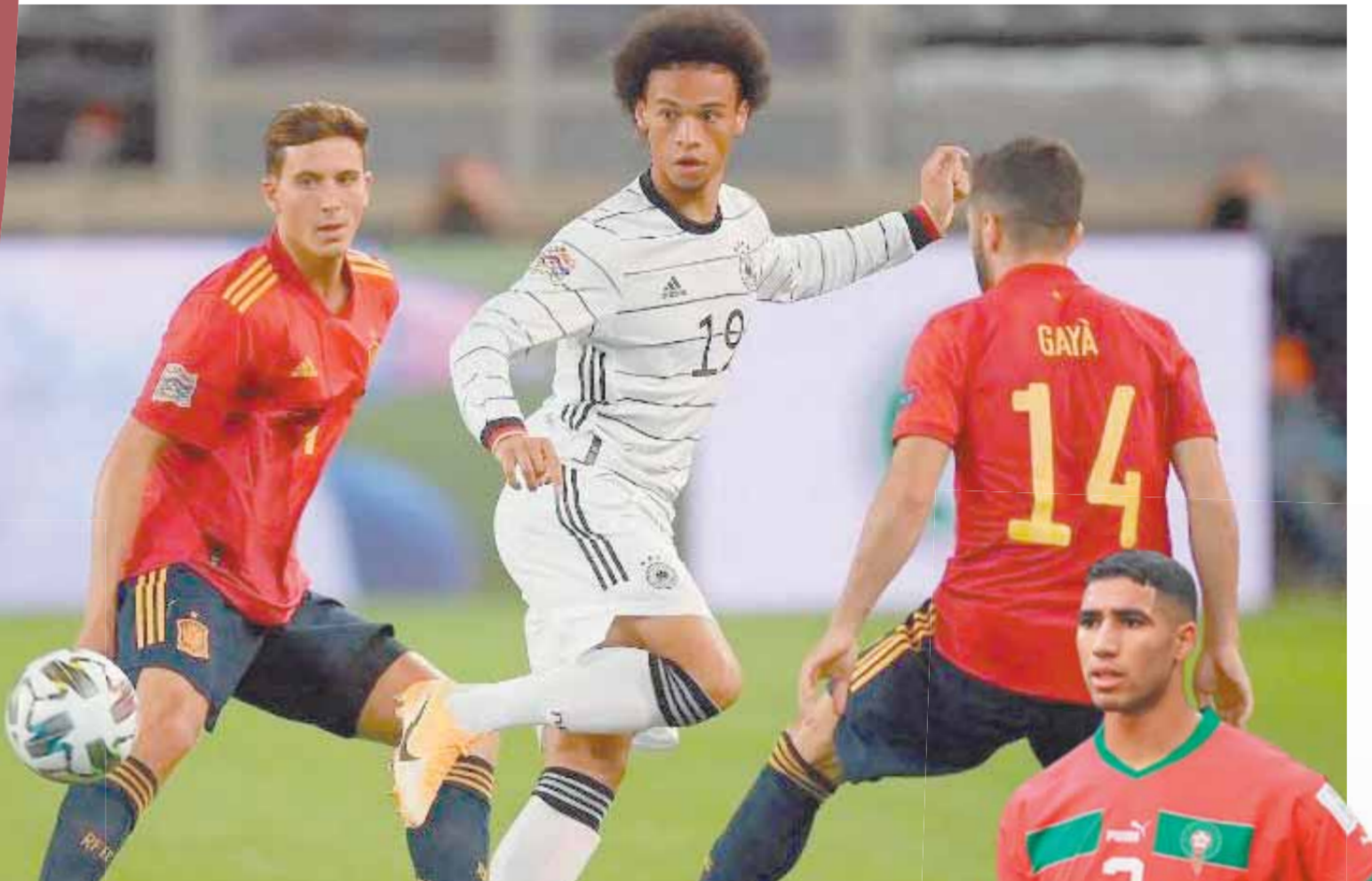
ألمانيا تسعى لتصحيح المسار أمام إسبانيا