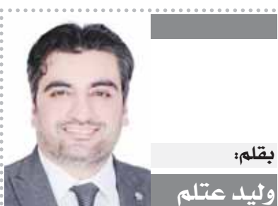
بقلم: وليد عتلم