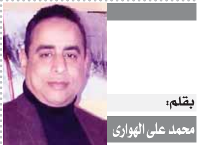
بقلم: محمد على الهوارى