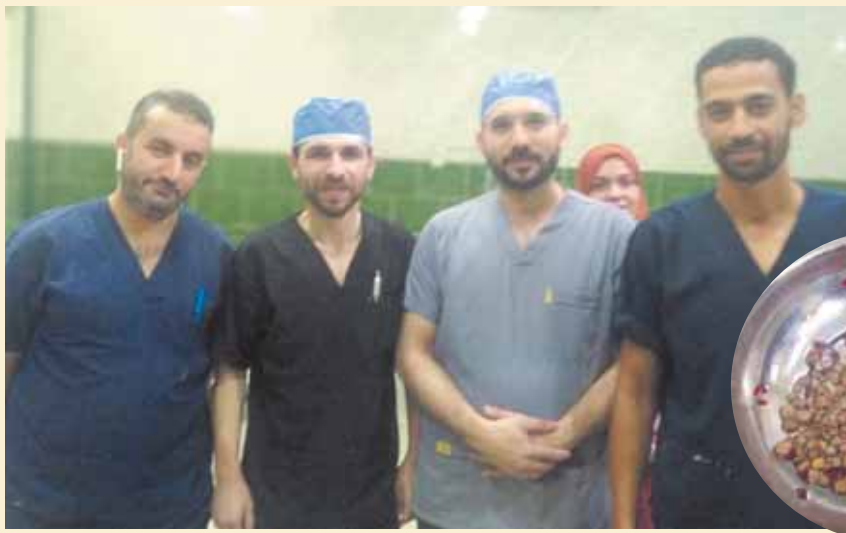
طاقم الطبي الذي قام بإجراء العملية