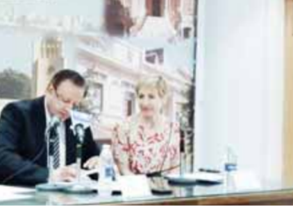
من خلالها على الدعم من الاتحاد الأوروبي، وقام بتنفيذها المجلس الأعلى للثقافة، حيث تم عمل أول بروتوكول.

تعمل أول بروتوكول. ثم انتقلت الكلمة لفريديريكا بيريا، مديرة قسم الثقافة في الشرق الأوسط وممثل اتحاد المراكز الثقافية الأوروبية، التي أكدت أهمية اتخاذ المجلس الأعلى للثقافة لهذه الخطوة من أجل تنمية وتطوير الكوادر الثقافية، وأضافت أن هذا التعاون سوف يرفع من كفاءة وخبرات المديرين العاملين بالقطاع الثقافى المصرى على مستوى كل الأقاليم، حيث سيبدأ البرنامج أولاً بمحافظة بورسعيد من أجل بناء مجتمع ثقافى واع ومبدع، وأضافت أن التعاون يستهدف العمل مع مديرى الفنون والثقافة وأصحاب المبادرات والمشاريع الثقافية من الشباب فى القطاع الثقافى الحكومى والأهلى لتدريب كل سبل الدعم والتمكين التى من شأنها ضمان استمرارية مشاريعهم، ويأتى التدريب تحت مظلة الاتحاد الأوروبي الذى يهدف إلى تقديم برنامج تدريبي على مستوى أكاديمي لتقديم كفاءات ثقافية محترفة.