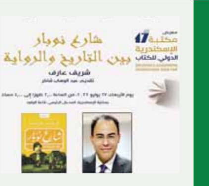
معرض مكتبة الإسكندرية الدولية للكتاب اليوم الأربعاء

وأوضح أن رواية «شارع نوبار» سيكون لها طابع فني خاص، حيث تتضمن مجموعة من الوثائق النادرة ومنشورات الثورة الأصلية المطبوعة في حينها، في إطار لوحة كاملة