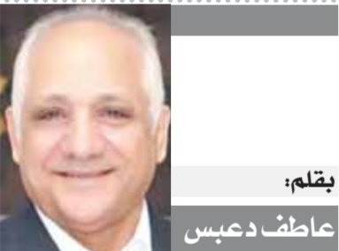
بقلم: عايف دعبس

وربما يكون الاتفاق بين موسكو وكييف على هذا الأمر بداية لاتفاق أوسع يطوق نيران الحرب بينهما، ويعد شبح حرب عالمية عن كوكب الأرض الذي ما كان يتفشى الصعداء من انحسار هجوم كورونا، حتى وجد نفسه واقفاً تحت وطأة ما هو أسوأ من كورونا بين روسيا وأوكرانيا!