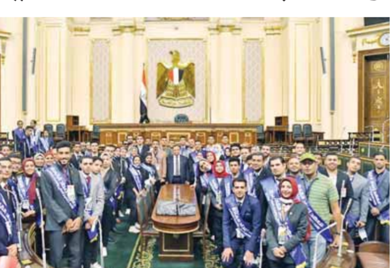
على تحمل المسؤولية واتخاذ القرارات الصحيحة لتحقيق أهداف التنمية المستدامة والإلمام بحقيقة الأحداث المختلفة من المتغيرات المحلية والإقليمية والدولية سواء كانت سياسية، اقتصادية، أو ثقافية، وأضاف الأمين العام لمجلس النواب أن القيادة السياسية أحدثت طفرة في ملف التأهيل والتمكين للشباب ودعم المرأة المصرية، مشيراً إلى أن البرلمان الحالي يضم نسبة متعددة من جميع فئات المجتمع خاصة الشباب والمرأة، وأوضح الأمين العام أن رئيس منتدى البرلمانين الشباب بالاتحاد البرلماني الدولي هي نائبة بمجلس النواب المصري، ثم شاهد وفد شباب الجامعات فيلماً تسجيلياً حول تاريخ الحياة البرلمانية، ومن جانبهم أعرب شباب الجامعات المصرية عن مدى سعادتهم بتواجدهم داخل مقر مجلس النواب المصري كأحد مؤسسات الدولة الدستورية العريقة، كما أشادوا بجهود الدولة لتمكين الشباب خلال السنوات الماضية ودعمهم في دوائر صنع القرار لخلق جيل مؤهل قادر على تولي القيادة في المستقبل وعلى تحمل المسؤولية الوطنية.