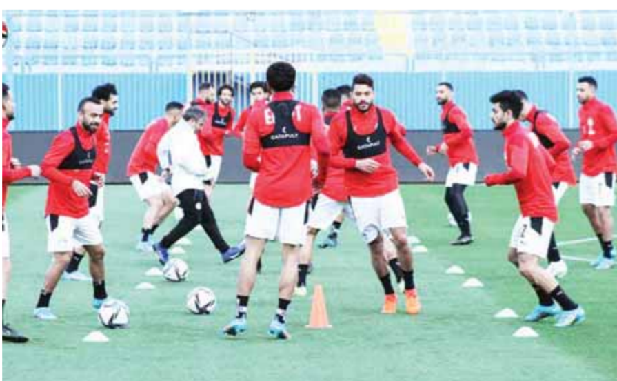
المنتخب ضحية التخطيط في المسابقات المحلية

وتشهد جلسة فيتوريا مع اتحاد الكرة ومعاقبه، حديثاً مهماً عن مستقبل المنافسات المحلية في مصر، حيث فوجئ بحالة الإرهاق الشديدة التي يعاني منها اللاعبين، خصوصاً لاعبي الأهلي والزمالك في مباراة القمة الأخيرة. على الجانب الآخر، مع مقارنة الوضع المزري الذي تمر به الكرة المصرية والضحية هو اللاعب والأجهزة الفنية والمنتخبات، تجد الأمر مختلفاً تماماً في الملاعب المحلية ودوري أبطال أوروبا ولا تعاني من أي إرهاق ومساقاتها منتظمة، مع الأخذ في العلم إقامة منافسات كأس الأمم الأوروبية الأخيرة والتي شهدت مستويات مرتفعة تعكس حالة الجاهزية البدنية والفنية للاعبين، بينما اللاعب المصري في خراب كان. وتتطلب المنافسات الأوروبية بدءاً من يوم ٥ أغسطس المقبل، بعد حصول جميع اللاعبين على فترة راحة لا تقل عن شهر ونصف الشهر، بخلاف بداية الأندية في إعداد اللاعبين في جولات عالمية بأمریکا والصين وخوض وديات، لتسير المنظمة بشكل طبيعي ومنتزح. وأصبح أعضاء اتحاد الكرة مجبرين على تغيير نظام الدوري في الموسم المقبل، من أجل إراحة اللاعبين وضبط المواعيد. من خلال إقامة المسابقة من دور واحد مع دورة تنوع ودورة هبوط، بحيث يوفر ذلك حوالي ٣ أشهر جديدة تريخ اللاعبين وتنتهي المسابقة في شهر مايو أو يونيو المقبلين. ويتمسك فيتوريا بهذا الأمر حتى يستطيع التراجع مع الجيل الحالي من اللاعبين، الذي أصبح منكمها وخارج الخدمة، ولا يعين أي جهاز فني على تطبيق فكره وتحقيق الأهداف المطلوبة في الفترة المقبلة. خصوصاً مع تراجع نتائج المنتخب في البطولات الأخيرة، ورغبة الجماهير في إعادة الكرة المصرية إلى مسارها الصحيح.