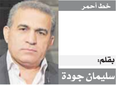
بقلم: سليمان جودة