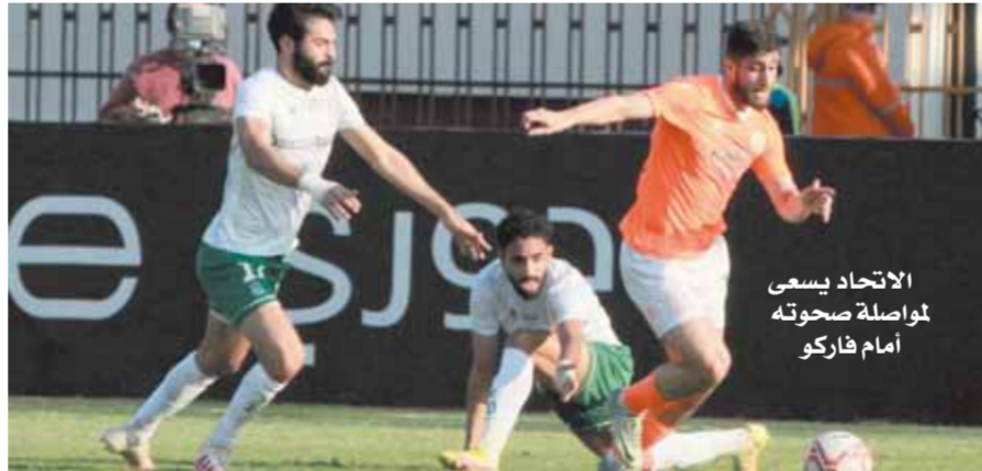
الاتحاد يسعى لمواصلة صحوته أمام فاركو