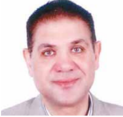
د... فرحات على فرحات

من أضرار الهاتف المحمول على العين بعد أن غدت الهواتف المحمولة والأجهزة الكهربية بكافة أنواعها جزءاً لا يتجزأ من الحياة اليومية، أصبح من غير الممكن الاستغناء عن استخدامها، ولكن يمكن التخفيف من أضرار الهاتف المحمول على العين والجسم باتباع النصائح الآتية: عدم استخدام الهاتف المحمول أو أى جهاز إلكترونى، مثل: أجهزة الحاسوب والأجهزة اللوحية بأنواعها لأكثر من ٢٠ دقيقة متواصلة، حيث يُنصح بالقيام بأى نشاط آخر لا يتطلب تركيز العين على أشياء قريبة لمدة ٢٠ ثانية على الأقل واستخدام نظارات الحماية من الضوء الأزرق عند استخدام الهاتف المحمول أو جهاز الحاسوب للتقليل من إرهاق العين الناتج عن الضوء الأزرق، كما أن لهذه النظارات دور في التقليل من اضطراب النوم الناتج عن استخدام الهواتف المحمولة ومحاولة إبعاد الهاتف المحمول عن العين أثناء استخدامه عن طريق إضافة إلى أضرار الهاتف المحمول على العين نتيجة الضوء الأزرق فقد يكون هناك أيضاً ضرر على خلايا الدماغ ينتج عن طاقة التردد الراديوي المستخدمة في الهواتف المحمولة، وعلى الرغم من عدم وجود دراسات تثبت تسبب الهواتف المحمولة بسرطان في الدماغ، فإن الحذر واجب فى التخفيف من استخدامها والحرص على اتباع نصائح الوقاية لعدم وجود دراسات طويلة المدى تثبت عكس ذلك. ومن الأضرار الأخرى التي قد يسببها استخدام الهاتف المحمول ما يأتي: حدوث ألم وتشنج فى عضلات الظهر والرقبة، صداع ناتج عن إجهاد العينين، وغشاش الرؤية، وحدوث جفاف شديد أو ما يعرف بالخلود للنوم. وينصح الدكتور فرحات على فرحات للتخفيف