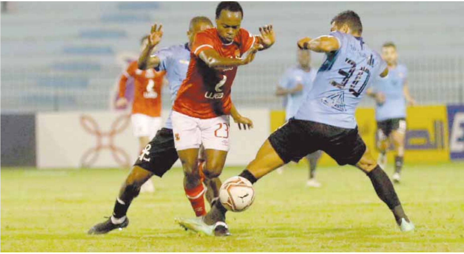
بيرسى تاو تعرض للإصابة

بكدمة في الركبة يغيب بسببها اسبوعا، وأخيرا غيابه لمدة شهر، وشارك تاو في ٢٧ مباراة مع الأهلي، نجح في تسجيل ٨ أهداف وصناعة ٦ أخرى.