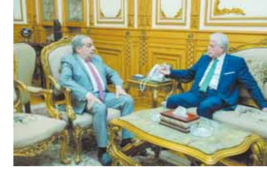
كتب - محمد صلاح وأبو زيد كمال:

استقبل المهندس محمد أحمد مرسى وزير الدولة للإنتاج الحربى اللواء خالد فودة محافظ جنوب سيناء، بديوان عام الوزارة لتتبع الإجراءات التنفيذية لأعمال الحديقة المركزية بمدينة شرم الشيخ في إطار الاستعداد لاستضافة مصر لمؤتمر الدول الأطراف في اتفاقية الأمم المتحدة الإطارية بشأن تغير المناخ (COP٢٧)، في شهر نوفمبر المقبل. وقال فودة أنه يتم تنفيذ الحديقة المركزية بمدينة شرم الشيخ بملحقاتها «هايد بارك ومركز تسوق عالمي ومجمع البنوك» على مساحة ١١٠ آلاف متر مربع في منطقة حي النور بجوار مجلس المدينة الجديد وتتضمن أحد المتنزهات الحيوية والتي تعكس الوجه الحضارى للمدينة وتسهم في تحويلها إلى مدينة خضراء بيئية عالمية بالإضافة إلى كونها وجهة ثقافية ترفيهية لكافة الرواد من كافة الأجناس والأعمار حيث ستحتوى الحديقة على العديد من الأنشطة الحيوية والخدمية التي تخدم أهالي ورواد المدينة ومنها (مول تجارى، سلسلة بنوك، حضانات، مطاعم متميزة، مسرح مكشوف، أماكن جلوس، حدائق فواكه مثمرة، مساحات مكشوفة، خدمات لرواد شرم الشيخ، دورات مياه عمومية، نظام صوتي كامل بالحديقة، نافورات وبحيرات مائية).