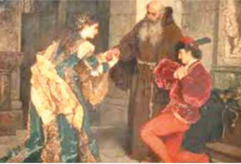
روميوجولييت انتحرا ولم يقتلها

«الحب زمان غير دلوقتي» كلمات نظمها الشاعر فتحي قفورة وتغنى بها الفنان الراحل محمد فوزي وصباح في فيلم «الأنسة ماما» عام ١٩٥٠، تعد الآن أبلغ تعبير عما وصل إليه حال الحب والمحبين، فقصص الحب التي خلفها التاريخ سواء عربي أو عالمياً مختلفة تماماً عما نسمع عنه الآن، فأشهر كلاسيكيات قصص الحب كانت تدور حول التضحية ولو بالنفس في سبيل المحبوب، ففي رابعة الكاتب الإنجليزي وليام شكسبير ضحى الحبيب روميو بحياته اعتقاداً منه أن جولييت تناولت السم مفضلة الموت على فراق حبيبها، فتناول هو أيضا السم ليلاحق بها، وبعد أن أفادت جولييت من لعنتها واكتشفت وفاة حبيبها قفلت نفسها بخنجره ليلتقيها في الحياة الأخرى.