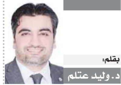
بقلم: د. وليد عتلم

دمشق في حاجة إلى إجماع شعبي سورى على الخروج من الأزمة التي تدخل عامها الرابع عشر.. أزمة أفتتها القبر وكانت ضحيتها ملايين المجرمين واللاجئين من أبناء هذا الوطن العظيم. نريد إرادة عربية قوية.. نريد أن يتنازل جميع الأطراف في سوريا عن تشدهم نريد أن نصل إلى حل يعيد لم شمل الشعب السوري من الشتات.. نريد ان تعود حركة الاقتصاد التي كانت في قمة ازدهارها قبل الأحداث نريد من جيران العرب وسوريا ان يرفعوا أيديهم عنها ويتروكوا أمرها لابنائها هم اولى بحل خلافاتهم بدون تحويز أو تحويف. نريد ان تعود سوريا القوية الموحدة نريد ان تعود تنسج في شوارع دمشق وشقق طعمرها كما كانت شاعرها نزار قباني في مقال طويل بعنوان «أرنا الديمقراطية» قائلا: «هل تعرفون معنى أن يسكن الإنسان في قارورة عطرة بيتا كان تلك القارورة، إننى لا أحاول رشوكم بتشبيه بلبع، ولكن تقوا أنسى بهذا التشبيه لا أظلم قارورة العطر، وإنما أظلم دارنا، والذين سكبوا دمشق، وتغلغلو في حاراتها وزوايرها الضيقة، ويعرفون كيف تنفتح لهم الجنة ذراعها من حيث لا ينتظرون.. هذه هي دمشق لمن لا يعرف قيمة هذه العاصمة العربية الأبية.