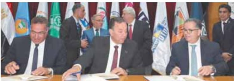
الدكتور يحيى المشد يوقع بروتوكول إقليم الدلتا

كرم الدكتور أيمن عاشور، وزير التعليم العالى والبحث العلمى، الدكتور محمد ربيع ناصر، رئيس مجلس أمناء جامعة الدلتا للعلوم والتكنولوجيا خلال احتفالية جامعة المنصورة بإنجاز إجراء ١٠٠٠ عملية زراعة كبد، وذلك منذ تأسيس البرنامج فى مايو ٢٠٠٤، محققاً نسبة نجاح قياسية تتراوح بين ٨٨% إلى ٩٢% ليعتزل برنامج زراعة الكبد بالجامعة المرتبة الثالثة عالمياً بعد كوريا الجنوبية والهند، يأتى تكريم الدكتور محمد ربيع ناصر تقديرًا لإسهاماته المجتمعية والدعم