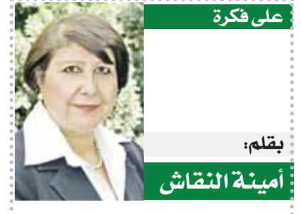
بقلم: أمينة النقاش