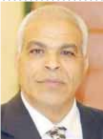
بقلم: محمود غلاب

حصلت المرأة على مكانة كبيرة فى عهد الرئيس السيسى تقديراً لدورها العظيم فى الحفاظ على هوية الوطن خلال ثورة ٣٠ يونيو، وجودها فى نجاح الإصلاح الاقتصادى عندما تقمصت كل امرأة مصرية فى بيتها دور وزير المالية ووزير التخطيط لضبط نفقات الأسرة فى ضوء الإيرادات والمصروفات حتى مرت الأزمة بسلام. المرأة المصرية هى أم الشهيد التى قدمت أبنائها للوطن الذين تلقوا طلائع الغدر من الإرهابيين فى صدهم ليهبوا الحياة لوطى الشعب، وهى أيضاً زوجة الشهيد وابنة الشهيد، التى تحولت إلى رمز للعطاء والتفانى والتضحية المتجردة من أية مصلحة.