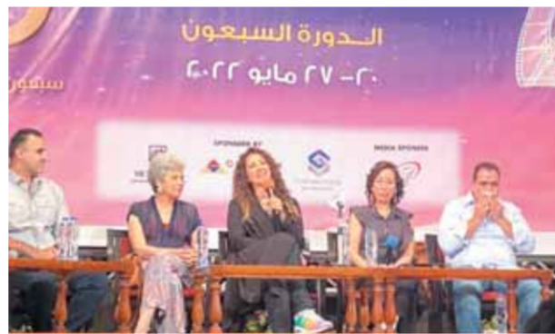
جانب من فعاليات الدورة