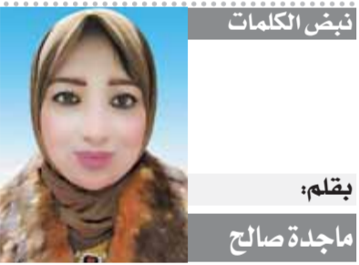
بقلم: ماجدة صالح