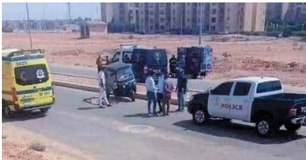
الشرطة تعالين مسرح الجريمة

وأضافت أنها كانت تدافع عن شرفها، ولم تكن تقصد قتله، وتم الاحتفاظ على الفتاة المتهمه، وجرى اتخاذ كل الإجراءات القانونية اللازمة حيال الواقعة، والعرض على النيابة العامة لمباشرة التحقيقات.