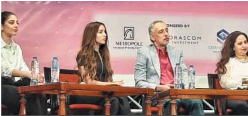
جانب من المشاركين في ختام الدورة الـ ٧٠ لمهرجان المركز الكاثوليكي للسينما