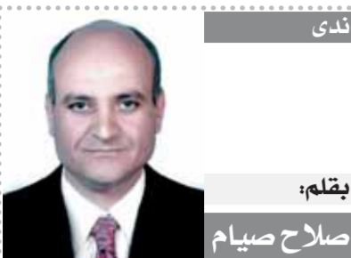
بقلم: صلاح صيام

الحمرام بشكل رسمى بأية توزيع تذاكر مباراة نهائى دورى أبطال أفريقيا. وأوضح أن الكاف قرر تطبيق النظام الأوروبى فى توزيع التذاكر بمنح كل فريق ١٠ تذاكر مع الاحتفاظ بنسبة ٥٪ للزراعة وشركاء الكاف ٢٠٪ ما وصفه بالجمهور العام مثمناً يحدث فى البطولات الأوربية. وأشار إلى أن الكاف تأخر فى تحديد هذه الأمور وهو ما يؤثر على ترتيبات الأهلى لإطلاق الرحلات الجماهيرية للمغرب موضحاً أن مسألة الجمهور العام غير واضحة وربما تعطل الفرصة لدخول جماهير أكبر للوداد.