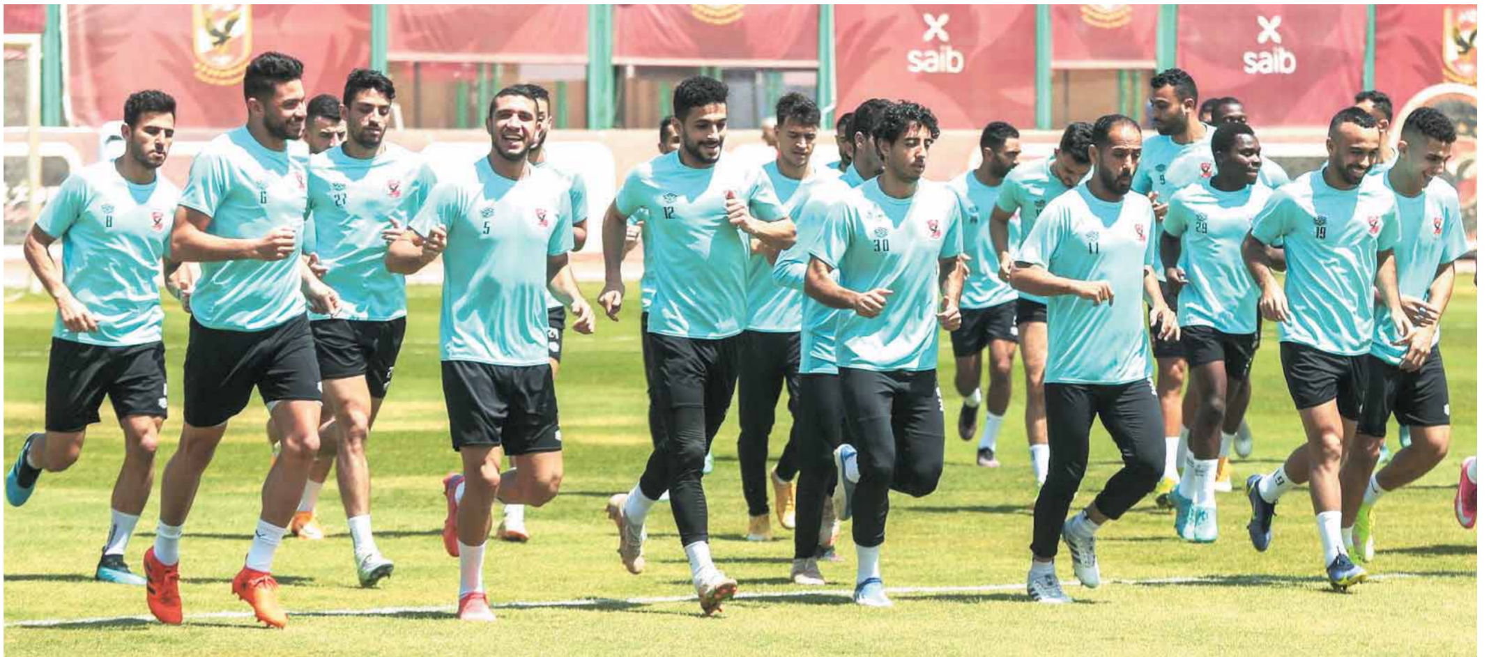
الأهلى يستعد بقوة لمواجهة الوداد