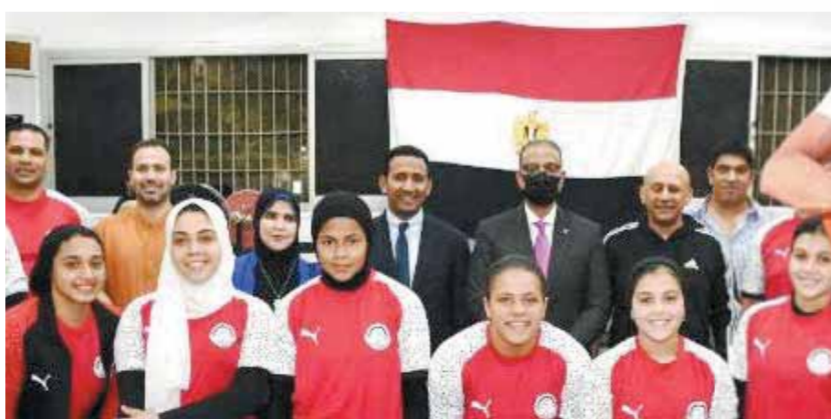
محافظ الفيوم مع لاعبي الانقزال