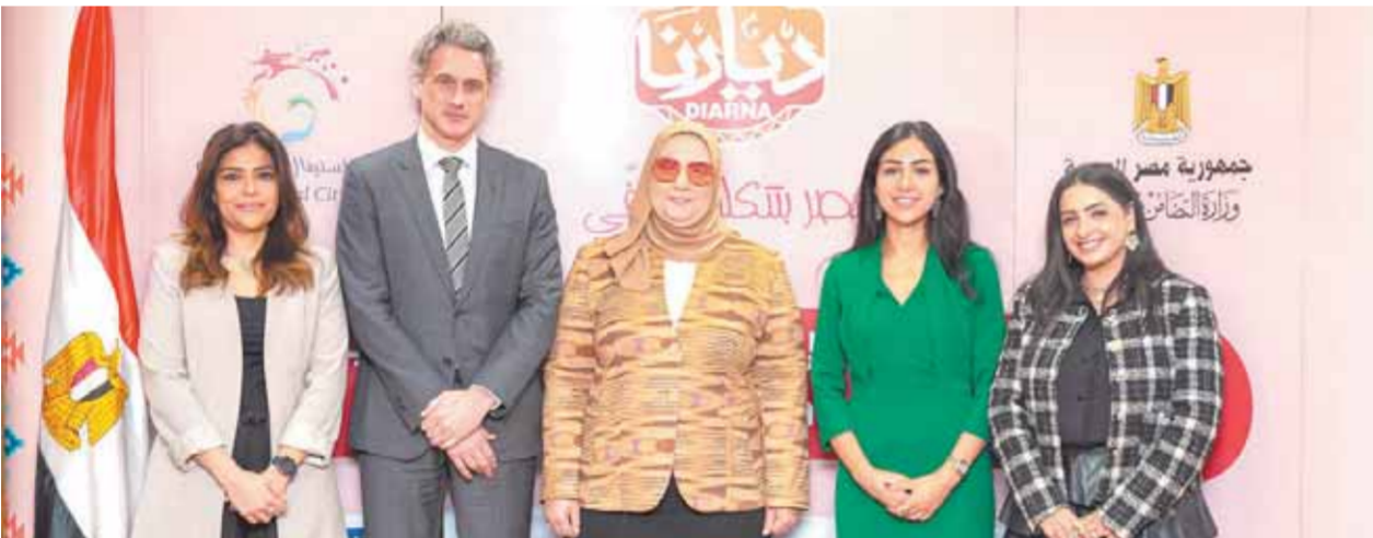
نفيين القباж تتوسط الداعمين لمعرض ديارنا للحرف اليدوية