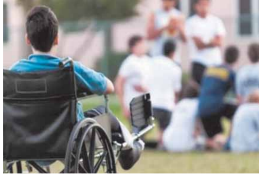
الإعاقة لن تمنعك من الوصول للبنك

إنهاء حصولهم على الخدمات المصرفية، كما تم توفير شاشات ناطقة مترجمة بلغة الإشارة لعرض شروط وأحكام المنتجات المصرفية داخل الفروع وعلى الموقع الإلكتروني لكل بنك وعلى صفحات مواقع التواصل الاجتماعي الخاصة بالبنوك. ووفرت البنوك أكثر من ٤ آلاف ماكينة صراف آلي مجهزة بإضاءة ملائمة وأرقام بارزة وهفا لطريقة برايل للتيسير على المكفوفين وضعاف البصر، وأطلقت برامج خاصة لتحفيز وتشجيع ذوي الهمم على الاستفادة من المنتجات المصرفية المختلفة مثل القروض وبطاقات الخصم مثل بطاقة «ميزة» وبطاقات الائتمان ويطرق تاسيهم. ما قامت العديد من البنوك بإتاحة متابعة الحسابات عن طريق الاتصال الهاتفي بعد كل معاملة، وتوفير كشوف الحسابات بما يتسق مع متطلبات ذوي الهمم ومنها على سبيل المثال الطباعة بلغة برايل أو على شكل Audio CD، وتحديث الإجراءات والنظم لقبول الأختام والبصمة كبديل للتوقيع على كافة الإجراءات البنكية، وتوفير إمكانية قيام موظفو البنوك بزيارات منزلية لذوى الهمم لإيجاز خدماتهم المصرفية.