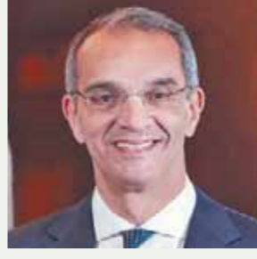
د. عمرو طلعت

كتب- جهاد عبدالمنعم ومئة الله جمال: بدأت أمس في مدينة برشلونة وعلى مدار ثلاثة أيام فعاليات المعرض والمؤتمر الدولي للهواتف المحمولة MWC 2023؛ الذي يعد الحدث السنوي العالمي الأبرز لصناعات الهاتف المحمول والصناعات المتعلقة بها على مستوى العالم الذي تنظمه الجمعية الدولية لشبكات الهاتف المحمول GSM، ويشارك فيه أكثر من ٨٠ ألف شخص.