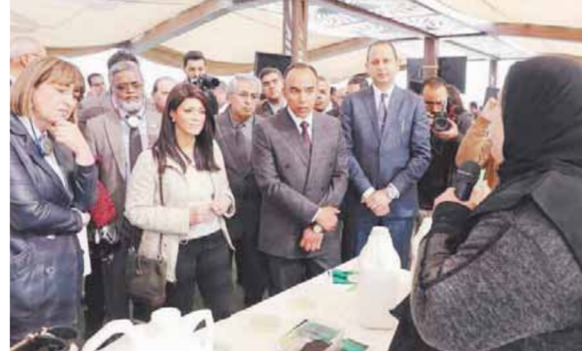
مشاركة السيدات في مشروع «رابحة» لتمكين الاقتصادي للمرأة البسيطة

تفقدت الدكتورة رانيا المشاط، وزيرة التعاون الدولي، وإيلينا بانوفا، المنسق المقيم لمكتب الأمم المتحدة في مصر، برافقهما الدكتور محمد أبو زيد نائب اللواء أسامة القاضي محافظ المنيا، المعرض المقام ضمن مشروع التمكين الاقتصادي للمرأة من أجل نمو شامل ومستدام في مصر (رابحة)، كما تابعتم الوزيرة ومرافقتها تجارب عدد من المشاركين في المشروع والتقت بعدد من رائدات الأعمال، اللاتي يلقين خدمات التوظيف من المشروع وكيفية تطوير وتنمية مشروعاتها، إطار زيارة الوزيرة محافظة المنيا، لتتقد عددهن في إطار مشروع «رابحة» وتمكين المرأة الاقتصادية البسيطة، وذلك على ضوء باحثات عن عمل. وفي نهاية الزيارة عقدت الوزيرة والمنسق المقيم مكتب الأمم المتحدة في مصر، ونائب محافظ المنيا، مؤتمرا صحفيا للرد على كافة الاستفسارات بحضور الشركاء الدوليين من كافة المؤسسات.