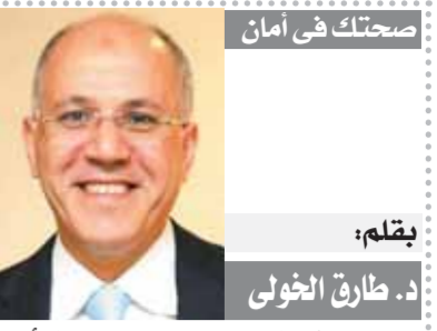
صحتك في أمان

ترجع مصادر التاريخ المسيحي هذه المناسبة إلى ما قبل ميلاد السيد المسيح، وتعود إلى نبي الله موسى، إذ كان عليه السلام يصوم ٤٠ يوما كما ورد في سفر (خر ١٨ : ٢٤) وهو ينسب إلى فترة تسليم لوح الحجر لكلمة الله، وكان هذا الطقس