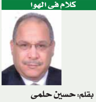
بقلم: حسين حلمي

لمزيد من الأخبار والتقارير المصورة ALWAFD.NEWS