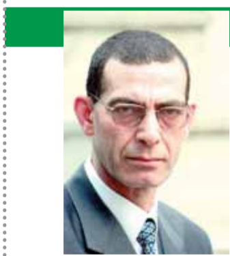
بقلم: د. وجدى زين الدين