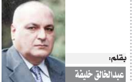
بقلم: عبد الخالق خليفة

نتمن جهود الدعم الفني والخدمات الاستشارية لإعادة تصميم الطرق الجوية