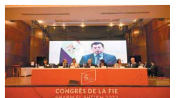
كتبت - شيرين عجمي:

أشاد المجلس القومي للمرأة برئاسة الدكتورة مايا مرسى وجميع عضواته وأعضائه، بمبادرة جديدة بعنوان «شباب من أجل إحياء الإنسانية»، والتي أعلنت إدارة منتدى شباب العالم عن إطلاقها وذلك انطلاقاً من الدور المحوري الذي يلعبه منتدى شباب العالم، في نشر مبادئ السلام والتنمية والإبداع، والتي تنطلق على مدار ٣ أيام في مدينة شرم الشيخ. تأتي المبادرة بهدف توحيد الجهود الدولية والشبابية في مواجهة التحديات وتعزيز المساعي نحو تحقيق السلام العالمي، وسعياً لترسيخ القواعد البناءة في وجدان، بداية من حماية ضحايا الحروب والنزاعات في كل مكان دون النظر لعرق أو جنس أو دين، وصولاً إلى تحقيق السلام والعدالة في دول العالم. كما يأتي ذلك في إطار حرص منتدى شباب العالم على تقديم الدعم وإحلال السلام في كافة أرجاء العالم، وإيماناً منه أنه أن للسلام أن ينال استحسانه وأن للحرب أن تضع أوزارها. وتدعم مبادرة «شباب من أجل إحياء الإنسانية» بين التأثير والدعم الإنساني والجهود السياسية والاقتصادية والاجتماعية لتعزيز الأمان والسلام وحماية المدنيين في مناطق النزاع.