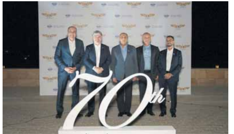
وزير الطيران ورئيس سلطة الطيران ومدنوب مصر بالإيكو خلال الاحتفال