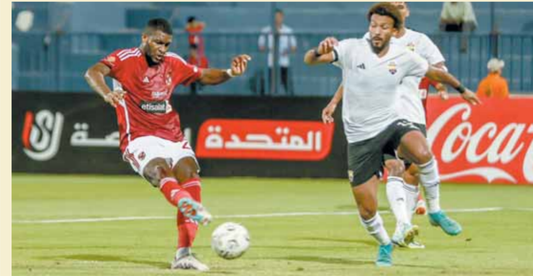
موديست يشكو الإصابة في العضة الضامة

ويستأنف الفريق تدريباته اليوم الأحد دون راحة استعداداً لمواجهة سموحة خاصة في ظل ضيق الوقت بين اللقاين، ويؤدي اللاعبون الذين شاركوا في لقاء ميدياما أمس السبت تدريبات استثنائية لتجنب الإجهاد. وطلب كولر من معاونيه تجهيز