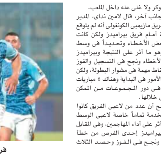
فرحة لاعبي بيراميدز بهدف الفوز