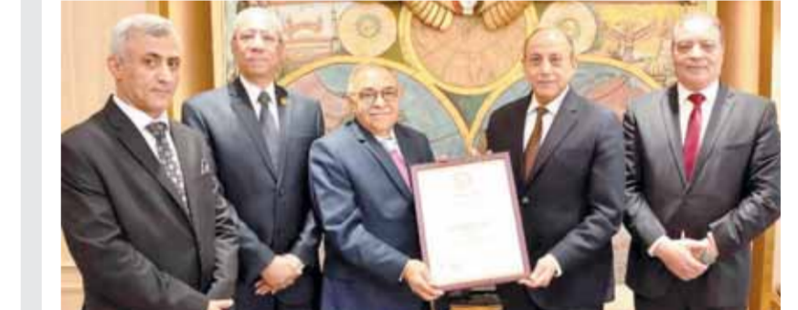
وزير الطيران خلال تسلم شهادات الأيزو الدولية في مجالات التدريب والتعليم