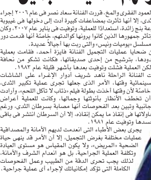
«عشق الجسد فاني»