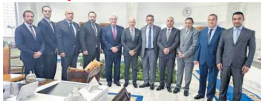
رؤساء مجالس إدارات مصر للطيران مع وفد شركة GHS الأمريكية بعد التقييم