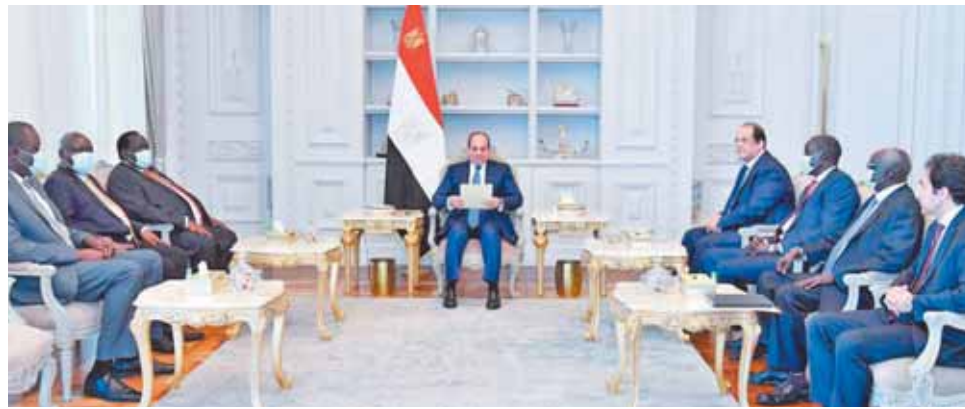
تضمن تحقيق النجاح واستدامته وتفتح آفاق التعاون كما أكد الرئيس عزم مصر على تعزيز التعاون الثنائي لتحقيق التنمية بمختلف أركانها. التخطيط العمراني، والبنية الأساسية، والطرق