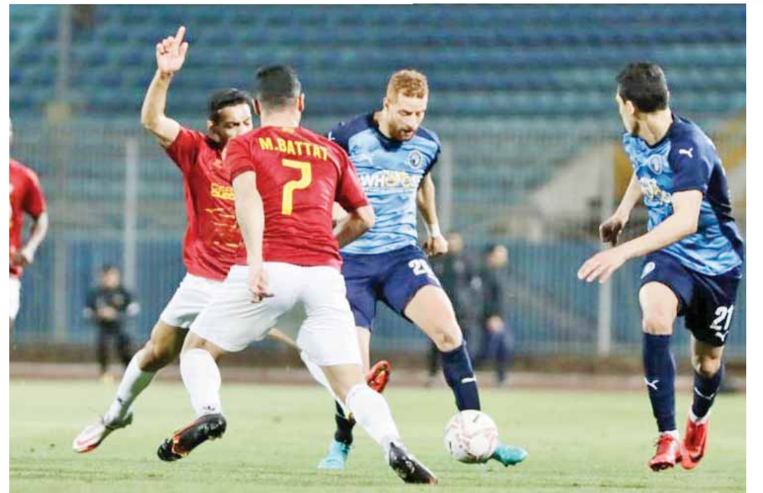
بيراميدز يسعى للفوز على سيراميك