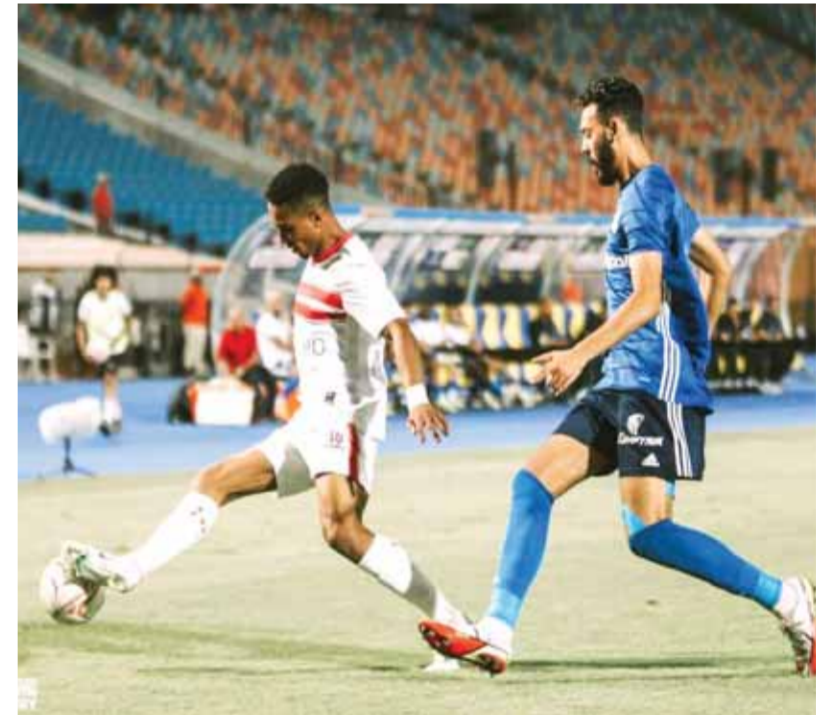
الزمالك نجح فى الفوز على سموحة والاستمرار فى الصدارة