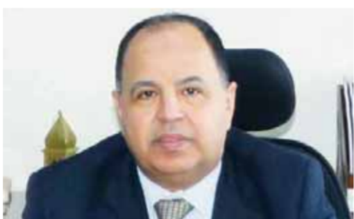
د. محمد معيط

أكد الدكتور محمد معيط، وزير المالية، أن اختيار القاهرة لعقد هذه الاجتماعات التي يشارك في أعمالها ممثلو ٤٢ دولة إفريقية يأتي انعكاسا لمكانة مصر لدى الدول الإفريقية ودورها الداعم للقضايا الإفريقية الاقتصادية والسياسية والثقافية بجانب سعي الحكومة المصرية لتعزيز وتدعيم العلاقات المصرية الإفريقية. وأوضح الوزير أن الأزمة العالمية الراهنة بجانب ما أسفرت عنه من تحديات، أوجدت أيضا فرصا لتعميق التعاون الإفريقي في العديد من المجالات خاصة الاقتصادية حيث تعاني معظم الدول الإفريقية من ضعف مستويات الأداخ والاستثمار المحلي، وبالتالي تحتاج للمزيد من الاستثمارات الخارجية المباشرة وغير المباشرة من أجل تحقيق التنمية الاقتصادية التي تصبو إليها الشعوب الإفريقية، وهو ما يمكن للشركة الإفريقية لإعادة التأمين أن تلعب دورا مهما في تحقيقه عبر استثماراتها المباشرة، وأيضا خدماتها في مجال إعادة التأمين، خاصة أنها تنتشر في جميع الدول الإفريقية وتوفر مظلة جيمة لجميع شركات التأمين العاملة بالسوق الإفريقي، لافتا إلى أن الشركة الإفريقية لإعادة التأمين تعد الأكبر في إفريقيا