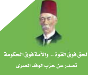
الحق فوق القوة... والأمانة فوق الحكومة تصدر عن حزب الوفد المصري