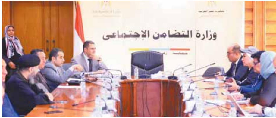
الجهات العاملة في هذا المجال، واقتراح نقل تبعية اللجنة الوطنية، لتكون تحت رئاسة مجلس الوزراء على أن تتولى بالإضافة إلى اختصاصاتها مكافحة ظاهرة

كما تم الاتفاق على قيام وزارة العدل بدراسة وتقليص العقوبة على من يستغل حاجة الفارين والغرامات لا يتجاوزهم بشئ السبل، ودراسة إجراء تعديل تشريعي يجرم طرفي التوقيع على بياض وينفي قانونية إيصال الأمانة الموقع على بياض وعدم اعتباره صكاً قانونياً للمديونية لانتهاء قدرة الدائن على الدفع به أمام القضاء، تنفيذاً للتوجيهات الرئاسية، بالإضافة إلى ضرورة دراسة سن تشريع لتحويل العقوبة بحسب الغرام إلى خدمة مدنية بدون مقابل أو بمقابل بسيط حتى لا يعود في بوتقة الغرم مرة أخرى، كما تمت التوصية أيضاً بضرورة التنسيق مع جهاز تنمية المشروعات الصغيرة والمتناهية الصغر بالتعاون مع بنك ناصر الاجتماعي لتوفير التمكين الاقتصادي للفارين بكافة أشكاله.