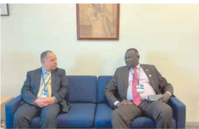
د. محمد معيط خلال اجتماعه مع وزير المالية في جنوب السودان

الضرائب على نحو دقيق يراعى الخصوصية الفنية لكل ضريبة، ويعكس ما تضمنه قانون الإجراءات الضريبية الموحد من حقوق والتزامات على الممولين أو المكلفين، الذي يعتبر نقلة تشريعية غير مسبوقة. أشار الوزير إلى أن هناك دراسة أجريت بالتعاون مع البنك الدولي، سجلت نجاحاً في خفض متوسط زمن الإفراج الجمركي بنحو ٥٠٪ بعد تطبيق المنصة الإلكترونية الموحدة للتجارة القومية «النافذة الواحدة» التي تربط كل الموانئ إلكترونياً، حيث تم استحداث المراكز اللوجستية للخدمات الجمركية، ونظام التسجيل المسبق للشحنات «ACI»، بالموانئ البحرية، الذي سبقنا تطبيقه العديد من دول العالم، وسيتم إطلاقه تجريبياً بالموانئ الجوية في ١٥ مايو المقبل.