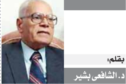
بقلم: د. الشافعي بشير