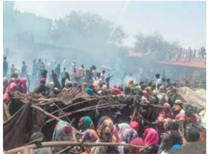
جانب من الاشتباكات القبلية بدارفور

على غرار الأزمة الأوكرانية التي تعانى منها أوكرانيا أمام القوات الروسية التي دخلت شهرها الثالث وما أحدثته توترات حول العالم، يعود نزاع جزر الكوريل بين اليابان وروسيا إلى الواجهة من جديد، حيث وضفت اليابان الجزر الأربع المتنازع عليها ملكيتها مع موسكو بأنها محتلة بشكل غير قانوني من قبل روسيا. وفي أحدث نسخة من تقرير دبلوماسي سنوى صدر الكتاب الأزرق للدبلوماسية لعام ٢٠٢٢ من قبل وزارة الخارجية اليابانية، وأكد أن الأراضي الشمالية هي جزر تخضع لسيادة اليابان، وجزء لا يتجزأ من أراضيها، وتخضع الآن لاحتلال غير قانوني من روسيا. ورد الناطق باسم الكرملين ديميتري بيسكوف على الخطوة اليابانية، وقال إن كل الجزر الأربع في جنوب أرخبيل الكوريل على الحدود مع اليابان ستبقى جزءاً لا يتجزأ من أراضي روسيا، ويتخوف مراقبون من أن يقود التصعيد المتبادل بين الطرفين نحو تصعيد أزمة خطيرة أخرى على هامش الأزمة الأوكرانية، كونها قضية خلافية حادة تعد من أبرز ملفات الحرب العالمية الثانية التي بقيت عالقة، ولم تنته بعد منذ نحو ٨ عقود.