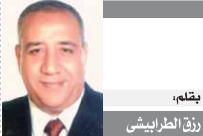
بقلم: رفاق الطرايشي

وحب مصر يتوزع في قلب المصري بين القري والمدن التي عاش فيها كما عاشنا مع أمننا المتصورة في مدينة المنصورة الجميلة وقضينا فيها طفولة سعيدة حتى شاء ربنا سبحانه وتعالى أن تشأ بها جامعة وكلية الحقوق تدعونا للتدريس بها في السبعينات، حيث نذهب إليها من الإسكندرية كل أسبوع للتعايش مع الأهل والأحبة المصريين ولتلقى محاضراتنا يومين أو ثلاثة ونجدد ذكرياتنا السعيدة مع نهر النيل الجميل ثم نعود للإسكندرية حينما الكبير التي نشأتنا إليها مثلما نشأتنا للمنصورة عندما تغيب عنها ويتردد في وجداننا الكلام الجميل للفنان الذي يطربنا بأغنيته الدينية في حب آل البيت قاتلاً (ساكن في حي السيدة وحبيبي ساكن في الحسين وعشان أتول كل الرضا يوماتي أزوح له مرتين من السيدة لسيدنا الحسين) وهو حب يتجدد في أيام وليال رمضان التي تسهر فيها مع تواشيع كبار المشندين الإسلاميين أمثال الشيخ التقشبي والشيخ نصر الدين طوبار وتزوجهما ترتيل القرآن الكريم بصوت الشيخ محمد رفعت وصوت الشيخ عبدالباقى عبدالصمد ونحن نتمتع بمشاهدة ملايين المسلمين وهم يطوفون كل ليلة حول الكعبة المشرفة ونسهر معهم حتى صلاة الفجر كل ليلة من ليالي رمضان المباركة أعادها الله عليكم باليسر والسعادة والبركات وكل عام وأنتم بخير.