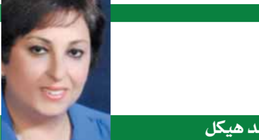
بقلم: سامى أبو العز

من المقرر أن تنقل قناة أون تايه سبورتس المصرية، هذه المباراة المرتقبة على الهواء مباشرة فى وجود استوديو تحلىلى يضم كوكبة من نجوم الكرة المصرية.