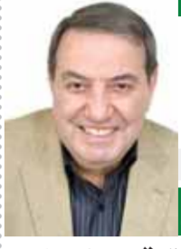
بقلم: عبد العظيم الباسل

بعد ارتفاع أسعار البنزين والسيارات والبطوناجا دفعة واحدة، بدأ الكلل يتسائل عن سبب ارتفاعها فى هذا التوقيت الذى يموج بالمشكلات والأزمات. وإذا كانت زيادة أسعار الوقود ضرورة لارتفاع سعر البترول عالميا وزيادة تولون النقل والشحن عبر الموانئ المضطربة بالبحر الأحمر مما حمل الفائتة الاستيرادية للوقود، اعياء جديدة ضغطت بدورها على الموازنة العامة فصار دعم الوقود على الأقل ١٢٧ مليار جنيه، فى وقت باتت معظم الدول تتخفف من هذا الدعم.