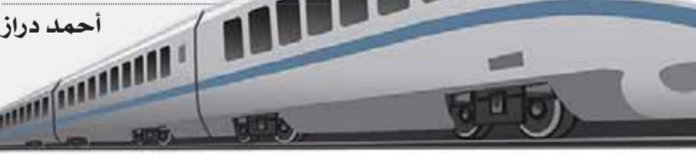
سيد العبيدي أحمد دراز