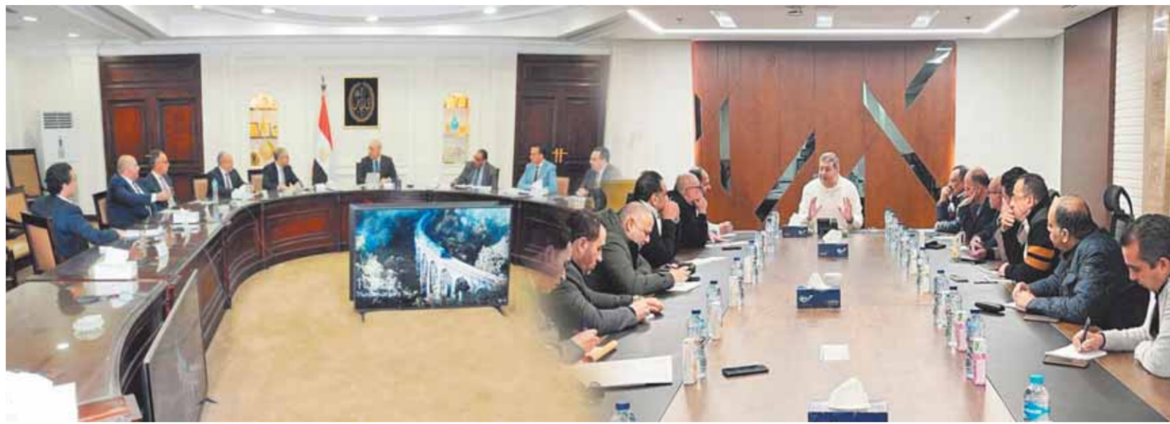
كليات عقارية تسابق الزمن لتتخيل الأزمة ووضع العلاج

احتساب أى فوائد - ٢- إرجاء سداد الأقساط والفوائد على الأراضي لمدة زمنية توازي المهلة الممنوحة لتنفيذ المشروعات لجميع الأقساط المتبقية. - ٣- انضمام القطاع العقاري لمبادرة الحكومة والمخصصة لدعم الصناعة المصرية بتحويلات ١٥٠ مليار جنيه وبفائدة ١١٪ مدعمة من الدولة المصرية. - ٤- طرح الأرض الجديدة بأقساط على فترات زمنية طويلة تصل إلى ١٠ سنوات، بحيث يكون سداد فوائد الأقساط من العام الأول، ولكن يبدأ سداد قسط الأرض نفسها من العام الرابع لتنفيذ المشروع. وذلك أسوة بما تم سابقاً ولافي نجاحاً. - ٥- القاء العاجل مع محافظ البنك المركزي لمناقشة الوضع الراهن لملف التمويل العقاري باعتباره حلاً عاجلاً وضرورة ملحة أمام شركات التطوير العقاري للحفاظ على المبيعات وسد الفجوة بين أسعار البيع والقدرة الشرائية للعملاء، والتأكيد على تبني فلسفة أن تكون الوحدة ضامنة للتمويل العقاري وليس القدرة الائتمانية للمعلم. ٦- العمل بكامل الجهود المتاحة للتوسع في ملف تصدير العقار، وذلك لتوفير عملة صعبة للدولة، وكذلك الاستفادة من التميز السعري للعقار المصري أمام المقارنات المنافسة في المنطقة، والحفاظ على مبيعات الشركات العقارية، مع طرح التحديات أمام الحكومة للتوسع في هذا الملف، مع ضرورة النظر في الرجوع لنسبة ٧٥٪ حتى يتمكن المطور من عمل مراحل دون إخلال يؤدي لخسائر له. ٧- اعتبار المشروع العقاري منتهياً في حالة تنفيذ نسبة ٩٠٪ وعدم مطالبة المطورين بأي فروق مالية وهو مطلب سبق تقديمه بمعرفة المهندس طارق شكري، رئيس غرفة التطوير العقاري، وجر إنفاؤه.