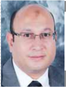
رسالة حب بقلم: فتوح الشاذلي

وحديقة الأورمان أو المتحف الزراعي. وأدى بعض خبراء التسويق الحضاري تخوفهم من تأثير تطوير الحديقة على المباني الأثرية والأشجار النادرة وأوضحوا أنه يجب الرجوع للمتخصصين أثناء فترة التطوير للحفاظ على سلامة المنشآت والمساحات الخضراء. قال الدكتور عاطف كامل خبير الحياة البرية الدولي، بأن حديقة الحيوان بمحافظة الجيزة تأسست عام ١٩٨١ وهي أكبر حديقة للحيوانات في مصر والشرق الأوسط، وأول وأعرق حدائق الحيوانات في أفريقيا، وتبلغ مساحتها نحو ٨٠ فدانًا.