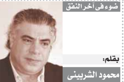
ضوء في آخر النقص بقلم: محمود الشرييني

أهمية قانون المحليات ويعد قانون الإدارة المحلية من التشريعات المركزية التي تنظم العديد من القضايا والمشروعات المرتبطة بالتنمية المستدامة على أداء الأجهزة الحضرية، فضلاً عن مجابهة الفساد داخل الأحياء والوحدات المحلية في القرى والمدن والمراكز، ومراقبة أداء الأجهزة التنفيذية، وتعزيز قيمة العمل والإشراف إلى مؤازرة الضعف في الإدارة وتعريف القاصدين وترسخ للامركزية ودعم خطط التنمية الاقتصادية والاجتماعية.