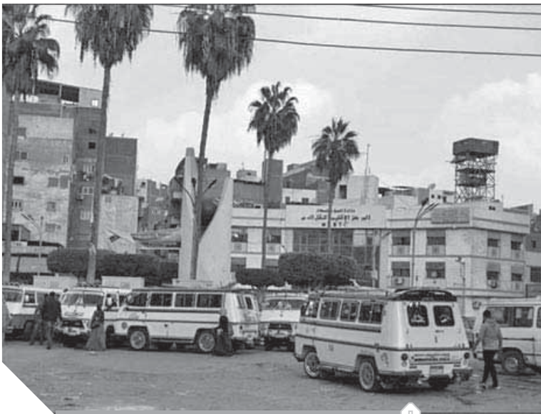
عشوائية الميكروباصات فى الميدان

ورغم أن هذا الميدان يحمل الصبغة التاريخية لوجود مقام الشيخ حسانين منذ الأربعمئات من القرن الماضى، وأهميته لأنه أكبر ميدان يربط أكبر عدد من شوارع وسط مدينة المنصورة، حيث يعد من أعلى الكثافات المرورية، فإنه لم يخط باهتمامات المسئولين، الأمر الذى يتطلب حلولاً تصميمية بشكل جمالى يحمل معه الطابع الإسلامى والتاريخى، كما أن هناك كشك الكهرباء موجود وسط الميدان، وهذا يتطلب ضرورة نقله، وإعادة الرؤية من إدارة المرور لأماكن الانتظار العشوائية، وخاصة المنطقة فى اتجاه مدرسة فريدة حسان والتي تغلق الشوارع من الجانبين دخول وخروج، كما يتعين على وجود نقطة مركز لشرطة المرافق للتصدى للبااعة الجائلين والذين يساهمون فى أزمة المرور اليومية.