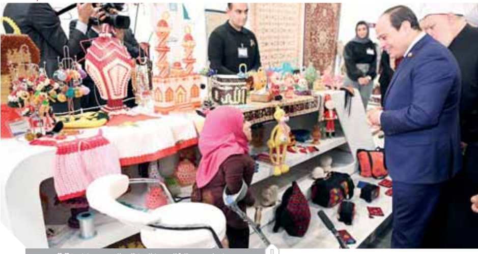
الرئيس يتفقد منتجات متحدى الإعاقة

أصحاب الهمم والعزيمة حققوا نتائج غير مسبقة في مختلف المجالات أطالب الجميع بمكافحة ظاهرة التمر وتعزيز المشاركة المجتمعية