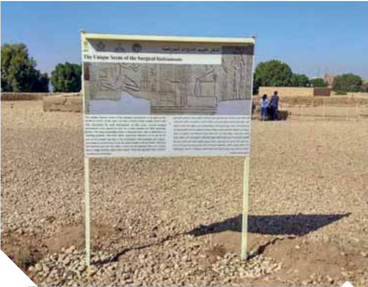
لوحة الجراحة الفرعونية الشهيرة بمعبد كوم أمبو

وأضاف أن هذه اللوحة الجديدة ستسمح للمرشدین الساجحين بالوقوف مدة أطول للشرح فى مكان أوسع بدلاً من الممر الضيق، مما يسهل أيضا حركة باقى الزائرين داخل