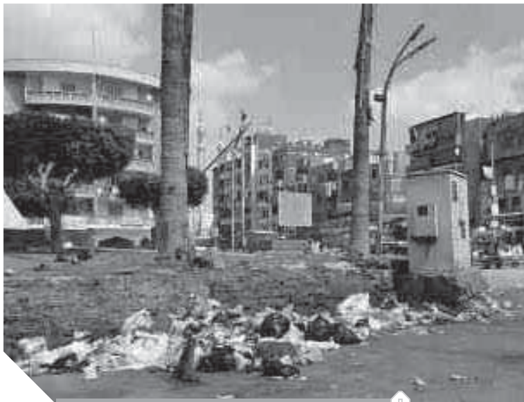
القمامة تحيط بميدان الشيخ حسانين