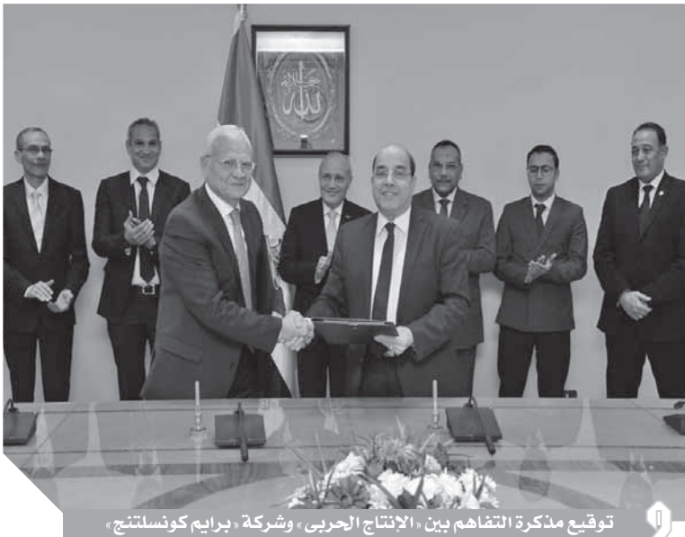
توقيع مذكرة التفاهم بين «الإنتاج الحربى» وشركة «برايم كونسلتنج»

بين «الهيئة القومية للإنتاج الحربى» وشركة «برايم بيرنيس كونسلتنج» فى مجالات تقديم الخدمات الاستشارية لإدارة المشروعات فى إطار استراتيجية التحول الرقمى والاستفادة من خبرات شركة «برايم بيرنيس كونسلتنج» فى تنفيذ عدد من الأعمال وهى (مراجعة التعاقدات الحالية لشركات الإنتاج الحربى وتقييم درجة فاعليتها لتحقيق الأهداف المرجوة على مستوى أداء الأعمال «Busi- ness Layers» - وتحديد الفجوات المؤثرة على نجاح المشروعات التى تقوم بها الشركات التابعة لوزارة الإنتاج الحربى ومخططات تعديلا لتحقيق أهداف أداء الأعمال - اقتراح مشروعات للجهات المختلفة بالدولة فى إطار استراتيجية التحول الرقمى - المشاركة فى تحديد الفرص سريعة العائد «Quick Win»، - تقديم الاستشارات فى مجالات التحول الرقمى والأنشطة المرتبطة ب مجالات التصنيع الإلكتروني).