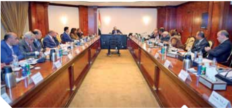
جانب من اجتماع عمرو طلعت بأعضاء لجنة حماية حقوق المستخدمين

ميجابات الثانية، كما تم إنشاء مركز مراقبة جودة خدمات الاتصالات التابع للجهاز القومى لتنظيم الاتصالات بهدف إجراء قياسات دورية لجودة خدمات الصوت والإنترنت المقدمة من شركات الاتصالات العاملة فى مصر، وإتاحة تقارير القياسات شهرياً للمواطنين.