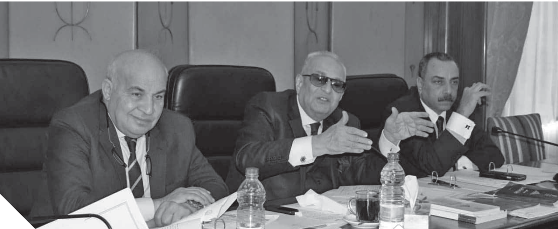
اجتماع لجنة الشئون التشريعية والدستورية برئاسة المستشار بهاء الدين أبوشقة