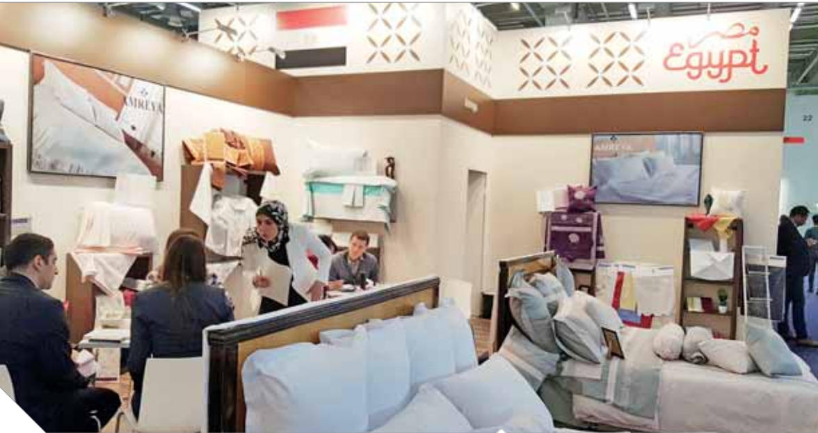
المعارض الخارجية أهم وسائل زيادة الصادرات

مؤكدين أنهم ينتظرون المعرض من عام إلى آخر لتعويض خسائرهم على مدار العام. وأخيراً وليس آخراً فقد تلقت «الوهد» نص الخطاب الموجه من الدكتور عبدالعزيز الشريف الحالى وموجه إلى إدارة معرض «ميسا فرانكفورت» يؤكد لهم فيه عدم اشتراك الشركات المصرية في الدورة الحالية للمعرض التي ستبدأ في ٧ يناير القادم وتنتهى في ١٠ من نفس الشهر وهو الخبر إلى تلقته الشركات بالصدمة، وكان هذا القرار هو أول القرارات التي اتخذت في عهد الحكومة نيفين جامع وهى التي تتحسس أولى خطواتها للنجاح داخل الوزارة.