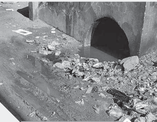
الجرارى تحاصر مسجد السيدة عائشة بالخانكة