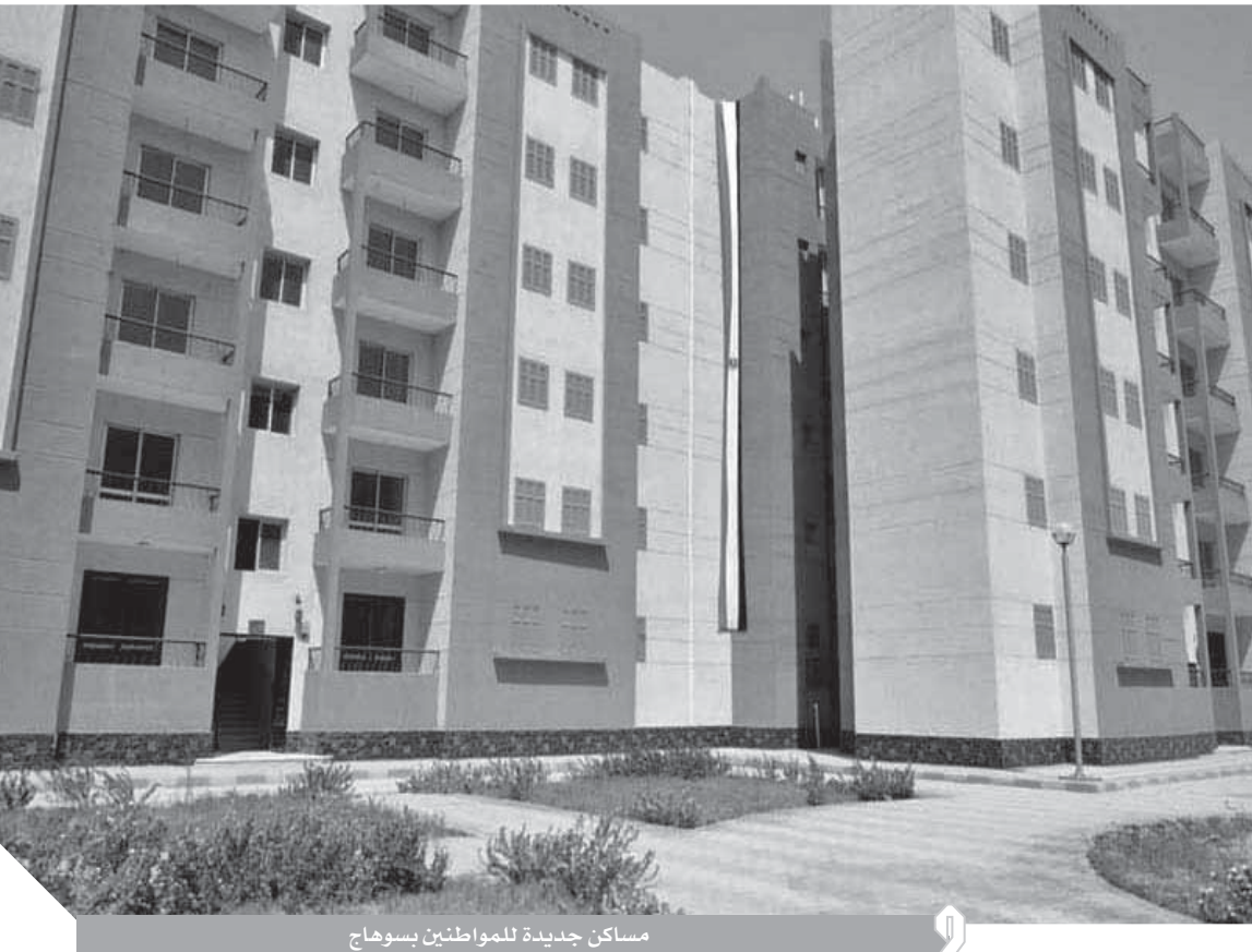
مساكن جديدة للمواطنين بسوهاج

تطوراً ملحوظاً فى مجال المنظومة الصحية والتي أسهمت بشكل كبير فى تقديم خدمات طبية راقية للمرضى بتكلفة بلغت ٢ مليار ٩٨٤ مليوناً و٥٣ ألف جنيه منها التطوير الشامل لمستشفى جرجا العام بتكلفة إجمالية ٢١٩ مليون جنيه والذي بلغت نسبة التنفيذ بها حتى الآن ٤٧ ٪ وكذلك تطوير مستشفى جھينة المركزى بتكلفة ١٨٠ مليون جنيه بنسبة تنفيذ بلغت ٤٤ ٪ حتى الآن وتطوير مستشفى دار السلام المركزى بتكلفة إجمالية بلغت ١٦٤ مليون جنيه بنسبة تنفيذ ٤٠ ٪ وتطوير المستشفى المركزى بساقلته بتكلفة ٢٨١ مليون جنيه حيث تم الانتهاء من أعمال الھدم وتوصيل شبكة التغذية وتطوير مستشفى طما العام بتكلفه ٢٩٠ مليون جنيه وتم أيضاً الانتهاء من أعمال الھدم وجار أعمال الجساتنالكيدية وتم عمل عيادات خارجية مؤقتة لتسيير أعمال المستشفى وكذلك إحلال وتجديد مستشفى سوھاج للصحة النفسية بتكلفة ١٢٥ مليون جنيه بنسبة تنفيذ بلغت ٨٥ ٪ وإنشاء مستشفى لعلاج الإدمان بناحية بلصفورة وتنفيذ شبكة الغاز بتكلفة ٤٠٠ مليون جنيه وبلغت نسبة التنفيذ حتى الآن ٥٥ ٪ وتطوير جناح العمليات والعناية المركزة وشبكات الغاز