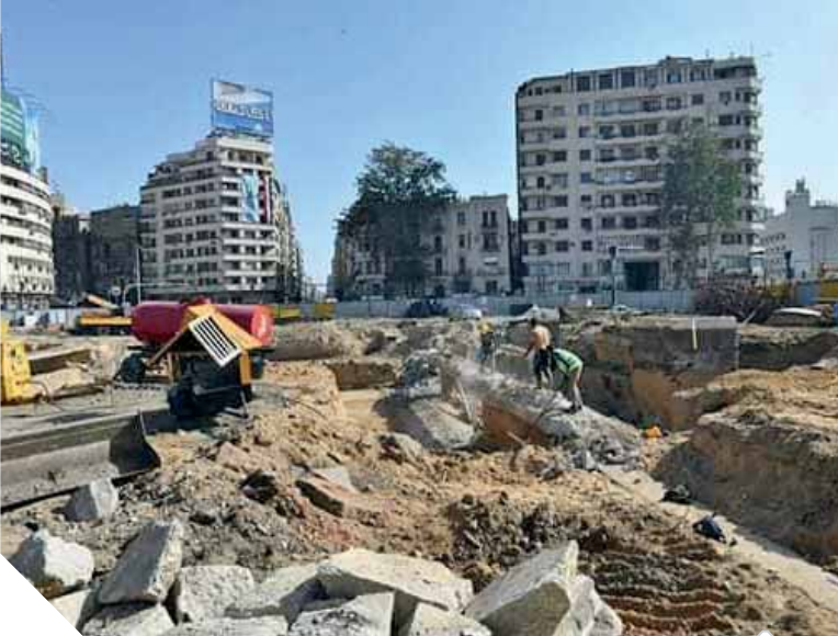
تجهيز ميدان التحرير للشكل الجديد

إلى منسوب محطة مترو السادات من أجل إنشاء القاعدة التى توضع عليها المسلة وزن ٦٠٠ طن. وأكدت المحافظة، أن أعمال التطوير تشهد تنفيذ ٩ كمترات بطول ١٦ متراً وارتفاع ٢,٣٠ وعمل مشايات مكونة من بلاطات خرسانية وعلى جانبيها خرسانة ملونة وزراعة نخيل وعمل أماكن للجلوس عبارة عن بلوكات خرسانية وبعض المقاعد الرخامية تم تنفيذها بإدارة الخرسانة الجاهزة:إضافة إلى عمل نظام إضاءة أرضية وأحواض بها شجيرات زيتون وتركيب أجهزة إضاءة بها لإضفاء شكل جمالى ينسجم مع الطابع الفرعونى وأعمال التطوير بالميدان، ويأتى هذا فى إطار التعاون المستمر بين وزارات الإسكان والآثار والثقافة ومحافظة القاهرة.