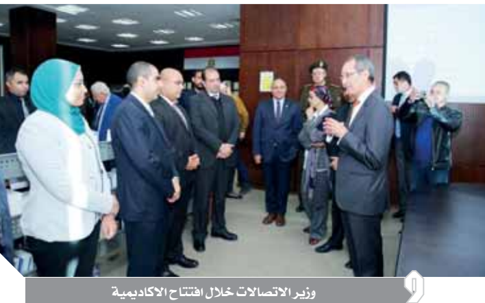
وزير الاتصالات خلال افتتاح الأكاديمية

المتدربين فى مجالات التكنولوجيا المتقدمة مثل إنترنت الأشياء وسلسلة الكتل والتي تمثل أهمية كبرى من أجل تحقيق التحول الرقمى؛ مشيراً إلى أن مشروعات التحول الرقمى تتيح فرص عمل هائلة للشباب. وقد شهد الدكتور عمرو طلعت مراسم توقيع مذكرة تفاهم بين معهد تكنولوجيا المعلومات والأكاديمية العربية للعلوم والتكنولوجيا والنقل البحري - كلية الحاسبات وتكنولوجيا المعلومات بشأن التعاون من خلال استخدام الكلية لبرامج المعهد الجديدة المضمدة بآلية التعلم الدمج (مهارة - تك)، وكذلك استخدام المعامل المتخصصة والموجودة بالمعهد لدعم النواحي التطبيقية من البرامج كما هو متاح فى تخصص إنترنت الأشياء. وقد مذكره التفاهم الدكتور هبة صالح علياء يوسف عميدة كلية الحاسبات