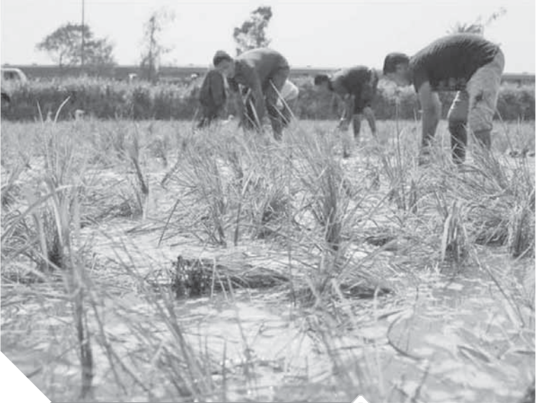
الري بالتنقيط هل يسد العجز فى المحاصيل الزراعية؟

وسبق أن قامت وزارة الزراعة باتخاذ عدة إجراءات تنفيذية عاجلة لتوفير المياه، والحد من زراعة المحاصيل الشرهة للماء وخاصة قصب السكر والموز، وأصدر وزارة الزراعة الأسبق الدكتور عبدالمنعم البنا قراراً رقم ٧٩ لسنة ٢٠١٨ بحظر زراعة المحاصيل شرهة المياه، وطبقاً للقرار تم تحديد ٥٣ صنفاً من تقاوى أصناف بعض