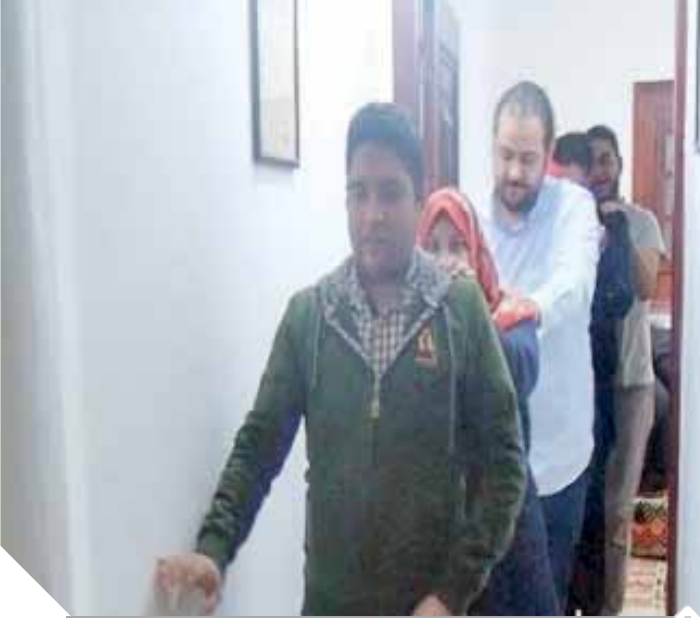
مجموعة من ذوى الاحتياجات الخاصة فى المطعم