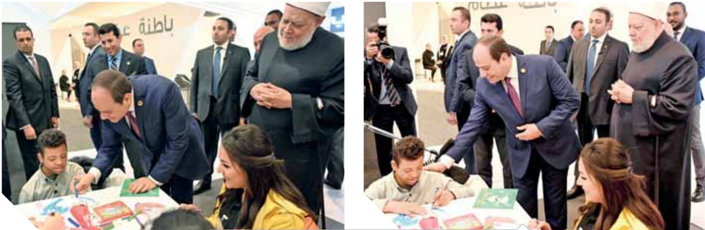
الرئيس خلال تفقده أعمال متحدى الإعاقة

وأضاف: «فعلى صعيد قطاع التعليم، تسعى الدولة إلى تعميق الوعى وصقل قدرات وإمكانات المدارس والمدرسين بكيفية الطرق الحديثة فى التعامل مع ذوى القدرات الخاصة، وعلى صعيد قطاعات الإنتاج الفنى والثقافى ينبغي إنتاج العديد من البرامج والأعمال الدرامية والثقافية التى تعكس قدرات وإمكانات