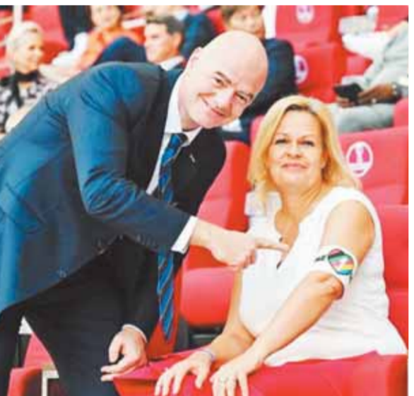
رئيس الفيضا يشير إلى شعار الشواذ علي يد وزيرة داخلية ألمانيا

ونشر النشطاء صورة لرئيس الاتحاد الدولي لكرة القدم الفيفا، وهو يشير إلى علامة الشواذ التي تضعها وزيرة الداخلية الألمانية، بعد أن خلعت الجاكت وتداول النشطاء الصورة بسخرية من رئيس الفيضا لتأييده الشواذ.