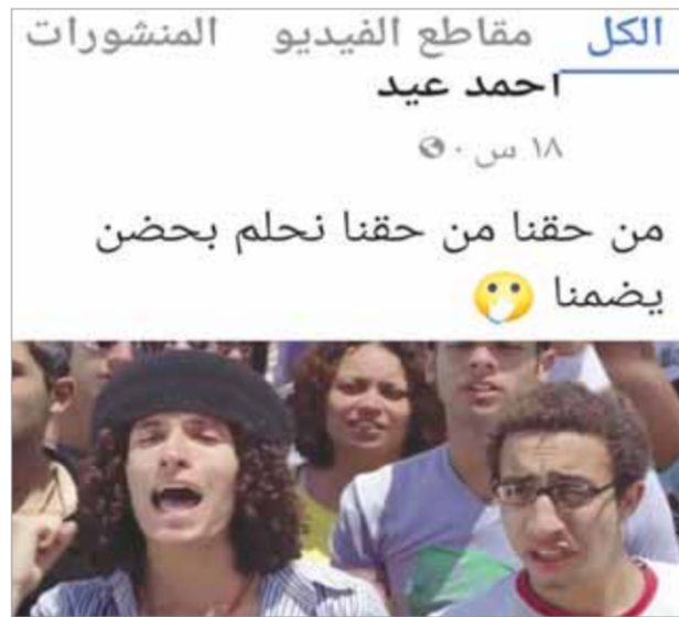
بوست الفنان أحمد عيد

ونشر النشطاء صورة لرئيس الاتحاد الدولي لكرة القدم الفيفا، وهو يشير إلى علامة الشواذ التي تضعها وزيرة الداخلية الألمانية، بعد أن خلعت الجاكت وتداول النشطاء الصورة بسخرية من رئيس الفيضا لتأييده الشواذ.