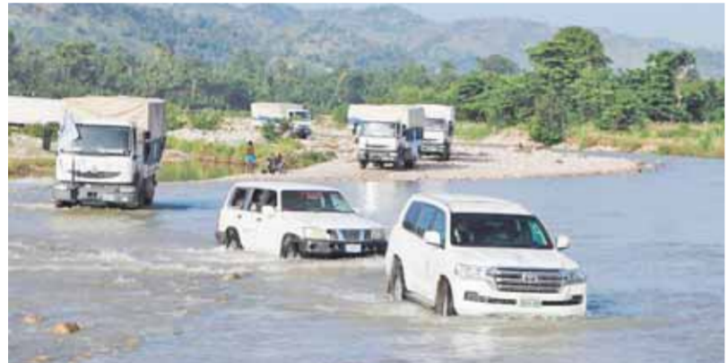
مصر تحتل المرتبة ١٦ بين الدول الأكثر تضرراً

كتبت - فاطمة عياد: تحت عنوان «أفضل الأماكن للسفر إليها في فصل الخريف: عشرات الأماكن الرائعة حول العالم»، نشر موقع CNN Travel الأمريكي الشهير تقريراً أوضح خلاله أن مصر جاءت ضمن قائمة أفضل ١٢ مقصداً سياحياً للسفر إليه حول العالم في فصل الخريف خلال العام الجاري، والتي أعدها الموقع. وخلال التقرير تمت الإشارة إلى سهولة السفر إلى مصر خاصة مع إمكانية الوصول إليها عبر دول أخرى سواء في أوروبا أو الشرق الأوسط، بالإضافة إلى الاستمتاع بزيارة أهرامات الجيزة وتمثال أبو الهول الرائع، وزيارة الأقصر وأسوان، وزيارة واحة الفيوم، والتي تعد من الأماكن التي يستطيع السائح مشاهدة الآثار الموجودة بها، والتي ترجع لعصور ما قبل التاريخ، منوهاً عن الفنادق الفاخرة الموجودة في مصر للإقامة بها. وفي ذات السياق، نشر الموقع أيضاً تقريراً آخر مصوراً تحت عنوان «١٢ من أفضل المقاصد السياحية لخريف عام ٢٠٢٢»، حيث استعرض التقرير المراكب الشراعية التي تسير بنهر النيل، حيث الاستمتاع برحلات المراكب الشراعية