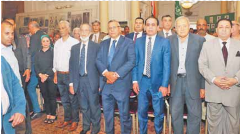
رئيس الوفد وقيادات الحزب يقفون أثناء عزف السلام الجمهوري