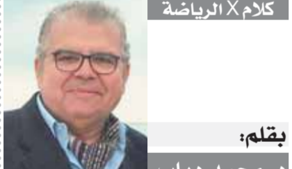
بقلم: محمد دياب