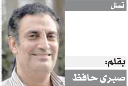
بقلم: صبري حافظ