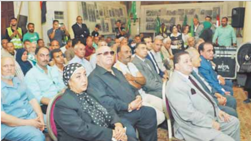
جانب من حضور احتفالية إحياء ذكرى زعماء الوفد