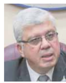
د. أيمن عاشور

كتب- صلاح شرابي: يواصل الطلاب الراغبون في الالتحاق بالجامعات الأهلية، لليوم الثالث على التوالي تسجيل رغباتهم، فيما يتربط طلاب المرحلة الثانية بالتنسيق الحكومي للالتحاق بالجامعات والمعاهد الحكومية نتيجة إعلان تنسيق المرحلة.