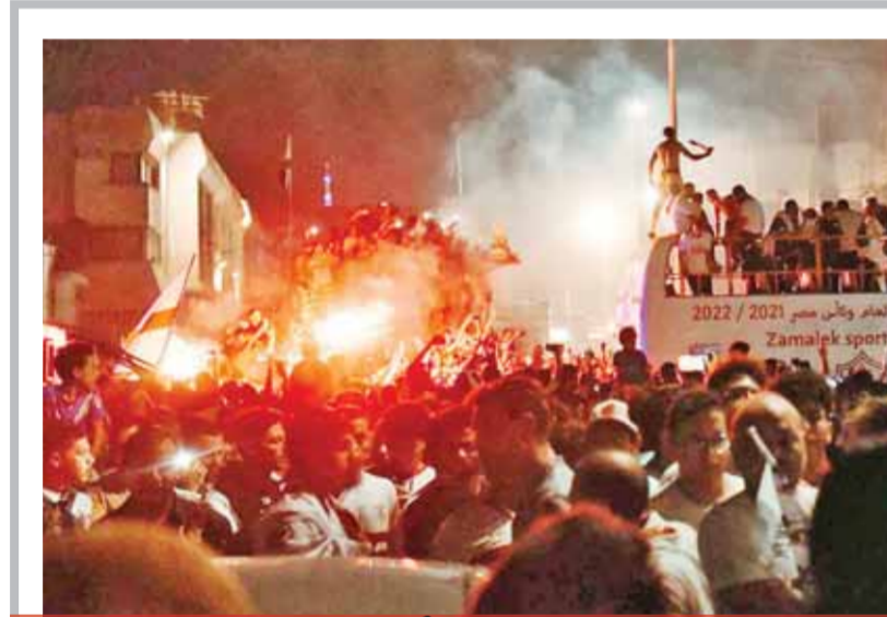
أبطال الدوري يحتفلون مع الجماهير في أتوبيس مكشوف