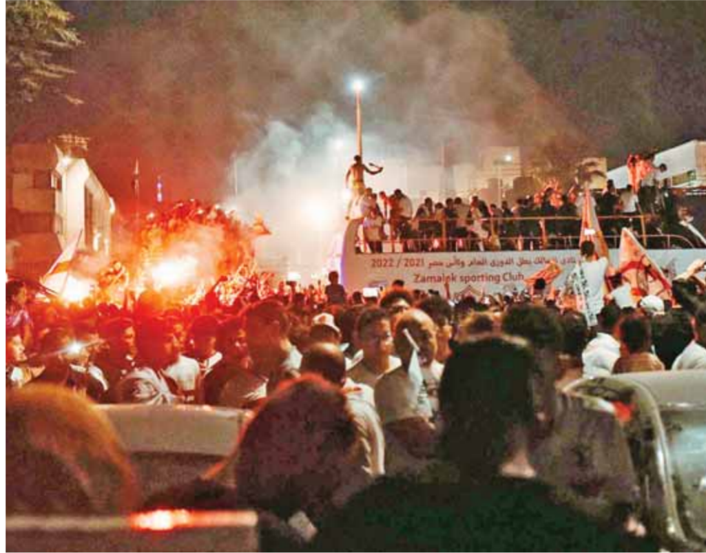
لاعبو الزمالك يحتفلون مع الجماهير في أتوبيس مكشوف