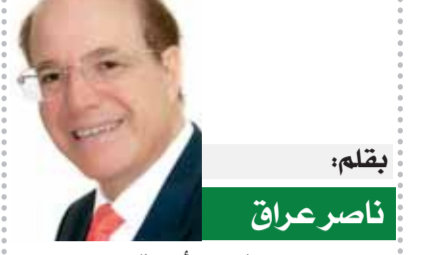
بقلم: ناصر عراق