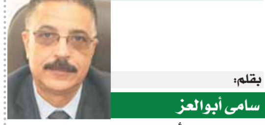
بقلم: سامي أبو الهز