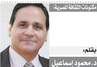
مكونات الثقافة المصرية؛