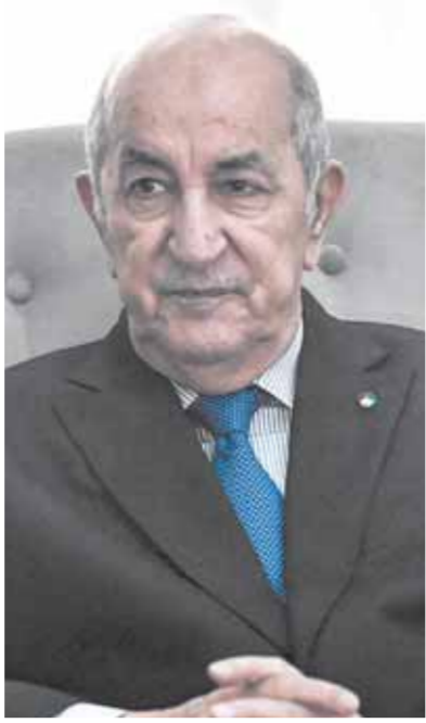
الرئيس عبدالمجيد تبون

نقل إلى الرئيس السيسي، منتصف يناير الجاري، رسالة خطية من الرئيس الجزائري، تضمنت اعتزاز الجزائر بما يربطها بمصر من علاقات وثيقة وتمتد على المستويين الرسمي والشعبي، والاهتمام بتعزيز مجالات التعاون الثنائي مع مصر في كافة المجالات، معبراً عن تطلعه لمزيد من التنسيق والتشاور مع الرئيس خلال الفترة المقبلة لمواجهة التحديات متعددة الأشكال التي تواجهها المنطقة والأمة العربية ودعم العمل العربي المشترك.