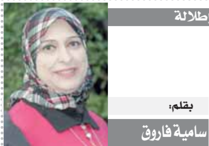
بقلم: سامية فاروق

كتبت - محمد اللاهوتي: يخوض فريق سلة الأهل بالنادي الأهل اختباراً تاريخياً بمواجهة تحديد المركز الثالث بطولة كأس العالم للأندية التي تقام في سنغافورة، واحتل الأهل المركز الثاني في