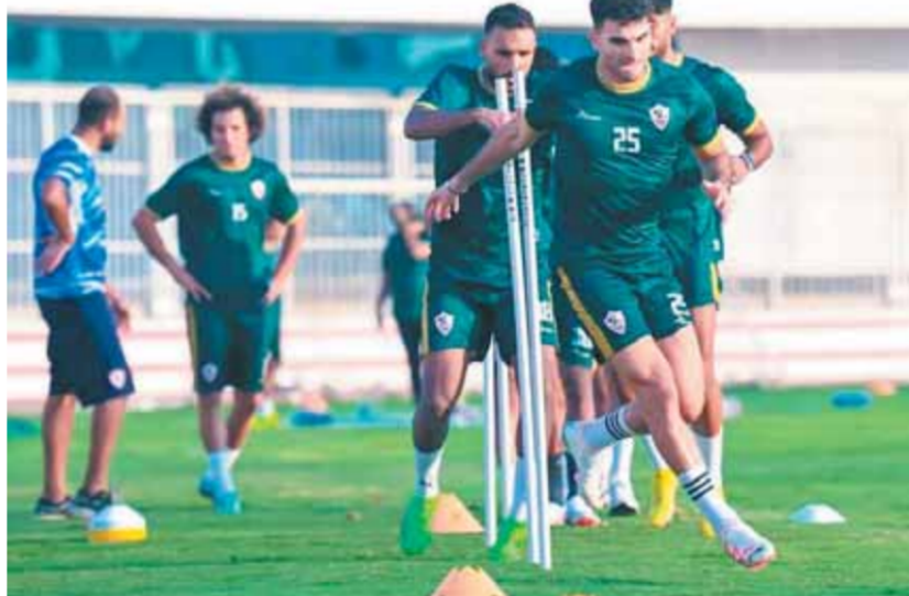
الزمالك يستعد بقوة لقاء المقاولون