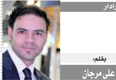
بقلم: علي مرجان