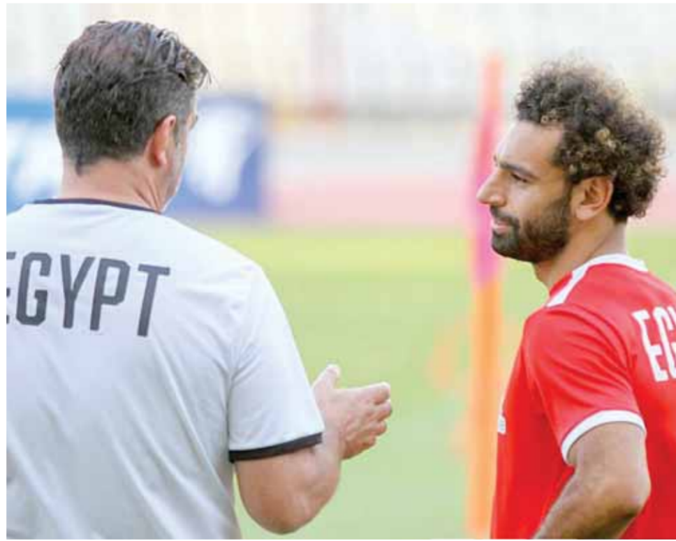
فيتوريا يتحدث مع صلاح عن ترتيبات الفترة القادمة

مصر، أهم شيء لدينا مصلحة منتخب مصر». على الجانب الآخر، شدد أحمد حجازى مدافع المنتخب، على الدور المؤثر الذى يلعبه القائد محمد صلاح نجم ليفربول، مع الفرانعة، قائلا «محمد صلاح قائد المنتخب، ومن أفضل لاعبي العالم، ووجوده يصنع الفرق بصورة كبيرة مع اللاعبين، كما يرفع معنويات الفريق». وأوضح حجازى «الجميع يريد الاستفادة من خبرات محمد صلاح، كل لاعبي منتخبنا لديهم رغبة فى الظهور بشكل أفضل مما مضى». وقال: الجميع يريد تطبيق تعليمات المدير الفني روى فيتوريا بشكل سريع، المعسكر جيد للغاية من الناحية التنظيمية، وهناك حالة كبيرة من التركيز بين اللاعبين». فى سياق آخر، تصل غدا الأحد بعثة منتخب ليبيريا عبر مطار برج العرب، من أجل إقامة معسكر قصير فى الإسكندرية، والاستعداد لمواجهة الفريق يوم الثلاثاء المقبل، حيث يرتبط منتخب ليبيريا فى مارسس المقبل بمواجهتين مصيريتين أمام جنوب إفريقيا فى الجولتين الثالثة والرابعة من التصفيات المؤهلة لأمم إفريقيا.