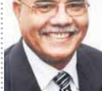
بقلم: د. مصطفى النشار