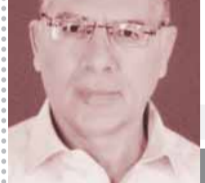
بقلم: د. مصطفى محمود