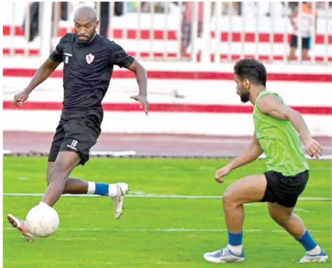
الزمالك يستعد بقوة للقاء بطل تشاد