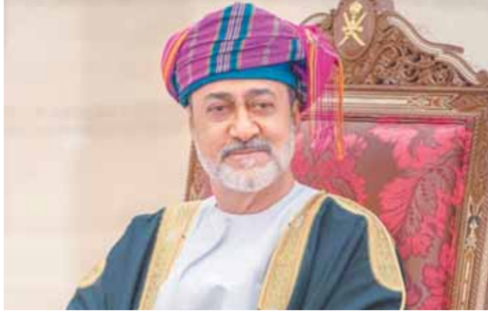
السلطان هيثم بن طارق سلطان عمان