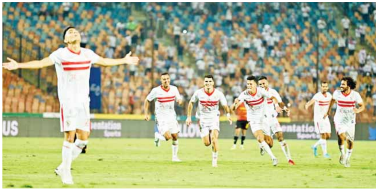
نجوم الزمالك وفرحة الدورى