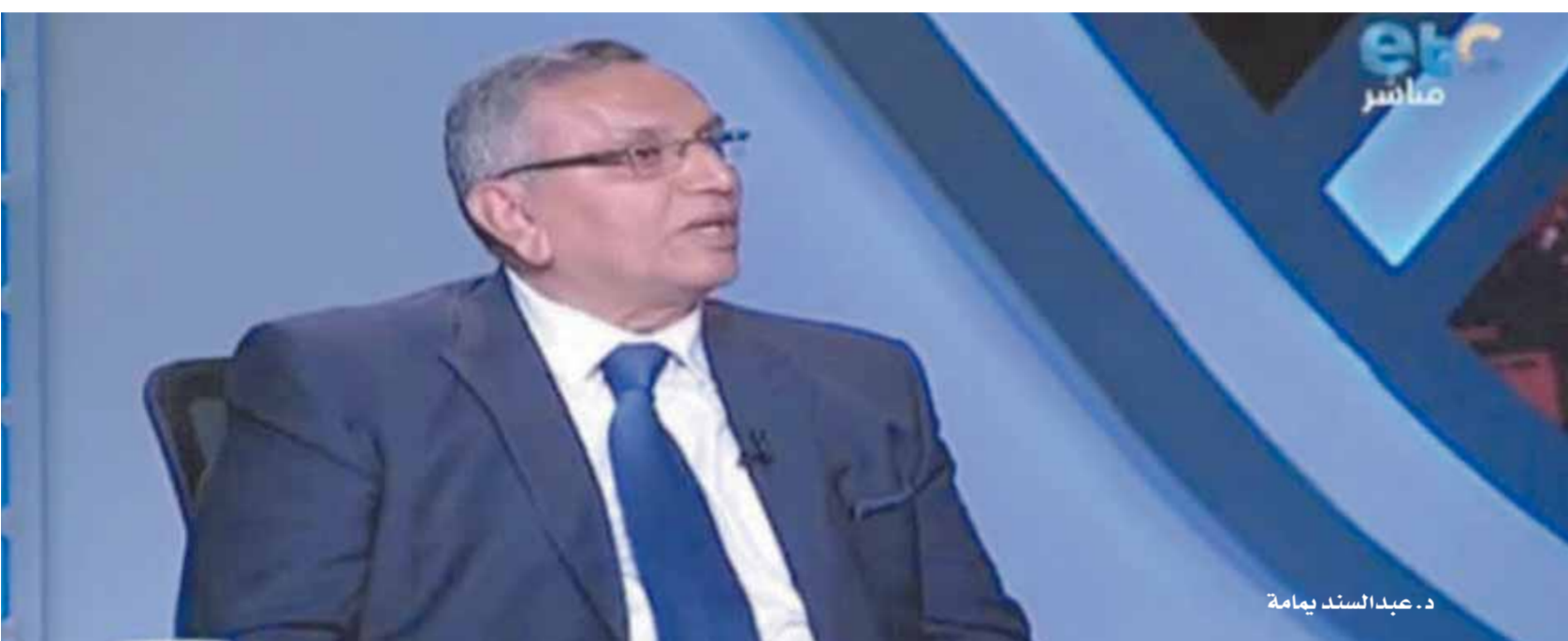
د. عبدالسند يمامة

وأكد رئيس الوفد أن الحوار هو تبادل لوجهات النظر وهو الحياة، ودعوة الرئيس للحوار تعنى أننا بحاجة إليه وأنه مظهر من مظاهر الديمقراطية، لذا فإن الحوار له ضوابط ووضع اعتبارات تراعى السلم العام والمسائل التي تدخل في أبواب الحدود والعبادات والديانات كحق الميراث، الحوار هو مسألة تنظيمية.