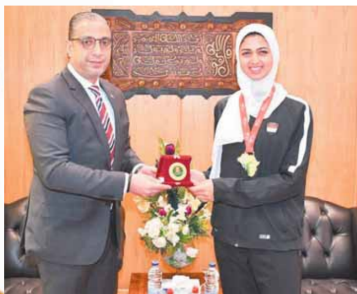
الخامس في أولمبياد الشباب عام ٢٠١٧ و٢٠١٨، والمركز الأول والخامس في المركز الثاني بالبطولة ذاتها عامي ٢٠١٦ و٢٠١٩.