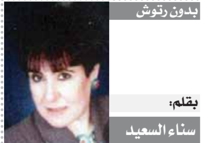
بقلم: سناء السعيد