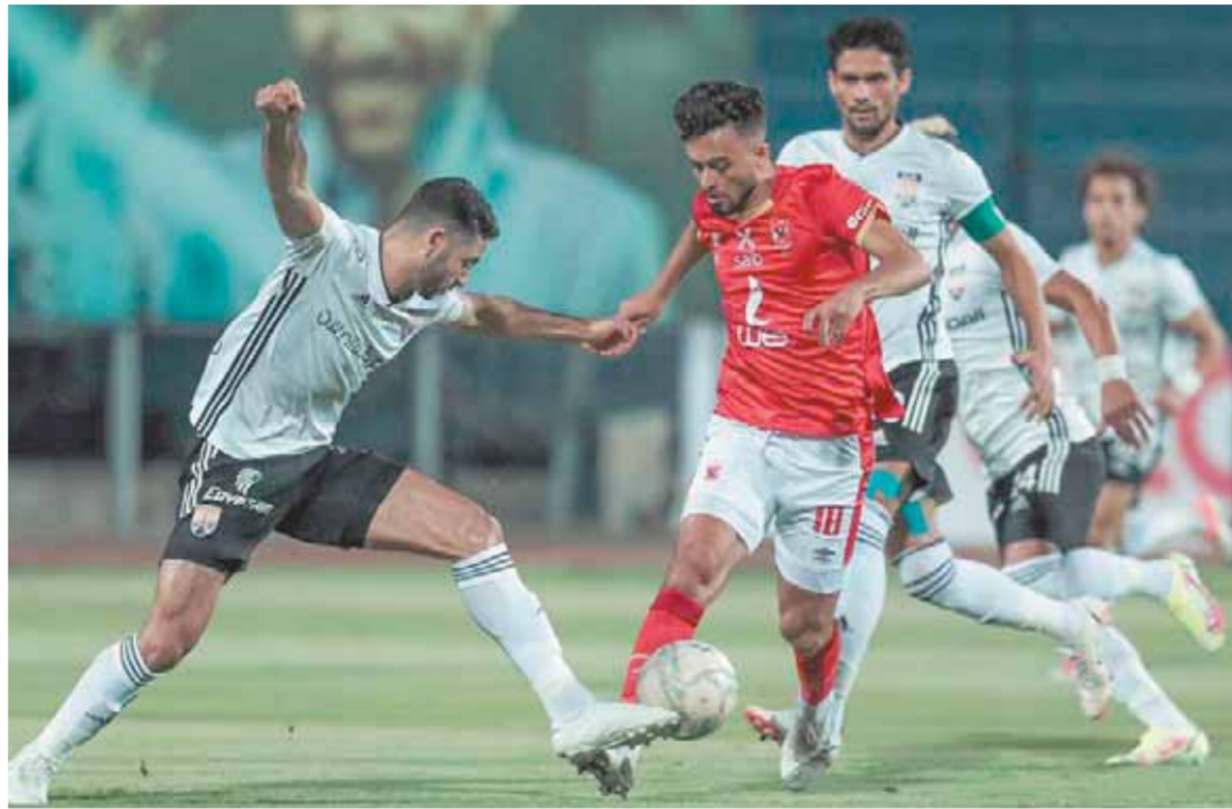
الأهلى يسعى لتخطى مفاجآت الجونة