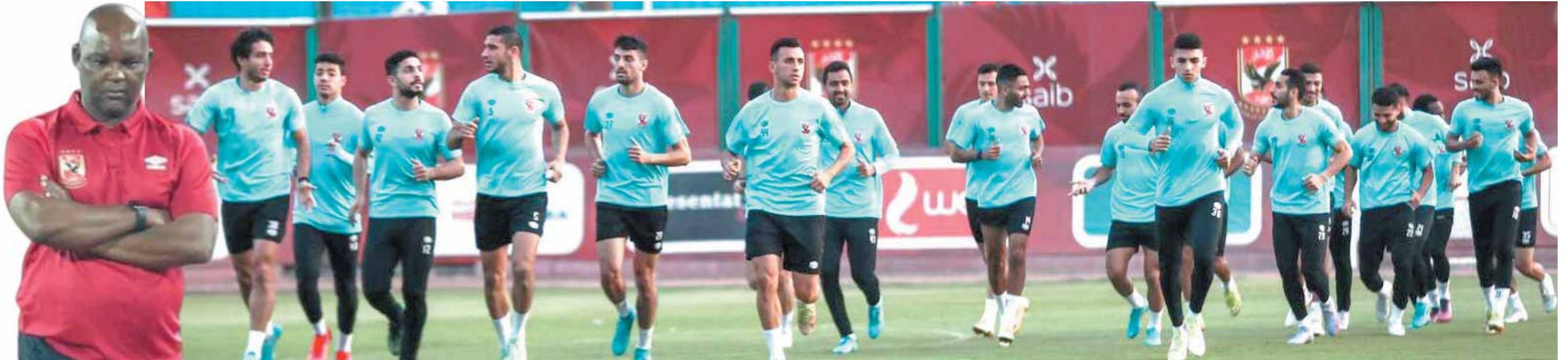
جديدة وتركيز في تدريبات الأهلي