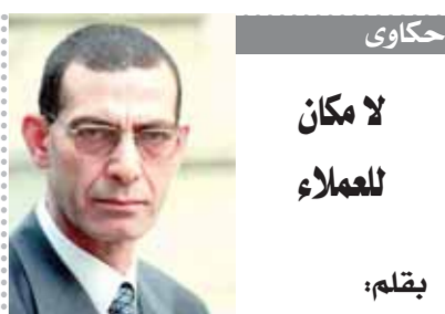
د. وحدى زين الدين

في مصر الجديدة التي يحياها المصريون، لا مكان فيها للخونة والعملاء من أي نوع سواء كانوا إرهابيين أو متلقين أموال أو سماسرة لإحداث الفوضى والاضطراب، ويخطئ من يظن أو يتصور في يوم من الأيام أن المصريين من الممكن أن يتخلوا عن مشروعهم الوطني في بناء هذه الدولة الجديدة، والذي يتصورون أن عجلة التاريخ ستعود إلى الخلف أو الوراء وأهمون أن يدركون طبيعة المرحلة الجديدة التي تمر بها البلاد.