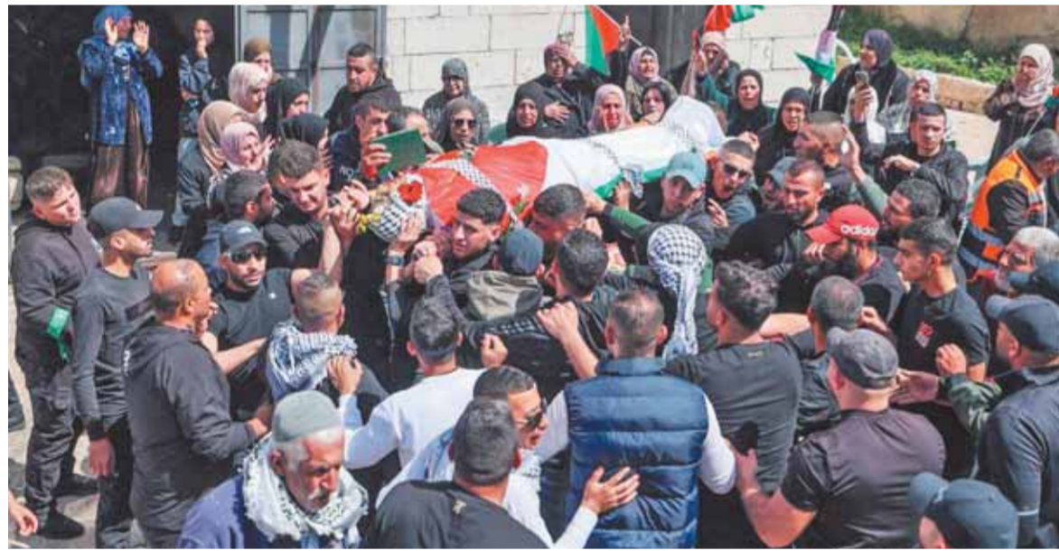
إسرائيل تواصل سياسة الأرض المحروقة وتواصل إحتياله رموز المقاومة الفلسطينية