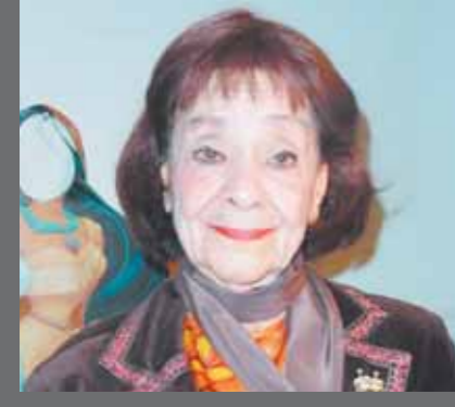
ملعب مطابع الأخبار

كتب- أمجد مصباح: رحلت عنا صباح أمس الإذاعية الكبيرة فضيلة توفيق، أبلة فضيلة، عن عمر ناهز ٩٣ عاماً، وكانت بلا شك من أبرز مذيعات الإذاعة المصرية غير تاريخها.. وارتبطت بها الملايين من أجيال الستينيات والسبعينيات والثمانينات من خلال برنامجها الأشهر غنوة وحدوتة، الذي حرصت على تقديمه لمدة اأثرت