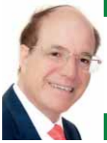
بقلم: ناصر عراق