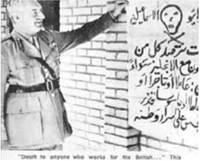
"Death to anyone who works for the British..." This