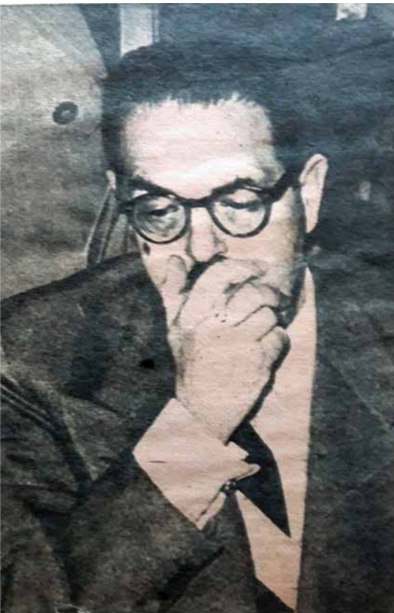
فؤاد سراج الدين وزير الداخلية آنذاك

تم الآن سبعون عاماً على واحدة من أروع معارك الكرامة الوطنية فى تاريخ مصر الحديث، وهى معركة الإسماعيلية سنة ١٩٥٢، التى صارت عيداً رسمياً للشرطة. وهذه المعركة الخالدة كان لها أبطال رائعون شاركوا وضحووا وقدموا الفداء والتضحية على كل شئ طلباً لكرامة الوطن ورفقته بدءاً من اصغر جندي استشهد خلالها وحتى وزير الداخلية نفسه فى ذلك الوقت، وهو فؤاد باشا سراج الدين، الذى كان سكرتيراً لحزب الوفد. لقد تولى «سراج الدين» وزارة الداخلية فى حكومة الوفد الأخيرة عام ١٩٥٠، والتى قام بتشكيلها مصطفى باشا النحاس بعد فوز الوفد بأغلبية كاسحة فى الانتخابات البرلمانية، على خلاف توقعات القصر ومعاملاته تزوير الانتخابات، وكان واضحاً أن السياسى المنكح لديه استعداد للمخاطرة بمصنعه فى سبيل دعم استقلال مصر، وفى سبيل مد الفدائيين بالأسلحة والعتاد.