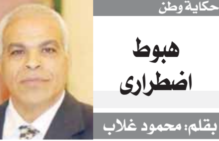
هياوية وطن هبوط اضطرارى