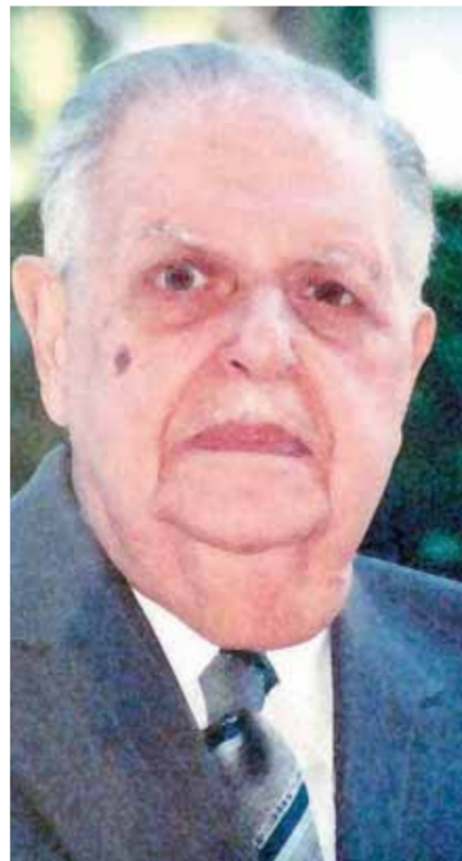
فؤاد سراج الدين

تحل غداً الثلاثاء الذكرى السبعون لمعركة الإسماعيلية التى وقعت فيها الشرطة المصرية موقفاً بطولياً أمام قوات الاحتلال البريطانى، واشتبكت معها دفاعاً عن مدينة الإسماعيلية. بدأت المعركة عندما طلب الجنرال إسكاهم قائد القوات البريطانية من قوات الشرطة المصرية فى الإسماعيلية تسليم كل أسلحتها بسبب امداد الفدائيين بها، واتصل ضابط الاتصال بفؤاد سراج الدين، وزير الداخلية، وقتها وأخبره أن كرامة المصريين تبنى تسليم السلاح، فأصدر الوزير تعليماته برفض الطلب البريطانى والدفاع عن قسم الشرطة حتى آخر رصاصة. وكان الزعيم الوفدى وقتها قد تولى مسئولية وزارة الداخلية بعد فوز الوفد فى الانتخابات التشريعية سنة ١٩٥٠، وهى الحكومة الأخيرة لحزب الوفد.