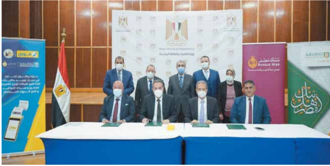
قيادات البنوك والشركة خلال توقيع البروتوكول

ويضم بنك مصر والأهلي دائماً لدعم التحول الرقمي من خلال تقديم الحلول الإلكترونية لتسهيل على العملاء، بما يساهم بصورة أكبر في تقديم الخدمات المصرفية والمالية بصورة ميسرة ومتطورة تلبى احتياجات عملائها، مما يتوافق مع قيم واستراتيجيات عمل البنكين التي تعكس دائماً التزامهما بخطى التنمية المستدامة للدولة.