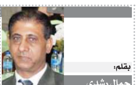
يقلم: جمال رشدى