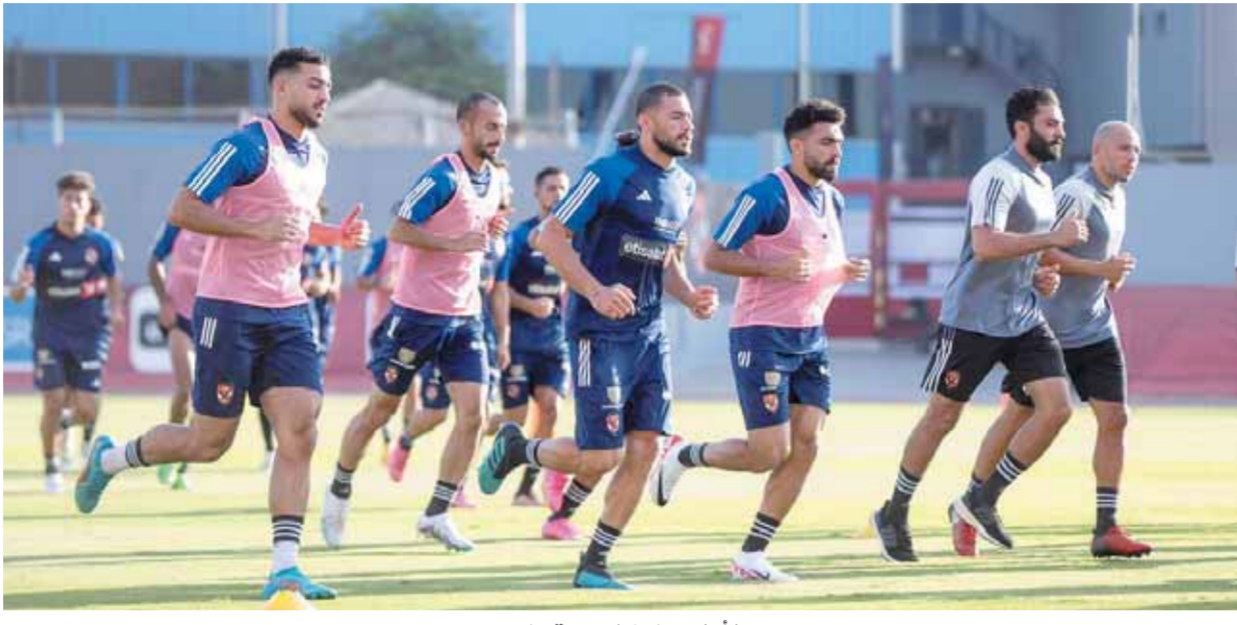
الأهلي جاهز لمواجهة سان جورج

ويأتي على رأس هذه الأندية اتحاد جدة الذي يرغب في تدعيم صفوفه بمدافع مميز خلال فترة الانتقالات الشتوية بعد إصابة أحمد حجازي وأحمد شراحيلي بقطع في الرباط الصليبي، وتلقى عبد المنعم اتصالات من بعض الوكلاء تفيد بترشيحه بقوة لتدعيم صفوف حامل لقب الدوري السعودي ومتابعته في المرحلة القادمة خاصة خلال مباريات بطولة كأس العالم للأندية خلال شهر ديسمبر المقبل، في الوقت الذي أغلق مسؤولو الأهلي الباب نهائياً أمام فكرة رحيل اللاعب هذا الموسم في ظل الاعتماد عليه بصفة أساسية وتألقه في الفترة الأخيرة كما أن هذا المركز يعانى من النقص العددي في بعض الفترات بسبب الإصابات. في المقابل، يستعبد الأهلي تدريباته مساء اليوم السبت استعداداً لخوض لقاء سان جورج الأيوبي المقرر في الساعة مساء غد الأحد بإستاد القاهرة في ذهاب دور الـ ٣٢ بدوري أبطال أفريقيا. وعقد السويسري مارسيل كولر المدير الفني للأهلي جلسات مع لاعبيه ومحاضرة فنية مطولة من أجل غلق صفحة الدوري المحلي