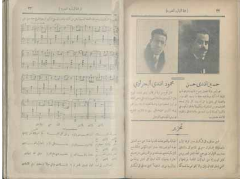
أخطر وثيقة مجلة التياترو المصورة عدد مارس ١٩٢٥ تنشر كلمات، بلادى، والنوطة الموسيقية تأليفاً وتلحيناً للشيخ سيد درويش

الدوريات والصحف والمجلات، صحيفة الأهرام أعداد سنة - ١٩٢٣ صحيفة السياسة - أعداد سنة ١٩٢٣ مجلة الأخبار - فبراير - ١٩٦٦ صحيفة التياترو المصورة - أعداد سنة ١٩٢٥ مجلة المسرح - عدد فبراير - ١٩٧٢