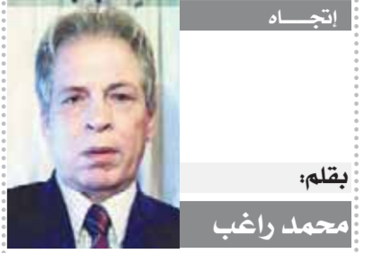
بقلم: محمد رغب