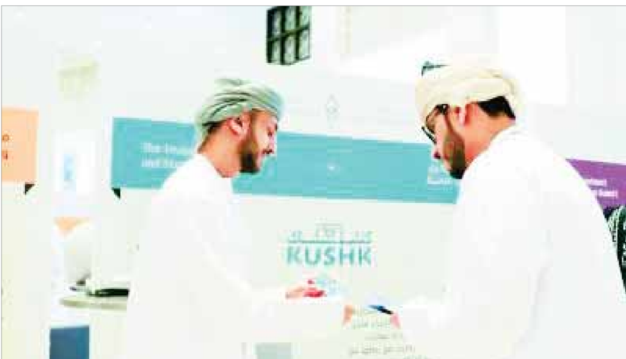
إحدى المبادرات لدعم الشركات الناشئة

●● مصدر التلق، يكمن في تصرفات رئيس الوزراء الأيوبي، الذي خرج الأسبوع الماضي، بعين شمه باقتضاؤه من السد، عند الملء الرابع، وهو ما لم يطمئن له مرهق، ما إن يوقف الملء عند الـ ١٤ مليار متر مكعب، وعلى الرغم من التفاؤل بحذر، إذا كان ما أعلنه صحيحاً، بأنه لا عمليات ملء أخرى، ليلوغ التخزين ٧٥ ملياراً، يظل الموقف المصري، أكثر تشدداً في مواجهة ما تنشئ أن تكون مناورات، كما حدث في مفاوضات «القاهرة»، منذ أسبوعين، وأظنه سيكون كذلك في جولة «ديس أبايا» هذا الشهر، وهو ما يبقى على الدبلوماسية المصرية مهمة تكثيف الضغوط الدولية والأممية، حتى تصالح أيوبيا لصوت العقل والقانون.. وعندها قد نتجنب كارثة انهيار السد.