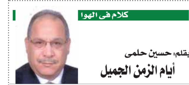
كلام فى الهوا

قلت له: الحقيقة لقد استفدت منك جدا يا بابا اليوم درساً، واختتمت لقائى مع والدى فى رمضان عام ٢٠١٠ وعلقت فى ذهنى كلمات تراثية: «أهم شيء فى العمل الدرامى الورق، إذا لم يكن الورق جيداً، فسوف يكون العمل غير جيد» رحم الله والدى ممدوح الليثى الذى أتمنتا بالعديد والعديد من الأعمال الدرامية وأسكنه فسيح جناته.