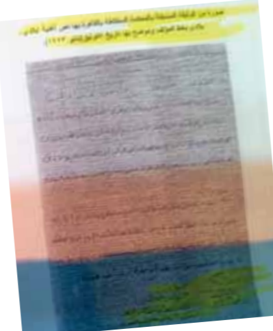
الوثيقة التي قال القاضى إنها مسجلة فى الشهر العقارى عام ١٩٢٣ والشهر العقارى نشأ أصلاً ١٩٢٦