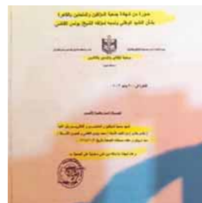
شهادة التسجيل فى الجمعية عام ١٩١٨ ثم تسجيلها مرة أخرى عام ١٩٢٦

وأما الكلمات المضافة للكلمات الأصلية والتي سجلها باسمه الشاعر محمد يونس القاضى فى جمعية المؤلفين، التي كان هو أول رئيس لها من ١٩٢٨ وحتى ١٩٣٧ (وكان مساهم الوظيفي وقتها رفيقنا على الأغاني) وجاء تسجيلها بعدما قدم للجمعية الوثيقة التي يشير لنا إليها الكتاب، والتي لا أصل لها كما سبق وذكرنا -بعدم ادعى على غير الحقيقة أنه سجلها فى المحكمة المختصة ومن ثم فى جمعية المؤلفين والمحلين سنة