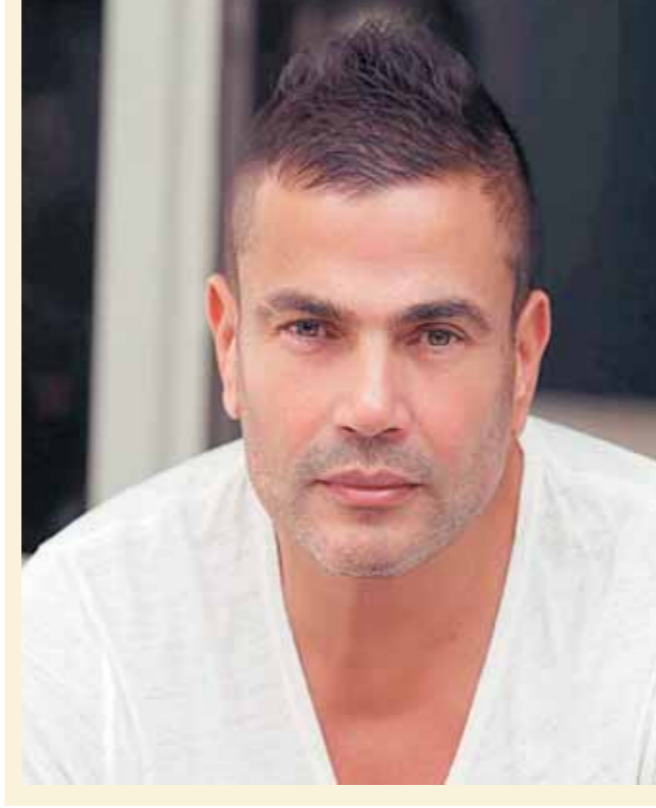
تصميم مطابع الأخبار