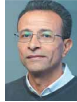
خيري حسن يكتب:

«مصر يا أم العجايب شعبك أسيل والخيم غايب خلي بالك من العجايب، كان هذا هو النداء، أو الرجاء، أو الدعاء من الشيخ سيد درويش - مصر التي أحبها، وكتب، ولحن، وغنى، وعاش لها. ومات من أجل عزتها، وحريرتها، واستقلالها، وكرامتها.»