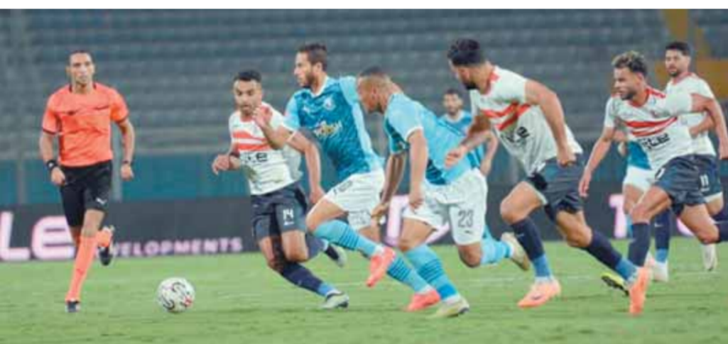
الزمالك وبيراميدز ارتضيا بالتعادل في افتتاح الدوري