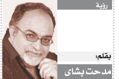
بقلم: مدحت بشاي