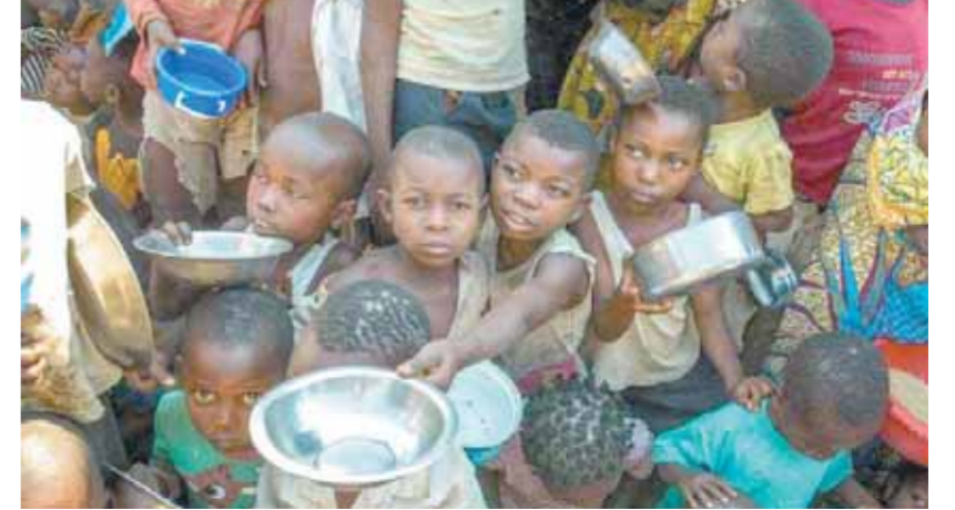
الجميع يعاني من سوء الأوضاع بسبب العقوبات على النيجر

كتب - سحر رمضان: حذر برنامج الأغذية العالمي أمس من أن أكثر من ٩٠ ألف رضيع يعانون من سوء التغذية في النيجر معرضون للخطر لأن إغلاق الحدود في البلد الذي مزقه الصراع يمنعه من استيراد بعض المواد الغذائية. وأضاف البرنامج أن إمدادات تقدر بأكثر من ٩٢٠٠ طن من «الأغذية الإنسانية الحيوية» قد توقفت في ميناء لومي في توجو وعلى الحدود بدائل