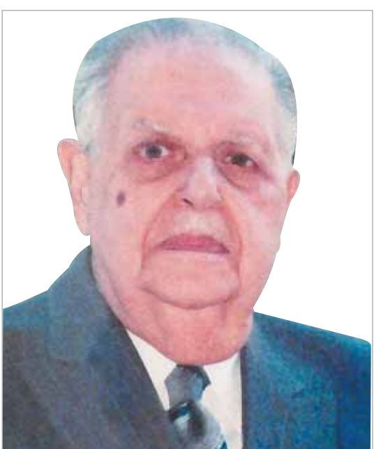
فؤاد سراج الدين

العاملين في الجهات الحكومية إنجازات مدفوعة الأجر؛ وتم احتساب أسبوعين لمن قضى في عمله عاماً؛ وثلاثة أسابيع لأكثر من عام في عمله؛ وأيام الجمع؛ وعطلات العطلات الرسمية والأعياد الدينية؛ ومجموعها ١٤ يوماً؛ استجابة لتقاية عمال المطابع الأميرية!! وأصدرت القانون رقم ٦٤ لسنة ١٩٣٦؛ أول قانون لتعويض إصابات العمل؛ في تاريخ البلاد!! كما أصدرت قانون اللغة العربية؛ والزمت بموجبه الشركات المساهمة والمصارف والبنوك الأجنبية؛ بتعريب مراسلاتها!! وتوجت حكومة الوفد إصلاحاتها الوطنية والاقتصادية؛ بقانون حظر تملك الأجانب للأراضي الزراعية في البلاد؛ وإنهاء قانون سخرة النيل؛ الذي كان يساق الشباب بموجبه؛ لحراسة جسور النيل خلال مواسم الفيضان قبل عام ١٩٣٦!! كما ألغت الحكومة الوفدية؛ ضريبة الخفر التي كان يحصلها عمدة القرى ومشايخها من الفقراء دون الأغنياء؛ تحقيقاً للعدالة الاجتماعية!! وقررت حكومة النحاس باشا؛ تعليمة لأول أسوان عام ١٩٢٧ وهو أحد أهم إنجازاتها لحماية البلاد من أخطار الفيضانات المدمرة لجسور النيل؛ فضلاً عن توفير المياه اللازمة للزراعة طوال العام. وتصدت لمحاولات التحايل على الدستور؛ ورفضت تعيين الملك لأعضاء في مجلس الشيوخ؛ وموظفين أجانب في القصر والخاصة الملكية؛ دون تدخل الحكومة المنتخبة بإرادة شعبية ووفقاً للدستور!!