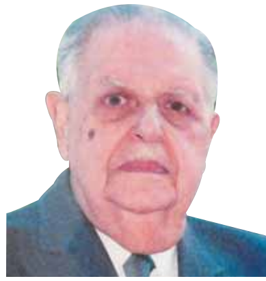
فؤاد سراج الدين