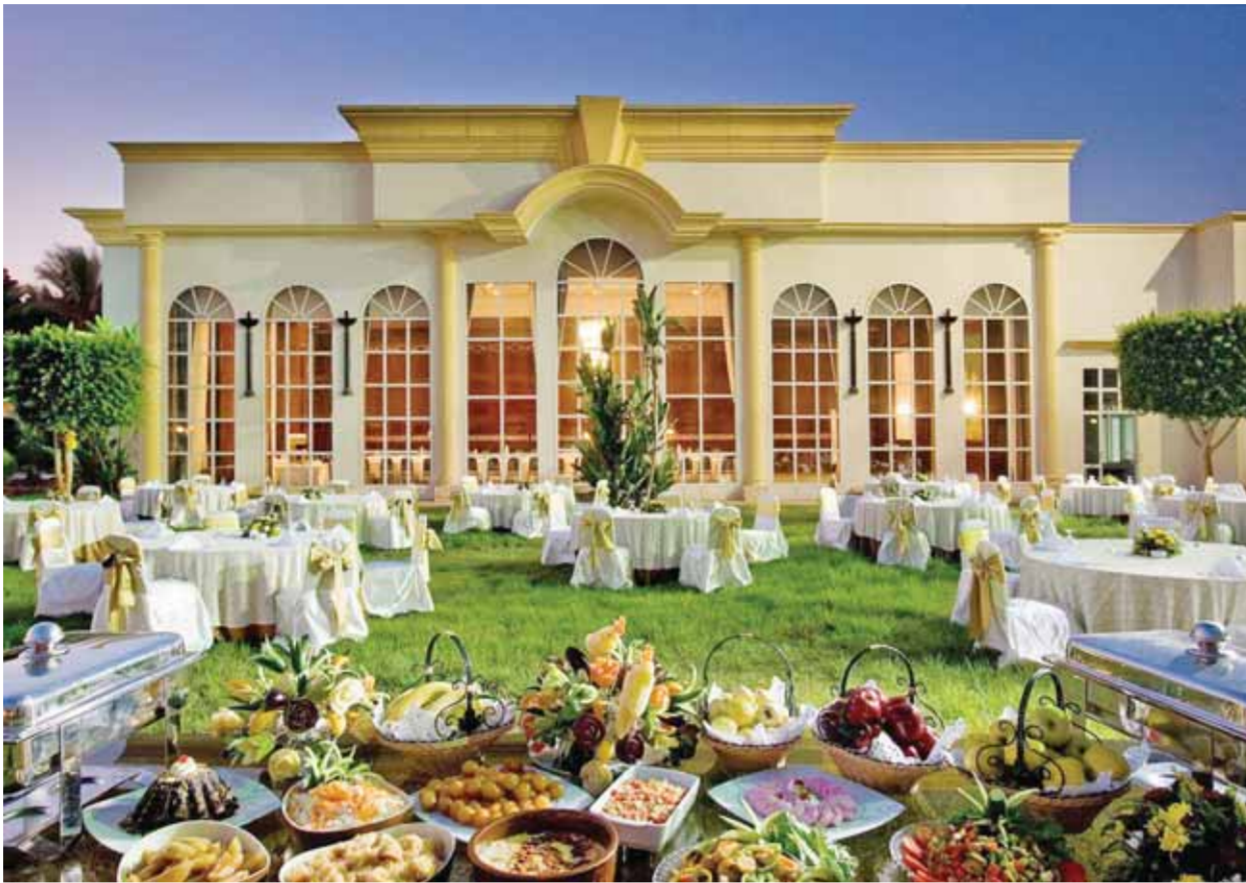
فندق كتركت وينتر بالاس

وما يذكر أنه تم تنفيذ أعمال إضاءة ميدان التحرير من قبل شركة مصر للصوت والضوء ضمن مشروع تطويره، بالتوازي مع مشروع تطوير منطقة القاهرة الخديوية. ويجري حالياً إعادة هيكلة شاملة وإحياء شركة مصر للسياحة، بهدف الترويج للمقاصد السياحية غير التقليدية، وتطوير منصة إلكترونية لحجز تلك المقاصد سيتم إطلاقها في سبتمبر ٢٠٢٢.