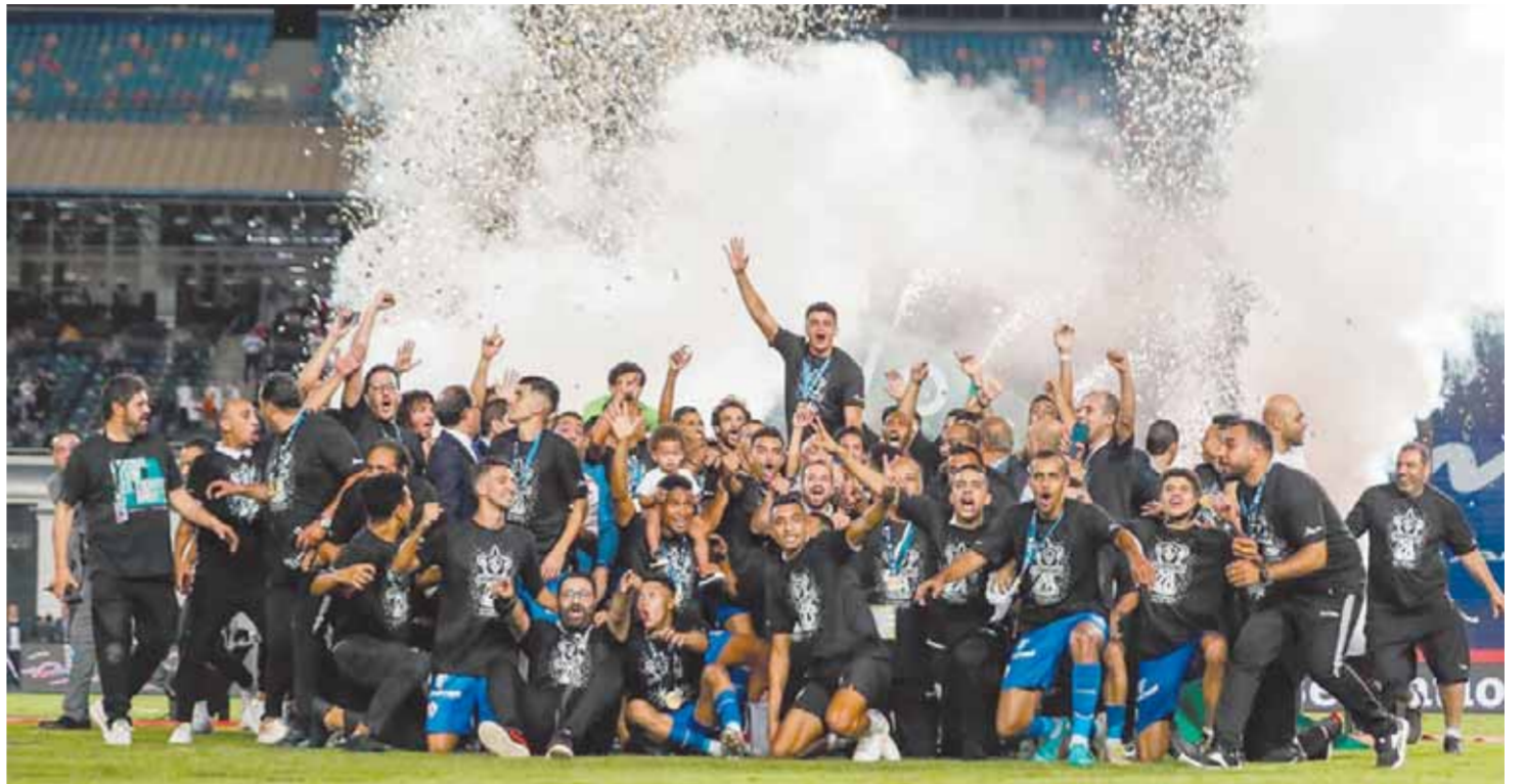
فرحة لاعبي الزمالك بالتتويج بالكأس